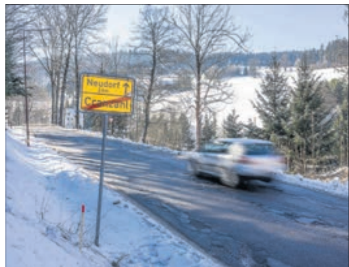
Am 27. Februar beginnen die Arbeiten an der 900 Meter langen Schlaglochpiste zwischen Neudorf und Cranzahl. Kosten: 3,4 Millionen Euro. Bauzeit: mindestens 20 Monate! Meist unter Vollsperrung.

Die Gemeinde Sehmatal ist mit rund 850.000 Euro beteiligt, die Mitteldeutsche Netzgesellschaft Strom GmbH mit rund 100.000 Euro. sg