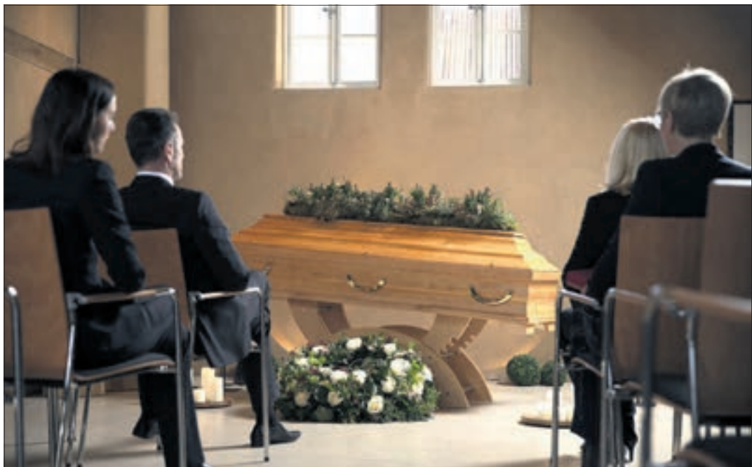
Vor der Bestattung erfolgt eine Trauerfeier, bei der Angehörige, Verwandte und Freunde zugegen sind.

Die Erdbestattung in einem Sarg ist eine traditionelle Bestattungsform. Der Sarg wird oft auf einem