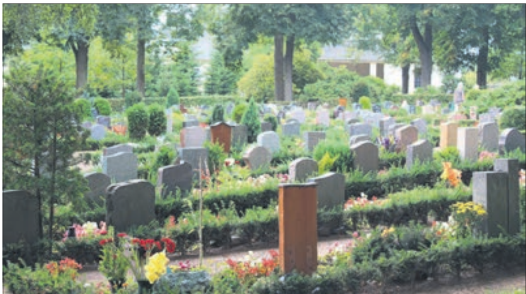
Der Friedhof ist nicht nur ein Ort für Bestattungen und für Erinnerungen, sondern er zählt auch zum immateriellen Kulturerbe.

Vor anderthalb Jahren wurde Deutschlands Friedhofskultur in das Bundesweite Verzeichnis des immateriellen Kulturerbes aufgenommen. Darunter versteht sich das Zusammenspiel der Friedhofsgestaltung und dem Beisetzungsritual; die Trauer- und Erinnerungskultur und die kleinen Gärten der Erinnerung, also die individuell gestalteten Grabstätten. Der Friedhof als Ort und das Ritual als Ereignis wird seit Jahrhunderten über die Generationen weitergegeben und dabei stetig erneuert, verändert und weiterentwickelt. Kultur bleibt nie stehen und sie soll es auch nicht. Denn: Die Friedhofskultur prägt unser Leben und unser Selbstbild mit. Die identitätsstiftende Kraft reflektiert die Leistungen unserer Vorfahren sowie die Geschichte und Struktur unserer Gesellschaft. Der Kulturraum Friedhof ist primär der Beerdigungsort - mitten zwischen den Lebenden - für die verstorbenen Mitglieder der örtlichen Gemeinschaft. Alt-ehrwürdige Baumriesen breiten ihre Kronen schützend über den