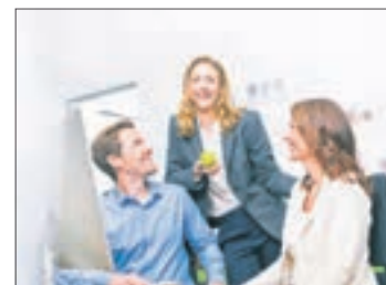
Gesundheitsberater ist eine Beruf, der Perspektiven bietet.

Gesundheit verhelfen und hier beruflich tätig werden möchten. Der Weg in dieses Berufsfeld ist denkbar einfach: In einer Weiterbildung, beispielsweise in der zum „Gesundheitsberater“ am IST-Studieninstitut (www.ist.de), erhalten Teilnehmer in 14 Monaten ein Wissensfundament, mit dem sie Klienten auf dem Weg zu einer gesünderen Lebensweise begleiten können. djd-k