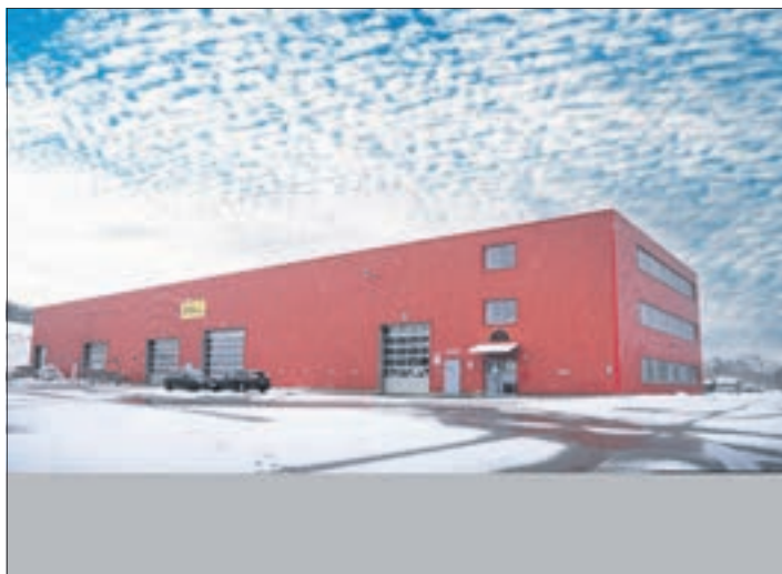
Das im Jahr 1878 gegründete Traditionsunternehmen DOLL beschäftigt heute mehr als 400 Mitarbeitende und baut über 1.000 Fahrzeuge pro Jahr, die Sparte Holztransport ist in Mildenau angesiedelt.

Mildenau. Die DOLL Fahrzeugbau GmbH konnte Ihre Wachstumsstrategie auch 2022 fortsetzen. Für 2023 strebt das Unternehmen eine Verdopplung des Umsatzvolumens an. Trotz schwieriger Rahmenbedingungen, angefangen von instabilen Lieferketten bis zu stark gestiegenen Energie- und Rohstoffkosten, konnte das Unternehmen im abgelaufenen Geschäftsjahr einen Rekord-Auftragseingang von über 200 Mio. EUR erzielen.