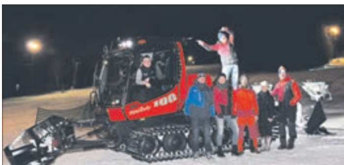
Beim WSV „Am Schießberg“ Crottendorf freut man sich über ein neues Loipenspurgerät der Firma Firma Snow Equipment Walther.

Crottendorf. Vor einigen Tagen konnte der WSV „Am Schießberg“ ein neues Loipenspurgerät in Empfang nehmen. Angeliefert wurde es von den Firmen Fuhrunternehmen Gräbner und Baugeschäft Edelhoff. Finanziert wurde die Anschaffung durch eine Förderung über die Richtlinie „GRW Infra“. Da auch das alte Gerät leichte Aufgaben übernimmt, freuen sich die Verantwortlichen des Vereins auf ein noch breiteres Wintersportangebot vor allem im Bereich der Loipen.