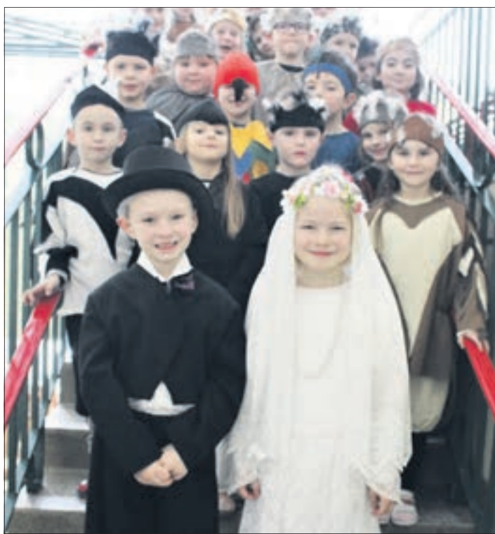
Danach luden die Größten im Kindergarten zur Aufführung „Die Vogelhochzeit“.

Eine Extra-Vorstellung gab es an diesem Tag für Eltern und Großeltern. Viel Beifall klang durch den großen Eingangsräum und glückliche Gesichter waren Dank der Anstrengung. red