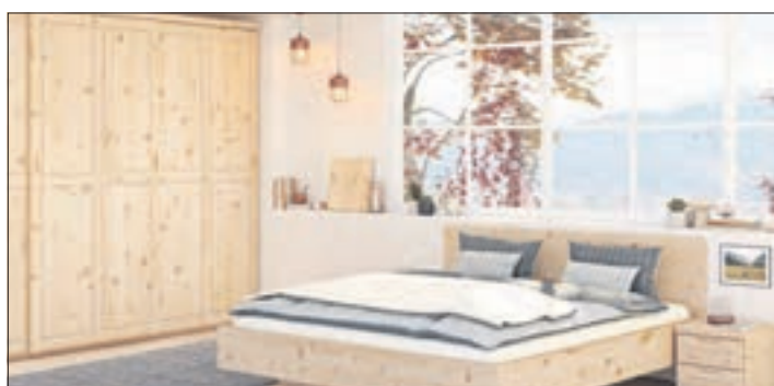
Betten und andere Schlafzimmernmöbel aus Zirbenholz sind eine Augenweide im Schlafzimmer.

Der österreichische Schlafräumanbieter LaModula etwa setzt auf eine hochwertige und dennoch preiswerte Ausstattung aus Naturholz und mit Biomaterialien, mehr Infos und einen Webshop gibt es unter www.lamodula.de im Internet. djd-k