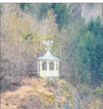
Der achteckige Aussichtspavillon Hoher Kleef thront über dem Höhlenort Rübeland.