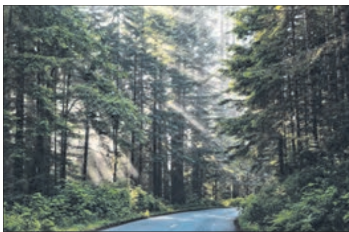
Das im Jahr 2021 in Sachsen gesammelte Altpapier rettete rund 210.000 Bäume.

Geht man davon aus, dass ein Festmeter frisch geschlagener Fichte rund 750 Kilo wiegt, ein etwa 100 Jahre alter Baum zirka 2,5 Festmeter Holz hat, rettete das Altpapier im Jahr 2021 rund 210.000 Bäume.