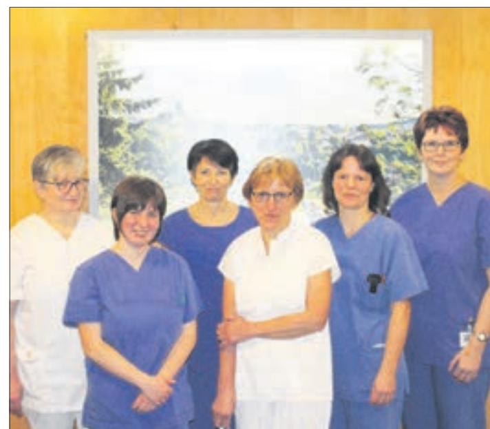
Das Team der neuen gastroenterologischen MVZ Praxis im Erzgebirgsklinikum in Annaberg-Buchholz.

Zu dem Leistungsspektrum der Praxis gehören die Diagnostik und Therapie von chronisch-entzündlichen Darmerkrankungen, weiterhin die Magenspiegelung einschließlich Probeentnahme zur histologischen Beurteilung, Schnelltest auf Helicobacter pylori-Infektion des Magens, die Endoskopische Blutstillung mittels Unterspritzung, Clips oder Gum-