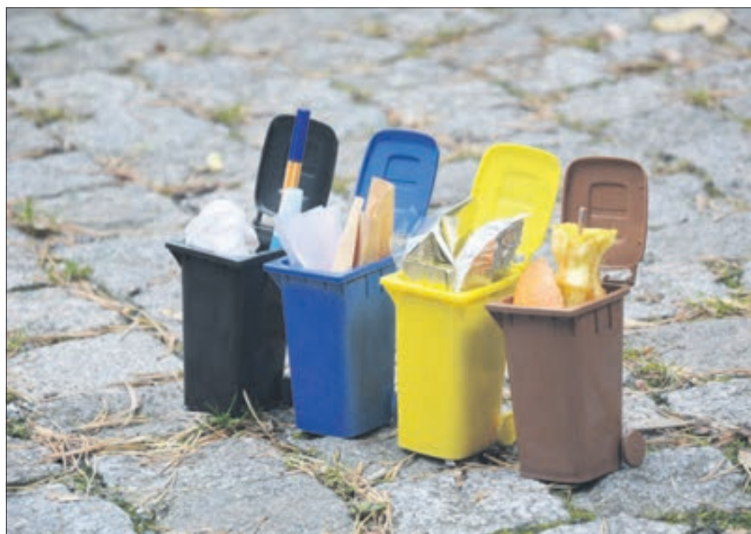
Die Sachsen trennten mit 186 Kilogramm pro Kopf mehr Wertstoffe als alle anderen Bundesbürger.