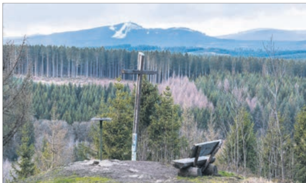
Gegenüber vom Gipfelkreuz am Kapitelsberg grüßt der Wurmberg mit seinem Skigebiet.

Der Granitfelsen Peterstein ragt über dem Zillierbachstausee empor, nahe der Staumauer zwischen den Harzorten Wernigerode und Elbingerode. Ein guter Ausgangspunkt zum Aussichtspunkt mit Picknickplatz und Stempelstelle der Wandernadel liegt am Ortsrand Elbingerode. Von dort führt der Weg über den Rastplatz „Am Hirschbrunnen“ bis zur Talsperre, wo der Peterstein mit Stempelstelle der Harzer Wandernadel ausgemaltes ist. djd/red