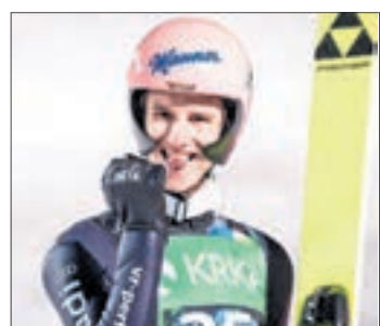
Weltklasse-Springer Karl Geiger schreibt im WochenENDSpiegel.

werden können sich sehen lassen und mit dem zweiten Sprung im zweiten Wettkampf bin ich mehr als zufrieden; gelingt es, derartige Sprünge konstanter abzurufen als in der unmittelbaren Vergangenheit, werde ich gut vorbereitet zur Weltmeisterschaft nach Slowenien anreisen. Abgerundet wurden die positiven Entwicklungen dann durch die Premiere eines neuen Wettkampfformats, des sogenannten Super-Team-Wettkampfs, den die Frauen bereits in Japan erstmalig durchgeführt hatten. Bei dem Format treten nur zwei Skispringer pro Team an und führen gegen die Konkurrenten in drei Runden ein regelrechtes Ausscheidungsspringen durch, bei dem das Teilnehmerfeld von Runde zu Runde verkleinert wird. Eine abschließende Meinung zu dieser Art von Wettbewerb habe ich mir ehrlicherweise noch nicht ganz bilden können. Ein negativer Aspekt aus Sportlersicht ist sicherlich, dass immer nur zwei Springer einer Nation an den Start gehen können. Der Ausscheidungsmodus ist an sich si-