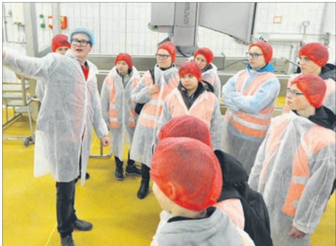
Bei Friweika können Schülerinnen und Schüler unter anderem die Kartoffelproduktion bestaunen und so tiefer in die Tätigkeiten einer Fachkraft für Lebensmitteltechnik eintauchen.

Region. Es ist wieder so weit: Die jährliche, sachsenweite Initiative zur Berufsorientierung „SCHAU REIN! – Woche der offenen Unternehmen Sachsen“ startet vom 13. bis 18. März 2023 in eine neue Runde.