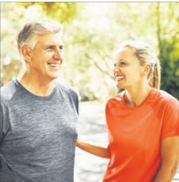
Körperlich fit, das Herz geschützt, geistig flexibel und leistungsfähig? Omega-3-Fettsäuren können einen wichtigen Beitrag dazu leisten.

Omega-3-Fettsäuren aus nachhaltigem Fischfang