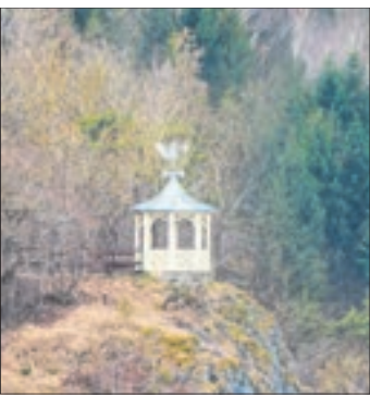
Der achteckige Aussichtspavillon Hoher Kleef thront über dem Höhlenort Rübeland.

Aussichtsreiche Foto-Hotspots im Oberharz erwandern