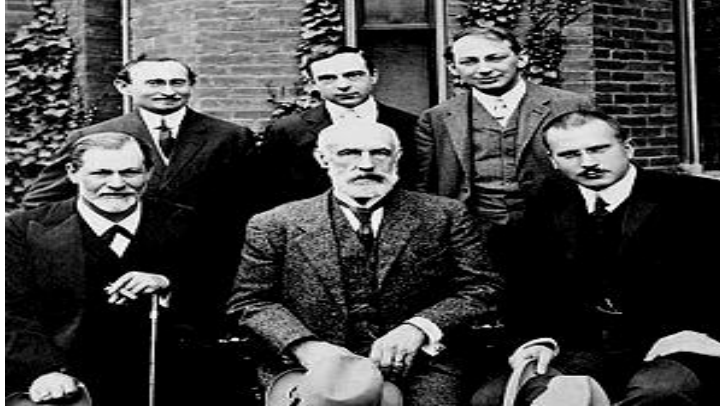
Carl Jung en el lado inferior izquierdo y Sigmund Freud al lado inferior derecho. Fuente: http://es.wikipedia.org/wiki/Carl_Gustav_Jung&imgurl , año 2012.

Los Doce Pasos son la base primordial del programa de recuperación de Alcohólicos Anónimos, en estos considera a las adicciones como síntoma de problemas más profundos en el ser humano, y producto de los defectos de carácter que cada ser humano posee. Desde una perspectiva cristiana estos defectos, representan los siete pecados capitales, los cuales se manifiestan en la carencia del control de las emociones, del adicto y a su vez son la “punta del iceberg”, que lo motivan a intoxicarse.