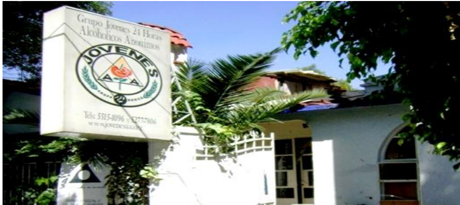
La Casa Matriz del Grupo Jóvenes 24 Horas A.A. se encuentra en la Calle de Potasio Tagle, Colonia San Miguel Chapultepec, Ciudad de México.

El Jóvenes 24 Horas A.A. fue el primer Grupo Anónimo en México, que adoptó una política de “Puertas Abiertas”; esto quiere decir que el interno tiene la opción de abandonar la Casa de Recuperación cuando él lo desee, ya que el internamiento no es forzoso y los dispositivos de control social, en palabras de Goffman son “barreras que las Instituciones totales levantan entre el interno y el externo marcan la primera mutilación del Yo” (Goffman, 1981:27). El análisis de la situación social de los internos del Grupo Jóvenes 24 Horas, tiene por objetivo describir la interacción social dentro de la comunidad y describir como el proceso de internamiento modifica el “Yo” del paciente, por medio de dispositivos de vigilancia, mecanismos de control social y de las prácticas discursivas propias del lugar y de cultura de A.A. en México, con la finalidad mantener los argumentos centrales de Erving Goffman (1981), en su análisis de las Instituciones totales, su objetivo principal no es la readaptación social de los internos, sino vigilarlos y mantener el orden social dentro de la institución.