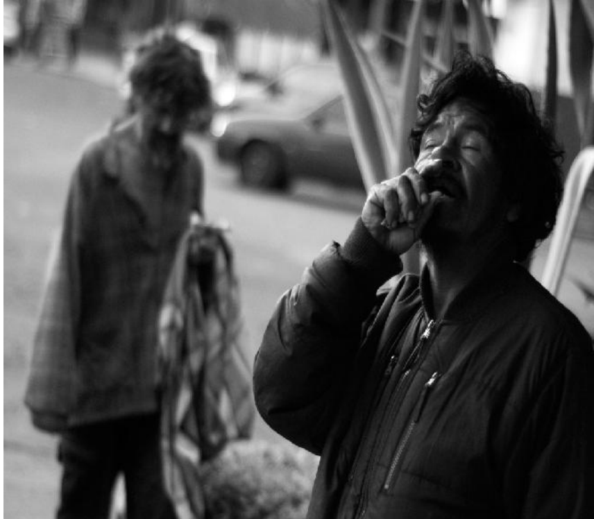
Un adicto en una calle de la Ciudad de México.