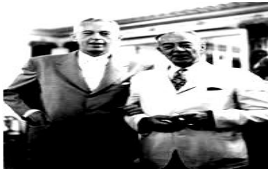
A la derecha Bill. W. y a la izquierda El Dr. Bob, cofundadores de Alcohólicos Anónimos.