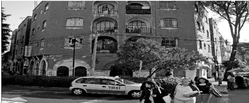
Fotografía del edificio donde se fundó el primer Grupo de Alcohólicos Anónimos en México en el año de 1935. El "México Group", ubicado en la calle de Gómez Farías N° 66, Departamento 208, Colonia del Carmen. Delegación Coyoacán. Ciudad de México.

Actualmente en México existen cerca de 15,000 agrupaciones de Alcohólicos Anónimos registradas ante la Central Mexicana de Servicios Generales de Alcohólicos Anónimos. Vamos a hacer un recorrido histórico de la cultura de A.A. en México, para poder comprender como se dio el proceso de institucionalización de esta organización en el contexto mexicano, así como los