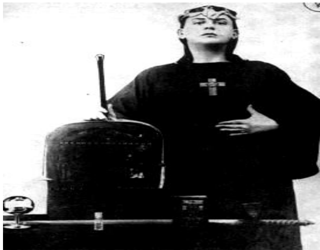
Alexander Crowley conocido como Aleister. Él se hacía llamar “La Bestia 666”, y fue el autor del Diario de un Drogadicto.

Otro caso en que se expone el consumo de las drogas como parte un discurso contestario a los valores establecidos de la sociedad, es el de Las Cabra Girls en la década de los años noventas. Un grupo de mujeres jóvenes que vagaban por las calles del suburbio australiano de Cabramatia, (de ahí que se les haya bautizado con el nombre de Cabra Girls), que se involucraban con hombres de otras bandas y participaban en diversos crímenes, tras comenzar a consumir heroína y necesitar dinero para abastecerse de la droga, empezaron a venderla y a competir entre sí por el mercado de los consumidores la sustancia, sus antiguas amistades se convirtieron en sus enemigos, las dejaron aisladas y vulnerables. Después unas de ellas fueron encarceladas por delitos contra la salud, otras murieron por sobredosis y las pocas que sobrevivieron, poco a poco, se ganaron el desprecio y el odio de la comunidad de vendedores de heroína.