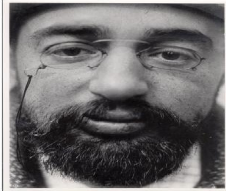
Fotografía del famoso pintor impresionista Henry de Toulouse Lautrec, quien padeció alcoholismo y murió a una edad muy temprana. En la cúspide de su carrera artística.

Otro caso digno de mencionarse corresponde al poeta Inglés Alexander Crowley, adicto a la heroína e hijo de un prominente hombre activo miembro de la Comunidad de Plymouth, una congregación religiosa de corte cristiana. Un día Crowley escribió una frase: “No sabréis lo que es un beso, hasta que no tengáis la boca llena de cocaína” (Crowley citado en Burgo, 2005:222). El fue el autor del “Diario de un drogadicto”, y narra en esta novela el estilo de vida desenfrenada de un grupo de inadaptados que estimulan su vida con el consumo de cocaína y heroína. Escribió más de una veintena de obras literarias de las que destacan poemas, novelas y cuentos cortos. Crowley tenía a su disposición un séquito de fieles devotos hombres y mujeres, que lo asistían y muchas veces financiaban sus orgías donde también participaba su hijo. Se llamaba así mismo “La Gran Bestia 666”, veneraba al Dios Ra y realizaba ritos en su honor, era un fiel intérprete del pentagrama y en sus celebres rituales cometía sacrificios humanos. Vivió 72 años, de los cuales 40 los dedicó a la práctica de la magia negra.