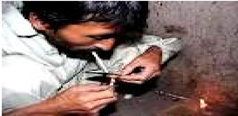
Un adicto fumando cristal. Fuente: http://eresundrogadicto.blogia.com , año 2012.

Desde el punto de vista ideológico no es aceptado que todas las personas tengan los mismos derechos y deberes. Desde una visión Darwinista-Hobbesiana de lo social, para ser merecedor de estos derechos es necesario asumir responsabilidades, de las cuales los que son adictos han sido excluidos o se han auto excluido, el hecho de tener problemas de adicción a cualquier tipo de sustancia; sitúa a la persona en una posición de inferioridad frente a las