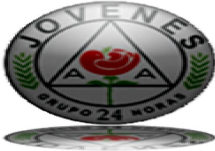
Imagen N° 11.

Logotipo del Grupo Jóvenes 24 Horas A.A. Fuente: http://www.jovenesaa.org.mx , año 2012.