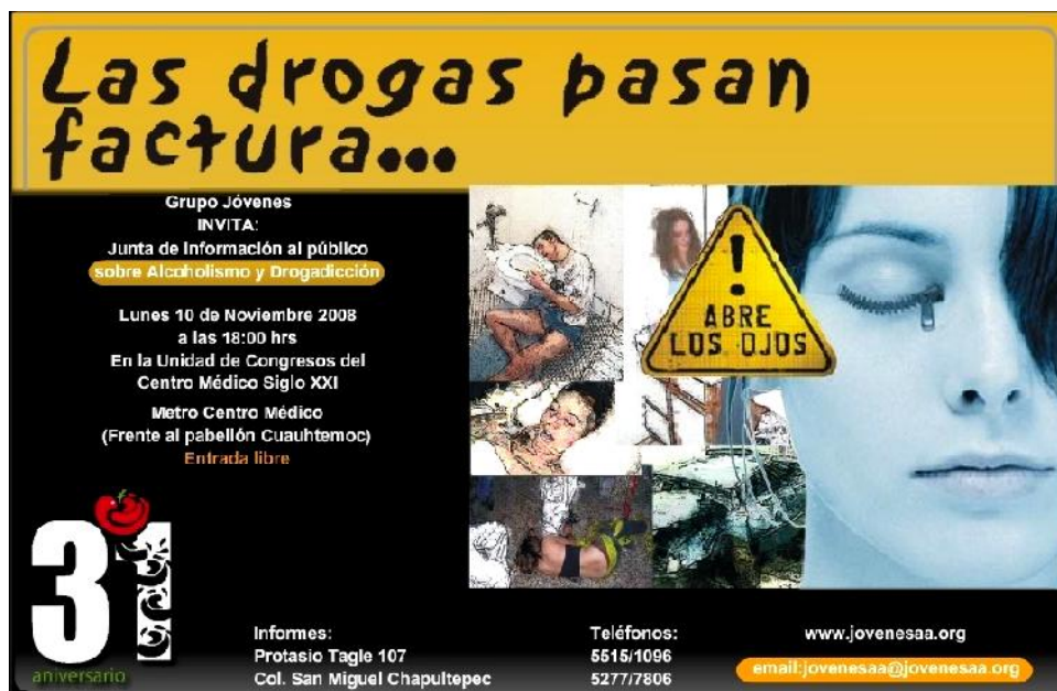
Propaganda del Grupo Jóvenes 24 Horas A.A.

La imagen que presentamos corresponde a la publicidad referente al festejo del 31 aniversario del Jóvenes 24 Horas A.A., mismo que se celebró en las instalaciones del grupo. Meses antes del evento se realizaron juntas de información pública en diferentes puntos del D.F. como el Centro Médico Siglo XXI. Además se invitaron a participar a otros Grupos de la Corriente Jóvenes para compartir sus experiencias en las instalaciones de la Casa Matriz del Jóvenes 24 Horas A.A., con el objetivo de mantener la unidad de este movimiento.