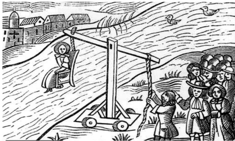
Dibujo del método de la silla de zambullición, que se utilizaba en Inglaterra durante el siglo XII, para curar al alcohólico. Este era atado de pies y manos, y sumergido en las orillas del Tamesis.

En Francia, durante el reinado de Francisco I, el método para más común para “curar” al alcohólico, consistía en el azote con varas varias veces. Seguido de su ingreso a la prisión, en las mazmorras, sin alimentarlo durante muchos días. Si el alcohólico reincidía entonces se le cortaba una oreja y finalmente era desterrado de la sociedad.