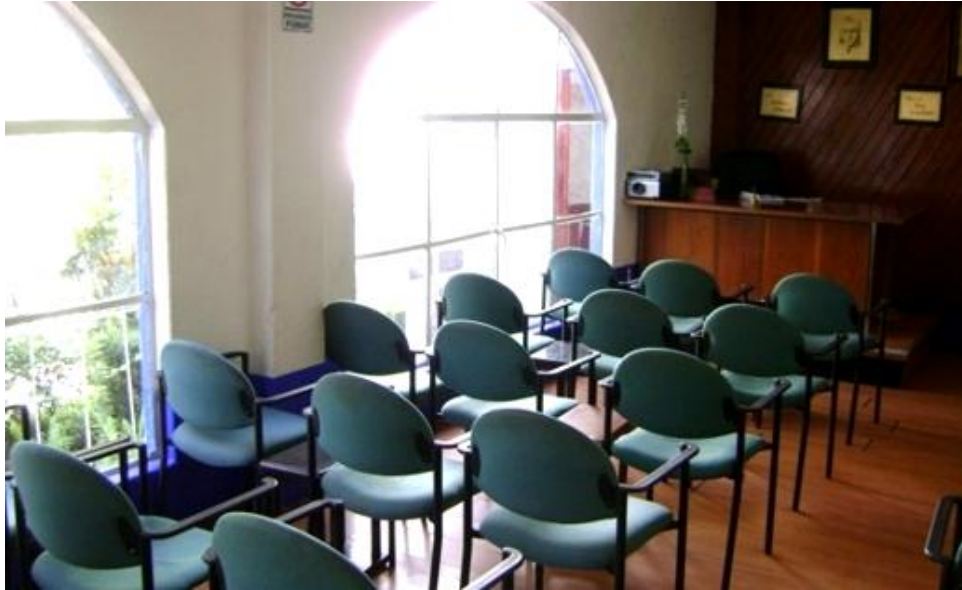
Imagen No. 14.

La sala de juntas “A”, del Grupo Jóvenes A.A. 24 Horas. En este lugar se realizan las Juntas de Pre-apoyo a las 6:00 a.m. y únicamente los internos que pertenecen al Grupo de Apoyo pueden participar.