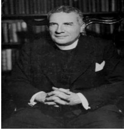
El Reverendo Samuel Shoemaker principal fundador del Movimiento Oxford.

El Movimiento Washingtoniano surgió en Baltimore hacia el año de 1840; en palabras de Haydeé Rosovsky, por “ borrachos reformados ” (Rosovsky 2009:5), sus integrantes realizaban sesiones en las que podían participar personas no alcohólicas con la promesa de abstenerse de beber alcohol, este Movimiento presentaba un gran número de similitudes con Alcohólicos Anónimos, como por ejemplo, mantenían la creencia de que el consumo incontrolado del alcohol o de otras drogas, era un signo de la ausencia de Dios, y una de las causas de la desgracia personal y social. Además contaba con sus propias publicaciones. Alcohólicos Anónimos también haría lo mismo años más tarde.