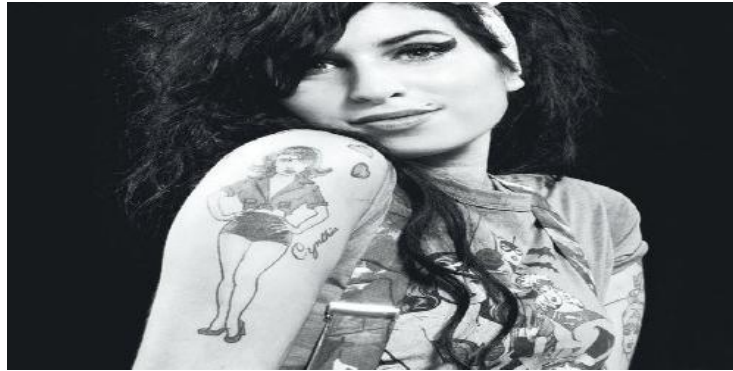
La cantante Amy Winehouse. Fuente: http://blogs.periodistadigital.com , año 2012.

. En las siguientes paginas, nos dedicamos a discutir los diversos tratamientos y opciones de rehabilitación para los adictos. A lo largo de la historia de la humanidad, con la intención de comprender como la sociedad a interpretado las adicciones.