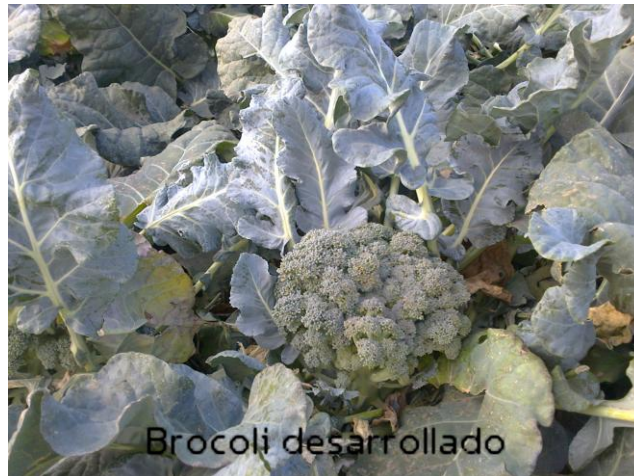
Figura 17 Diferenciación de brotes florales

Fuente: Archivo personal, fotografía tomada en San Miguel de Allende, Guanajuato, Méx., en junio de 2012.