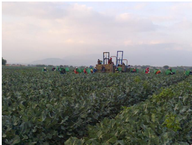
Figura 9. Recolección manual apoyados de tractores con bastidores.

En brocoli, las inflorescencias deben recolectarse en su momento óptimo, evitando recolectarlas excesivamente pronto, por lo general, para exportación se recolectan de 5" a 7". En caso de recolectarse antes, el productor se verá afectado en el peso de la inflorescencia y por lo tanto menor rendimiento por hectárea, así como recolectar inflorescencias excesivamente pesadas, que puedan tener las flores abiertas y tener menor aguante tras la recolección.