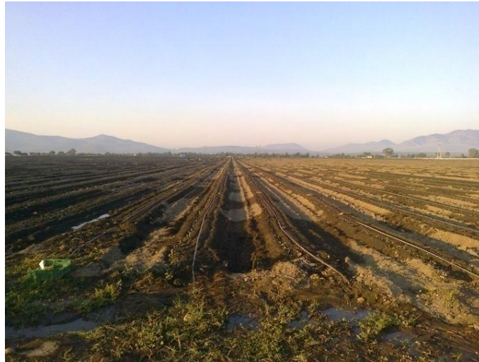
Figura 2. Camas elevadas.