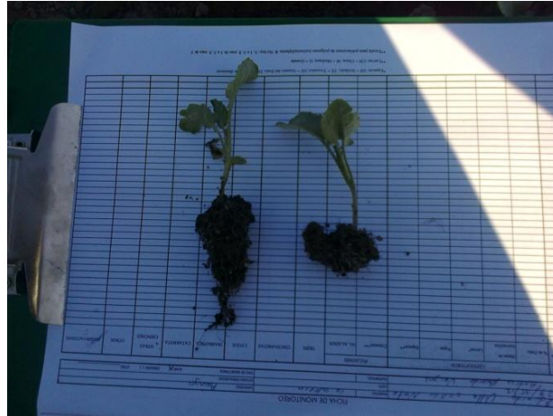
Figura 6. Diferencia entre un cepellon introducido adecuadamente y uno doblado

cultivo y esto ocasiona que la plántula con un mayor vigor se desarrolle de manera adecuada, obstruyendo así el paso de la luz a la planta menos desarrollada (figura 7).