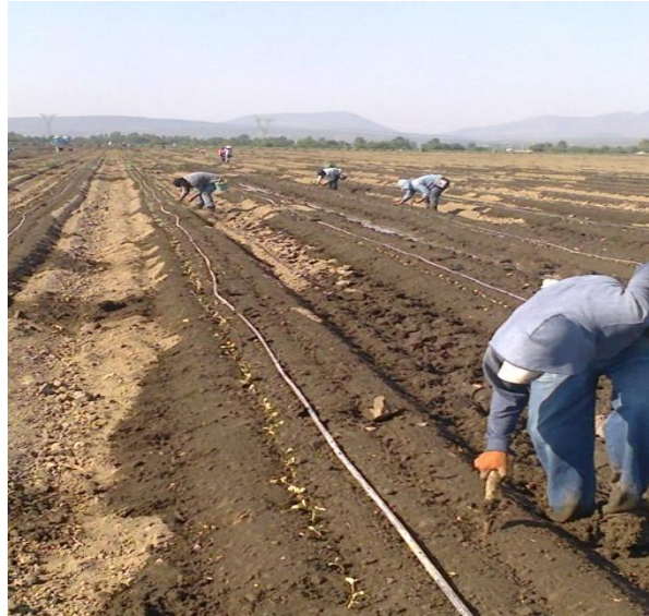
Figura 4. Densidad de población.