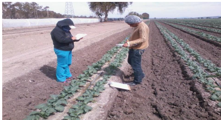
Figura 8. Monitoreo.

De acuerdo a la experiencia aprendida en el periodo de estancia los monitoreos deben de iniciarse 15 días después del trasplante, después de esto por lo menos uno por semana, para tener un buen control y no dejar una ventana para la entrada de plagas que puedan ocasionar daños de manera considerable en el cultivo (figura 8).