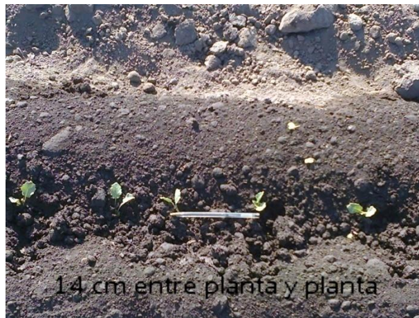
Figura 5. Distancia entre plantas.

Fuente: Archivo personal, fotografía tomada en San Miguel de Allende, Guanajuato, Méx., 2012