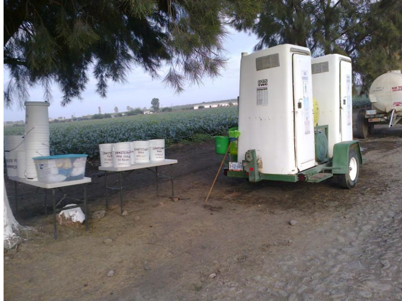
Figura 10. Material para saneamiento

Por otra parte, se debe evitar la recolección de la inflorescencia en momentos de altas temperaturas. Para la recolección se debe tener un buen saneamiento del material a utilizar para evitar la contaminación del producto (figura 10).