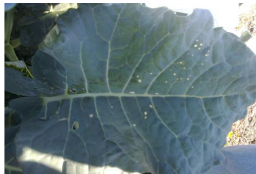
Figura 16 daño tipo tiro de munición.