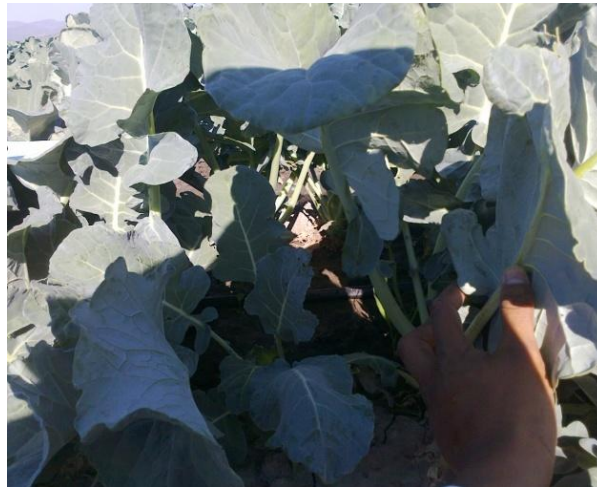
Figura 7. Obstruccion de plantas vigorosas

Fuente: Archivo personal, fotografía tomada en San Miguel de Allende, Guanajuato, Méx., 2012.