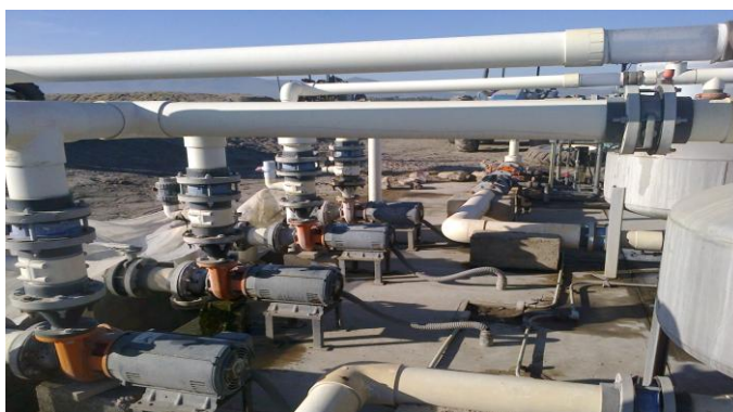
Figura 13. Sistema de bombeo.

Fuente: Archivo personal, fotografía tomada en San Miguel de Allende, Guanajuato, Méx., 2012.