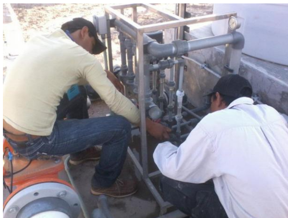
Figura 12. Sistemas de inyección.