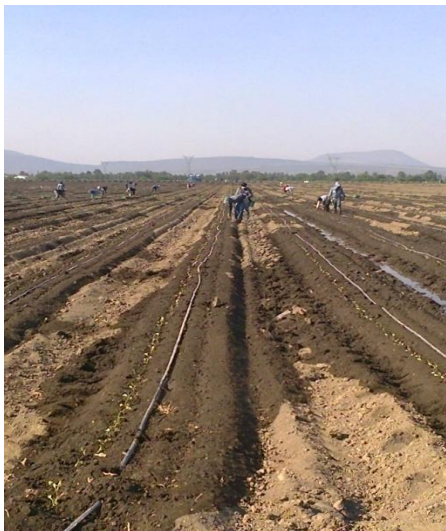
Figura 3. Riego abundante

Fuente: Archivo personal, fotografía tomada en San Miguel de Allende, Guanajuato, Méx., durante la U. A. Estancia, 2012.