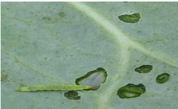
Figura 15 Perforación de hojas

Los huevecillos son de forma oval, de color amarillo y miden aproximadamente 0.5 mm; son ovopositados de forma individual o en pequeños grupos de dos o tres en el envés de las hojas. Anaya S. (1999) afirma que la larva perfora las hojas al alimentarse (figura 15 ), dejándolas como tiro de munición (figura 16) también barrena las cabezas de brócoli, causando daños de contaminación por excremento y secreciones sedosas que afectan al aspecto del producto así disminuyendo el valor comercial.