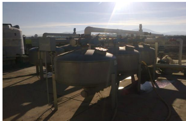
Figura 11. sistemas de filtración.

El sistema de riego por goteo consiste de un sistema de filtración (figura 11); sistema de inyección de plaguicidas y fertilizantes (figura 12); sistema de protección, sistema de bombeo (figura 13), válvulas y medidores de presión, conducción primaria, conducción secundaria y cintilla de goteo (figura 14).