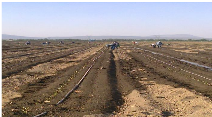
Figura 14. Conducción secundaria y cintilla.

Fuente: Archivo personal, fotografía tomada en San Miguel de Allende, Guanajuato, Méx., 2012.