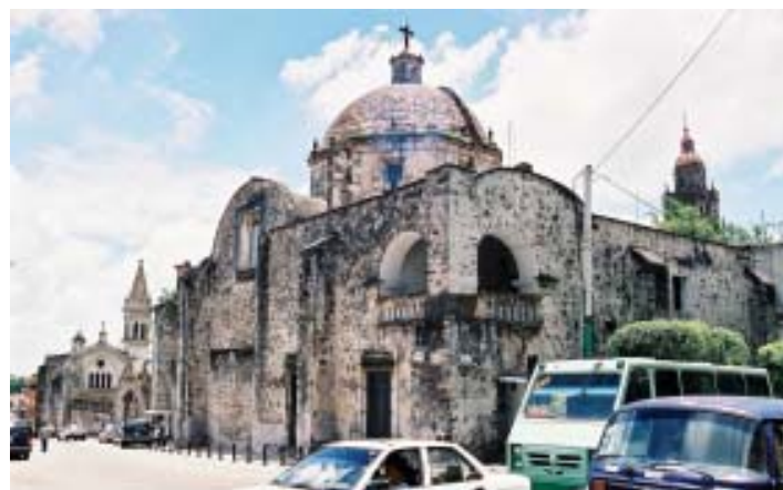
Catedral de Cuernavaca.

Consta de cinco partes. En la primera se refiere a los antecedentes sobre el problema, particularmente los referidos a los planteamientos sobre globalización y metropolización, y, para la MM, una breve presentación de algunos planteamientos al respecto; el segundo, trata sobre el proceso de reestructuración económica de la MM de los ochenta a la fecha; el tercero, vincula dicho proceso con su referente territorial que privilegia el análisis según ejes sobre el de contornos sucesivos; en el