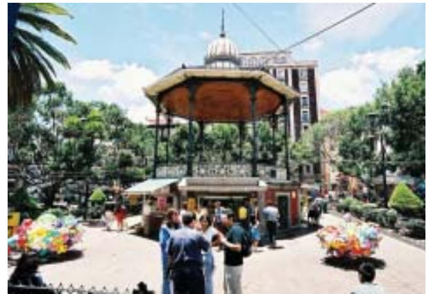
Típico espacio público de gran uso urbano.

El proceso de globalización puede ser caracterizado de distintas maneras 8 , y, frecuentemente se aplican como sus sinónimos los de “mundialización” e “internacionalización” 9 . En sus términos más generales entiendo como globalización al proceso social -en su sentido amplio- que relativiza las distancias a escala mundial y simultaneiza los tiempos. Este proceso es complejo, contradictorio y adquiere formas desiguales, porque abarca al conjunto de las actividades sociales, combina procesos históricos diferentes y enfrenta/coopera acciones de los agentes sociales con capacidades y proyectos diversos 10 . Y, para el caso particular de este