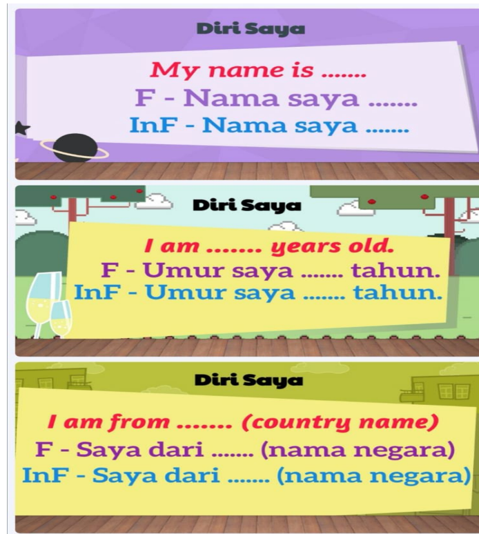
Gambar 1 Contoh Ayat Memperkenalkan Diri

Grafik yang menarik juga menjadi sebahagian daripada elemen yang penting dalam pengajaran bahasa Melayu kepada pelajar antarabangsa. Menurut Abdul Rasid Jamian & Hasmah Ismail (2016), suasana pembelajaran yang menyeronokkan menimbulkan suasana yang positif dan seronok di samping merangsang pencapaian pelajar. Suasana ini berjaya dibentuk apabila kursus ini dibatikan dengan tenaga pengajar yang kreatif. Berdasarkan paparan power point yang digunakan ini juga, pelajar telah didedahkan tentang dua bentuk bahasa Melayu yang wujud di Malaysia iaitu bahasa formal dan tidak formal. Pengajaran ini sangat penting kepada pelajar kerana mereka akan berhadapan dan berkomunikasi dengan orang tempatan di luar bilik kuliah. Bentuk bahasa yang digunakan semasa berinteraksi dengan orang tempatan adalah berbeza dengan bahasa Melayu yang mereka pelajari secara formal di dalam bilik kuliah. Maka, sedikit sebanyak topik ini dapat membantu pelajar untuk memahami sedikit sebanyak bahasa Melayu tidak formal yang dituturkan oleh orang tempatan.