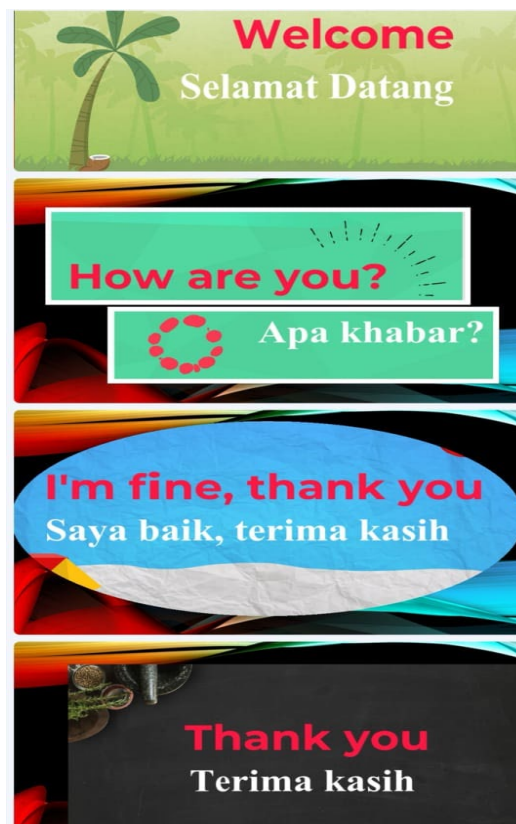
Rajah 2 Contoh ayat tegur sapa

Topik ini didapati sangat diminati oleh para pelajar kerana mereka boleh mengguna pakai kemahiran yang diperolehi dalam kursus ini dalam komunikasi seharian. Kemahiran komunikasi sangat diperlukan pelajar antarabangsa apabila berinteraksi dengan pelajar tempatan, pensyarah, pegawai pejabat atau masyarakat tempatan sepanjang mereka berada di negara ini. Ucapan yang paling mudah diingati pelajar ialah ‘terima kasih’, ‘apa khabar’ dan ‘sama-sama’. Walaupun wujudnya sedikit masalah dari segi sebutan khususnya melibatkan pelajar-pelajar dari negara China, namun begitu ia bukanlah menjadi masalah besar kerana apa yang penting ialah kefahaman pelajar dalam mengujarkan ucapan tegur sapa tersebut. Melalui latihan sebutan secara lebih kerap, pelajar akhirnya akan mampu menguasai kemahiran lisan tersebut.