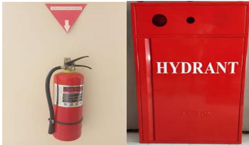
Gambar 1. APAR dan Hydrant

digunakan untuk mengantisipasi bencana kebakaran, seperti fire hydrant , fire detector , APAR , fire alarm yang diletakkan pada setiap lantai perpustakaan.