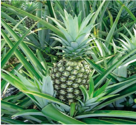
Frutos primera cosecha