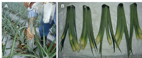
Figura 2. A. Muestreo de la hoja *D*. B. Hojas dobladas y listas para ser colocadas dentro de bolsas de papel y enviadas al laboratorio.

porque refleja con aceptable seguridad el contenido de nutrientes de la planta, como técnica para ajustar el plan de fertilización. Las labores de segunda cosecha se inician con la colecta de 10 hojas *D* de la parcela (ver figura 2A), unos 8 días antes de la inducción floral. El reconocimiento se hace juntando las puntas de las hojas en la parte superior de la planta y la hoja más larga será la hoja *D*. Las hojas recolectadas y rotuladas (ver figura 2B) serán enviadas al laboratorio para realizar análisis nutricional, y los resultados se utilizan para ajustar el plan de fertilización para la segunda cosecha.