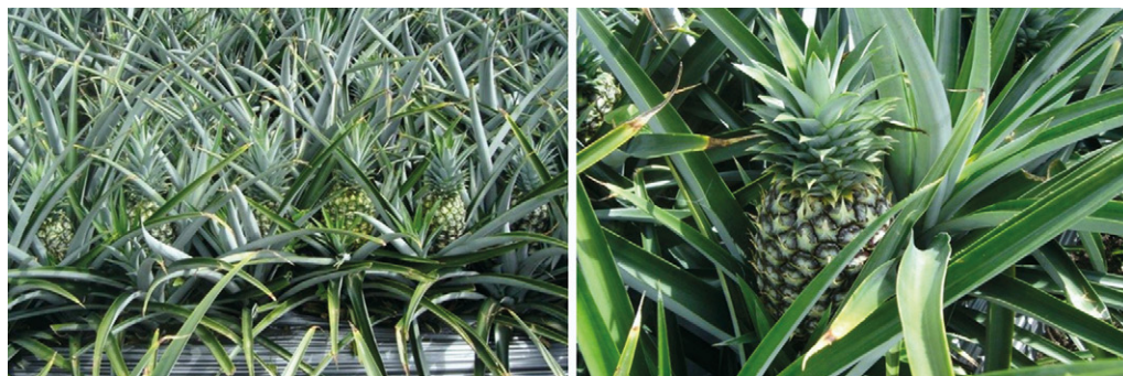
Figura 12. Frutos de piña MD2 provenientes de segunda cosecha en proceso de maduración