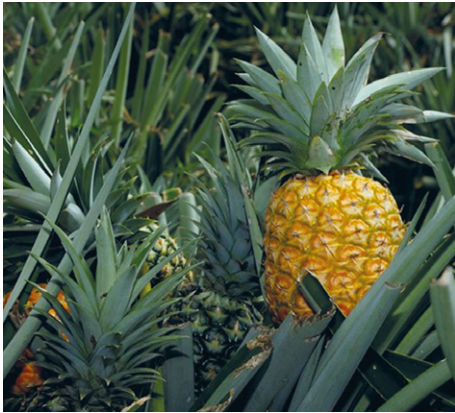
Frutos segunda cosecha