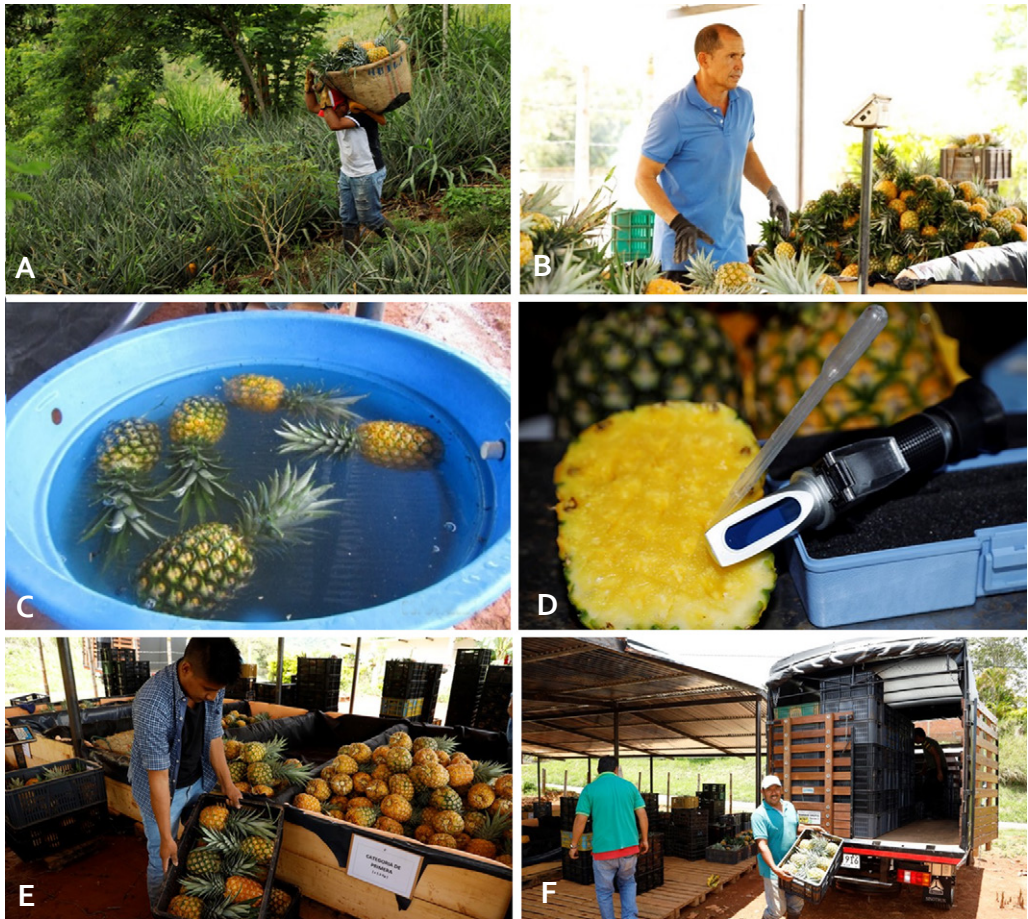
Figura 13. Protocolo de cosecha de la piña MD2. A. Recolección. B. Recepción. C. Prueba de traslucidez. D. Medición de grados Brix. E. Clasificación y embalaje. F. Transporte