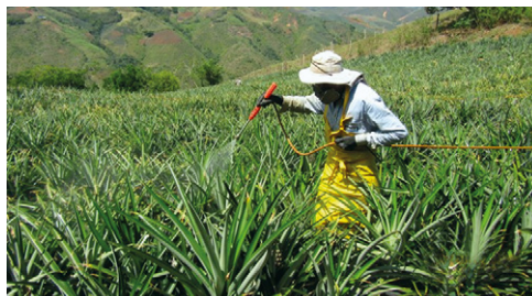
Figura 4. Inducción floral en piña MD2. La solución se aplica en la mañana o en la tarde y debe ser dirigida al cogollo

La función del inductor de floración es reducir el ciclo del cultivo, es decir, uniformizar la cosecha, lo que permite programar la producción de acuerdo con las exigencias del mercado. Este proceso se realiza con la mezcla de 150 cc de Ethrel, 4 kg de urea y 80 g de bórax en una caneca de 200 l de agua, a una dosis de 50 ml/planta dirigidos al cogollo. La solución se aplica en la mañana o en la tarde (ver figura 4) debido a que requiere baja luminosidad y temperatura. La floración se presentará 45 a 50 días después de la aplicación.