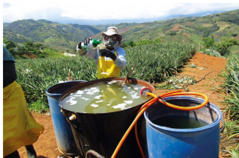
Figura 11. Fertilización foliar en piña MD2. Se muestra la preparación de la solución y la cantidad por aplicar

das se tienen urea o nitrato de amonio, cloruro de potasio (KCl), sulfato de magnesio ( MgSO_4 ), sulfato de potasio ( K_2SO_4 ), sulfato de zinc ( ZnSO_4 ), sulfato de hierro ( FeSO_4 ), bórax y ácido cítrico, cuyas dosis también se ajustarán según las etapas fisiológicas de la planta.