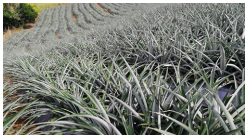
Figura 1. Plantación de piña MD2 seleccionada para segunda cosecha. Se observa el excelente manejo sanitario y el buen desarrollo de las plantas

y el análisis nutricional de la hoja *D*. El excelente manejo sanitario y peso promedio estimado por fruto de 1,5 kg durante la primera cosecha son criterios de selección que garantizan un rendimiento mínimo esperado de 90 t/ha para adelantar una segunda cosecha.