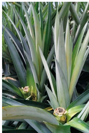
Figura 10. Colinos axilares de la piña MD2 seleccionados para segunda cosecha