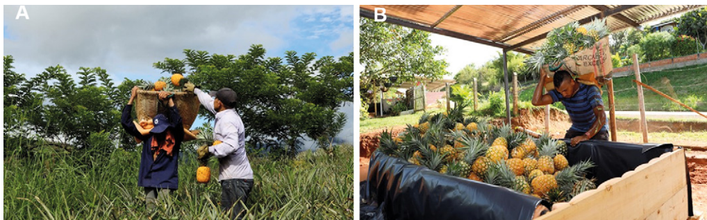
Figura 6. A. Labor de cosecha. B. Transporte de los frutos cosechados al centro de acopio.