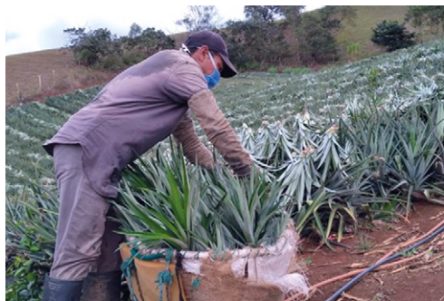
Figura 9. Recolección de colinos basales y axilares seleccionados para nuevas siembras

Luego de 60 días de la recolección de los frutos de la primera cosecha, se recuperan 1 o 2 colinos axilares o basales que se utilizarán en las nuevas siembras. Los colinos seleccionados que se recuperan, se ponen sobre la planta madre con la base expuesta al Sol (ver figura 9) para su cicatrización y para evitar daño por Phytophthora .