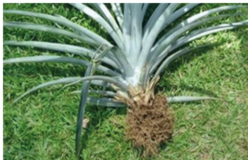
Figura 3. Planta representativa del muestreo por peso de 2,3 kg para realizar la inducción floral. Nótese que el sistema radical está completo y solo se le ha retirado el suelo

La actividad se realiza entre 7 y 8 meses después de establecido el cultivo, fecha que coincide con la última fertilización foliar. Del lote, con la ayuda de un palín, se extraen 10 plantas con su sistema radical (ver figura 3) y se retira el suelo con la mano sin aplicar agua. Luego, se pesan teniendo como referencia 2 a 2,3 kg/planta para realizar la inducción floral.