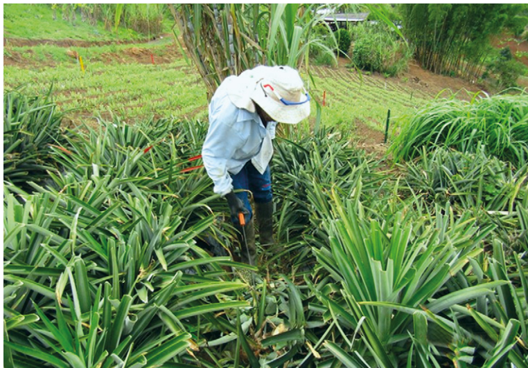
Figura 8. Segunda poda foliar caracterizada por corte de la parte superior de las hojas