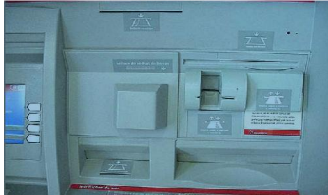
Imagen 1.1 cajero automático

En la imagen 1.2 se puede apreciar una de las cavidades indebidas que se pueden colocar al cajero y que contiene un lector de tarjeta adicional para copiar la información de su tarjeta y duplicarla.