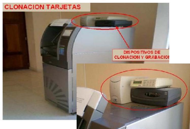
Imagen 1.7 Clonación de tarjetas

En la imagen 1.7 se muestran los dispositivos que se utilizan para la clonación de tarjetas.