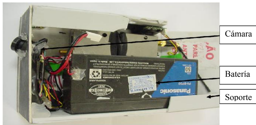
Imagen 1.6 Caja dispensadora de folletos

En esta imagen (1.6) se muestran los componentes de las cámaras utilizadas para la transmisión de datos con el fin de interpretar lo fácil que es colocarla en espacios reducidos.