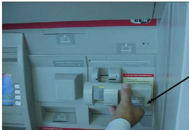
Imagen 1.2 Ranura adicional

En la imagen 1.3 se aprecia un monitor y dispensador de folletos, el cual, para cualquier cliente puede parecer normal, el objetivo de presentar esta fotografía es resaltar el riesgo que puede existir en un lugar en condiciones normales.