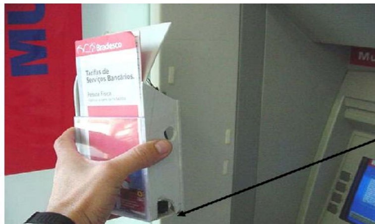
Imagen 1.4 Micro Cámara escondida

La micro cámara colocada en algún punto estratégico del cajero automático (imagen 1.5) puede ver el teclado y también el monitor para enviar una foto inalámbrica a una distancia hasta 20 metros. Esto para fines ilícitos.