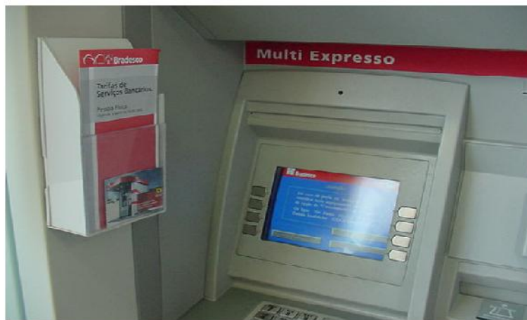
Imagen 1.3 monitor y dispensador de folletos

En esta toma (imagen 1.4) se puede apreciar una cámara de fotografía y video escondida en un contenedor.