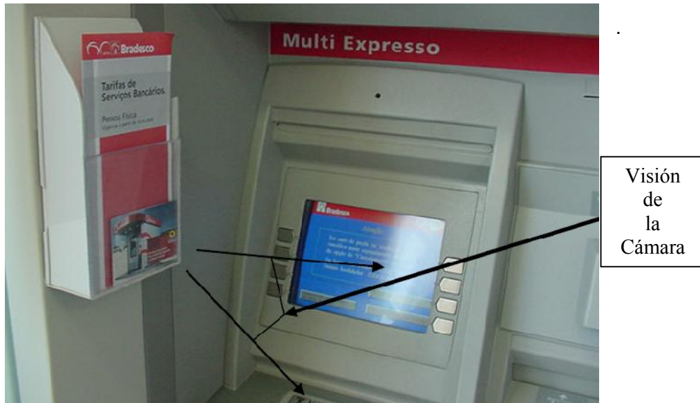
Imagen 1.5 La micro cámara

En esta imagen (1.6) se muestran los componentes de las cámaras utilizadas para la transmisión de datos con el fin de interpretar lo fácil que es colocarla en espacios reducidos.