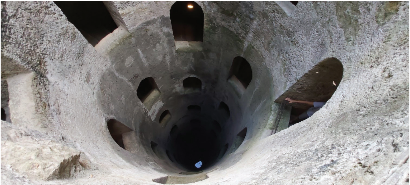
Fig. 6 - Fotografia vincitrice del 1° premio Categoria Scuole, dal titolo “Pozzo di San Patrizio (Orvieto)” (fotografia classe 1A, Scuola secondaria di primo grado Rol, S. Secondo di Pinerolo, TO).

Infine il 1° premio Categoria Scuole è andato alla classe 1ª della Scuola secondaria di primo grado Rol (S. Secondo di Pinerolo, TO) con la fotografia “Pozzo di San Patrizio (Orvieto)” (Fig. 6); il premio è consistito nell’organizzazione di una gita scolastica giornaliera per l’intera classe presso le Grotte di Bossea (CN), tenutasi il 27 ottobre (Fig. 7). Uno slideshow con le migliori fotografie inviate è stato prodotto da Stefania Da Pelo e caricato nella homepage del sito IAH Italy ( https://www.iahitaly.it/ ) e su Youtube ( https://www.youtube.com/watch?v=JxmSw9ByKpY ). Tra le attività di divulgazione e promozione