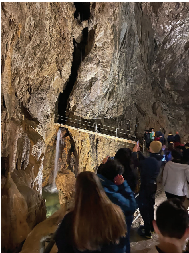
Fig. 7 - . Classe 1ª della Scuola Secondaria di primo grado Rol (S. Secondo di Pinerolo, TO) durante la gita scolastica presso le Grotte di Bossea (CN), organizzata come premio per i vincitori della Categoria Scuole al Photo Contest “ACQUE SOTTERRANEE – RENDERE VISIBILE L’INVISIBILE: L’ESPERIENZA ITALIANA”.

Fig. 6 - 1st prize winning photograph in the Schools Members' Category of the Photo contest, entitled “Pozzo di San Patrizio (Orvieto)”.