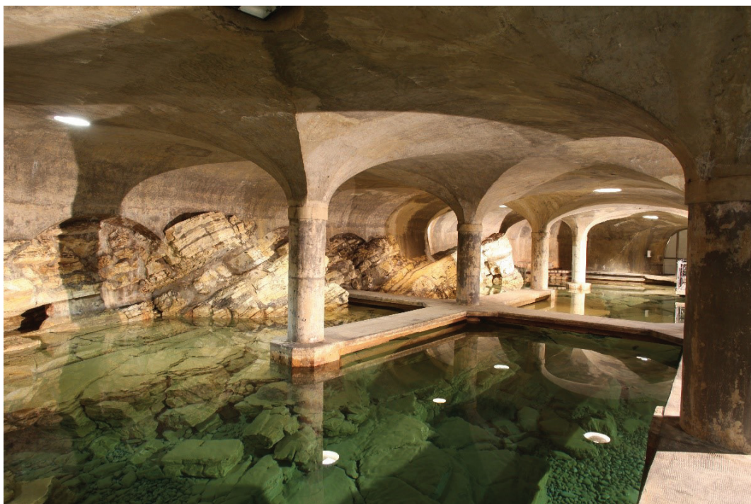
Fig. 4 - Fotografia vincitrice del 1° premio Categoria Soci IAH del Photo contest, dal titolo "Sorgente Mompiano (BS)".

Fig. 4 - 1st prize winning photograph in the IAH Members' Category of the Photo contest, entitled 'Sorgente Mompiano (BS)'.