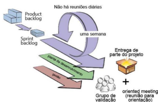
Figura 1 - Scrum Solo Diagram (Pagotto et al., 2016).

Não obstante a eleição do Scrum como modelo a seguir, foi encontrada na literatura uma adaptação deste processo para uso individual – o designado Scrum Solo (Figura 1). Segundo Pagotto et al. (2016), o product backlog e o sprint backlog mantêm-se iguais; os sprints têm a longevidade de uma semana e no final de cada iteração deve ser entregue um protótipo e sempre que necessário realizar reuniões de orientação com o grupo de validação. O processo inicia com a criação do product backlog que contém todas as tarefas necessárias para atingir o produto acordado, e por cada sprint semanal escolhem-se as tarefas que vão ser realizadas durante essa semana. Os sprints terminam assim que todas as tarefas estejam concluídas.