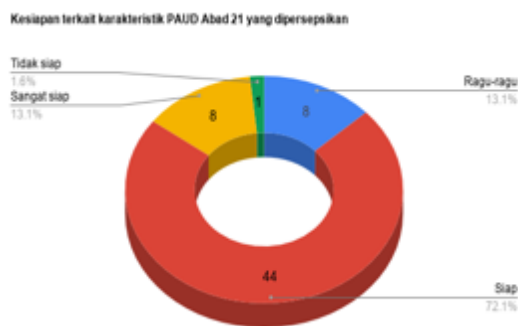
Gambar 5. Kesiapan responden

menyatakan siap menjadi guru PAUD-21, bahkan 8 orang menyatakan sangat siap, 8 orang mengaku ragu dan hanya seorang yang menyatakan tidak siap (Gambar 5). Banyaknya responden yang mengaku siap ini dapat dikatakan wajar, mengingat karakterisasi mereka tentang P-21 maupun PAUD-21 yang terkesan tidak berbeda PAUD selama ini, seperti disajikan di bagian lalu.