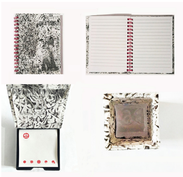
FIG. 8. Essential , diseño: Roberta Cerbone, Antonio Chianese, Francesca Cosimo, Anna Galluccio. Coordinación científica: Carla Langella.