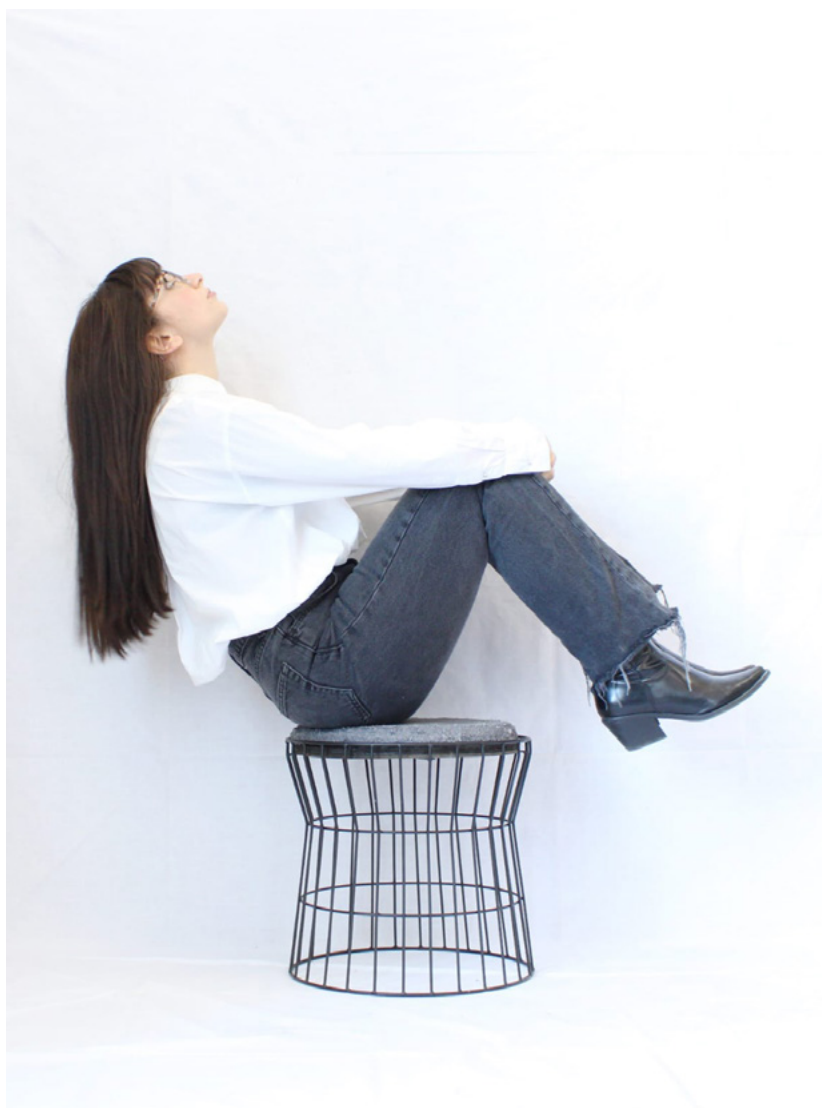
FIG 3. Violet en uso, diseñado por: Martina Del Vecchio, Francesco Gaudino, Michele Artellino, Salvatore Muzzillo. Coordinación científica: Carla Langella.