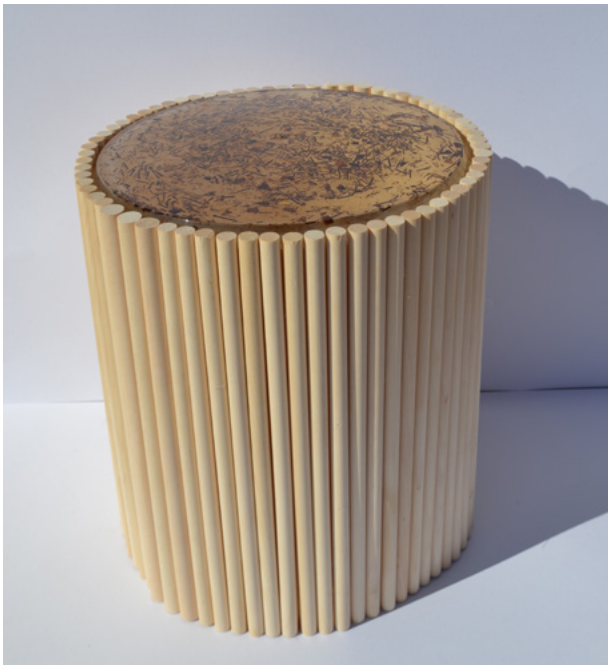
FIG 4. Ekino , diseño: Giovanna Bava, Martina Buonomo, Emmanuela Murolo, Gabriella Palomba. Coordinación científica: Carla Langella. Socio: Proyecto RICCliamo de, y coordinado por Michela Sugni, Universidad de Milán.

The same approach was used to create Ekino 4 , a sofa table for bars (figure 4), restaurants and hotels, with a shelf made of bioresin including echinoid powder and spines derived from food waste and inspired by the spine structure. The decision to leave the larger shell fragments visible was dictated by the desire to make the waste recognisable and thus the process of circularity and natural origin. Due to its conformation, the hedgehog shell appears as "pre-cut" along its hexagonal tesserae; when it breaks, it tends, therefore, to break into hexagonal modules. This characteristic, crystallised and emphasised, in the resin also confers a further didactic-evocative value that offers an opportunity to explain the structure of the shell as well as the constructive intelligence of nature hidden behind the beauty of its details (Perricone et al., 2020). The inspiration from the hedgehog's thorn further enshrines the relationship between sustainable design and nature.