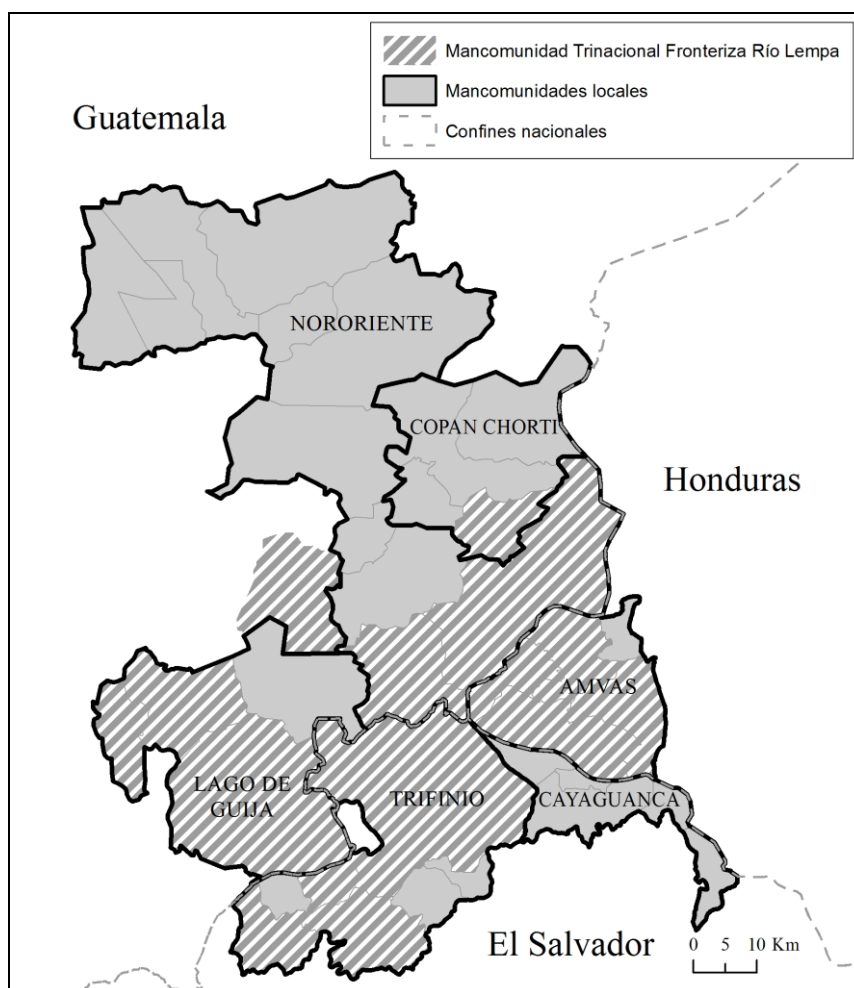
Figura 3. Las mancomunidades locales y la Mancomunidad Trinacional Fronteriza Río Lempa

municipio y otro, tomando como punto de partida una agenda común más amplia e integral que la establecida por la Comisión Trinacional del Plan Trifinio, con objetivos planteados de acuerdo al diagnóstico local y a los objetivos estratégicos” (Ibídem).