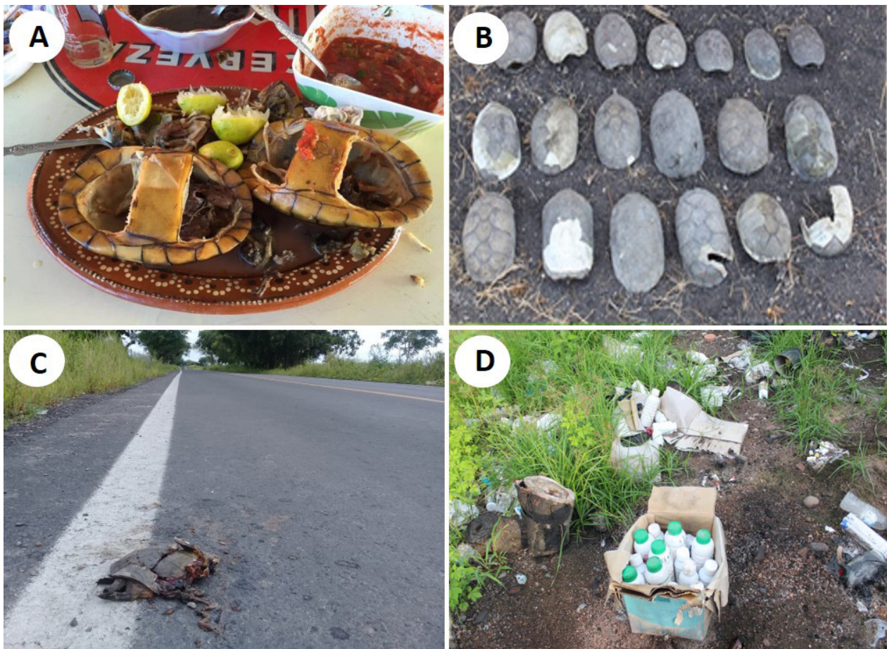
Figura 3: Factores que afectan a las poblaciones de tortugas en México, a) platillos exóticos en el estado de Veracruz, b) Individuos de la especie K. integrum registrados en la Presa la Galera, Guanajuato, c) efecto de las carreteras en las tortugas, Nayarit y, d) contaminantes abandonados a la orilla de laguna Escuinapa, Sinaloa.