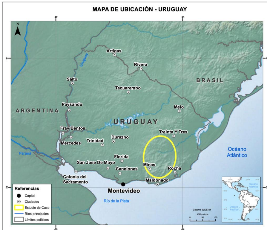
Imagen 1: Mapa de localización Uruguay

y Gestión de los Territorios con Vocación Turística ; realizado en Bogotá, D.C. los días 22, 23 y 24 de octubre de 2014. El mismo fue organizado por la Universidad Externado de Colombia; la Facultad de Administración de Empresas turísticas y hoteleras de la Universidad Externado de Colombia; el Viceministerio de Turismo del Ministerio de Comercio, Industria y Turismo; el Doctorado en Turismo de la Universidad de las Islas Baleares y el Fondo Nacional de Turismo - Fontur. A partir de dicho evento surgió la invitación para publicar la ponencia en el Anuario Turismo Y Sociedad (Universidad Externado), Vol. 15, 2014. pp. 115-134. Bogotá, Colombia. ISSN 0120-7555.