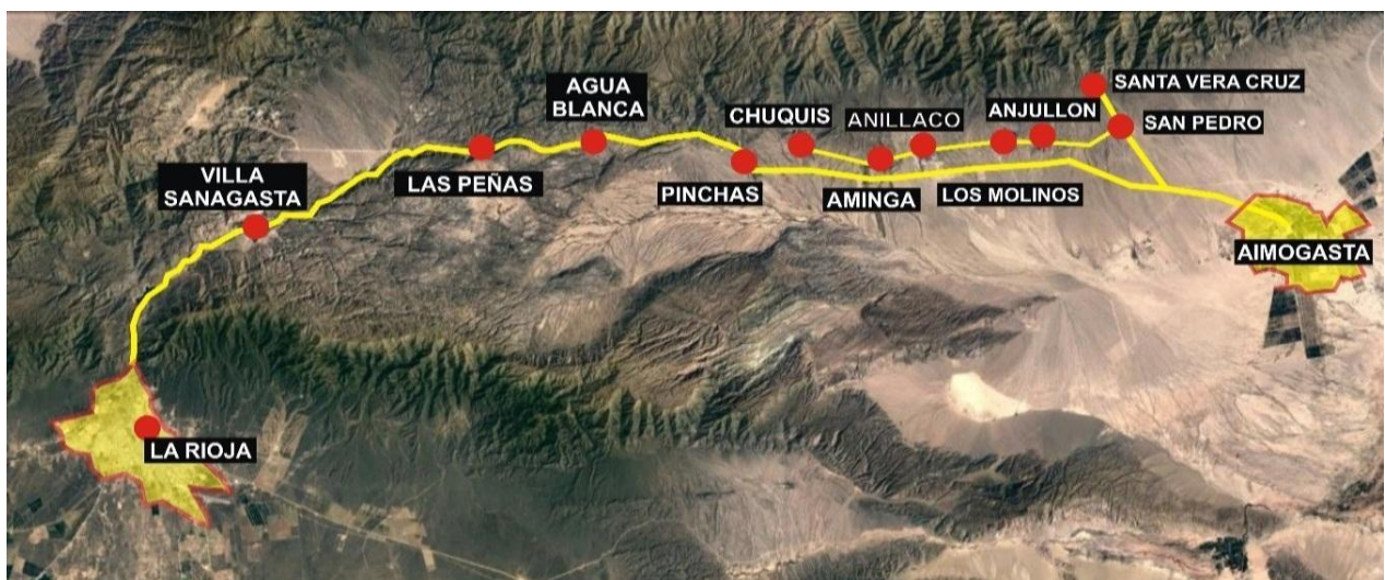
Imagen 2: ubicación geográfica de los pueblos de la Costa Riojana.

1 – Las Peñas; 2 – Agua Blanca; 3 – Pinchas; 4 – Chuquis; 5 – Aminga; 6 – Anillaco; 7 – Los Molinos; 8 – Anjullon; 9 – San Pedro; 10 – Santa Vera Cruz