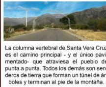
La columna vertebral de Santa Vera Cruz es el camino principal - y el único pavimentado- que atraviesa el pueblo de punta a punta. Todos los demás son senderos de tierra que forman un túnel de árboles y terminan al pie de la montaña.