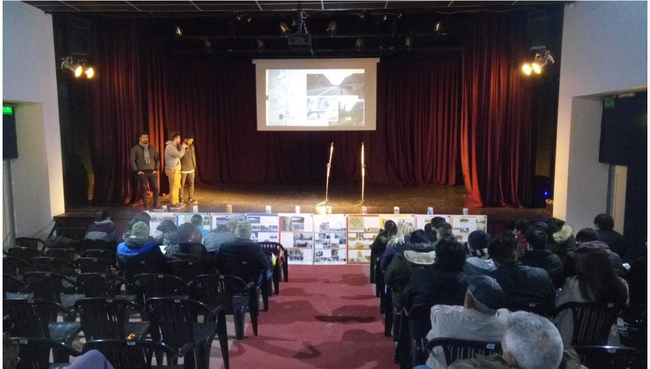
Imagen 5: presentación de paneles y exposición de los estudiantes respecto de cada pueblo.