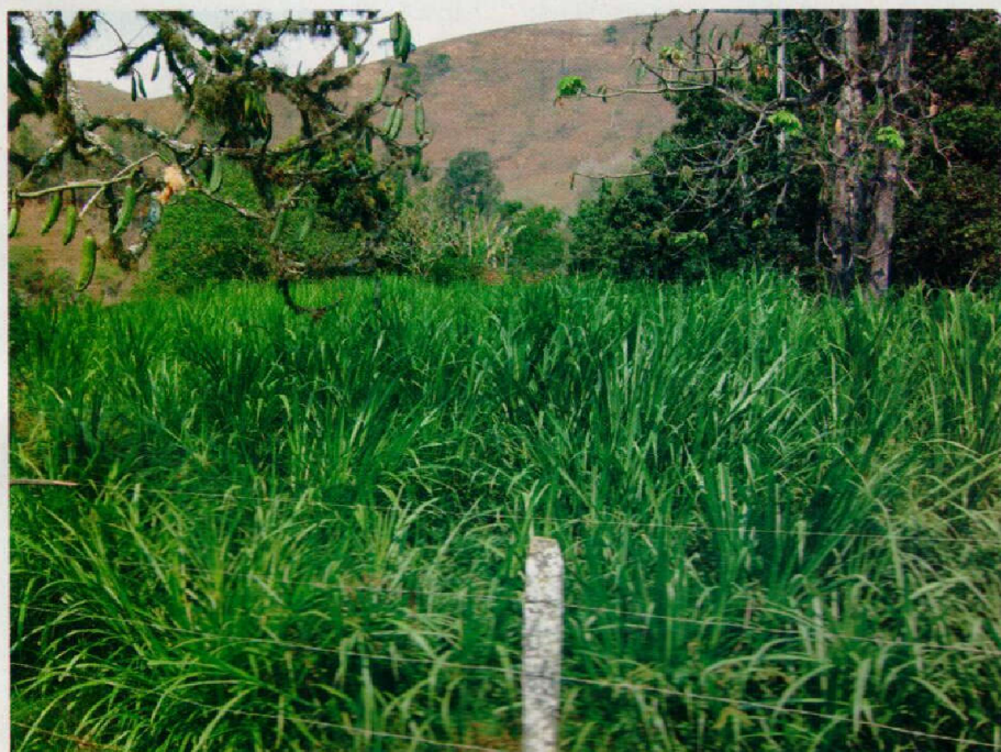
Capim napie fertilizado numa área onde não chovia há cinco meses