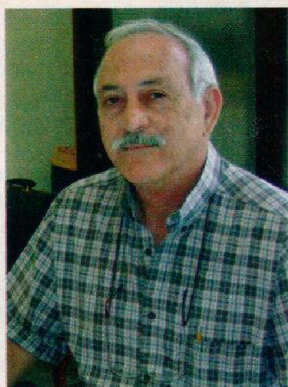
Campos: esterco tem valor

No entanto, é possível transformar os dejetos num importante aliado para a produção de leite. Através de fezes e urina, as vacas também produzem elementos necessários para a conservação do solo. O rebanho de 100 vacas citado pode ser capaz de produzir quase 2 mil kg de nitro-