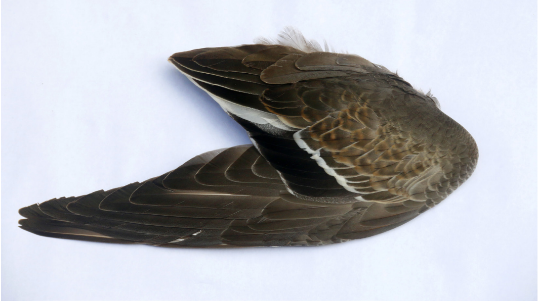
Metsästysaaliista kerätyistä siipinäytteistä voidaan määrittää saaliin ikä- ja sukupuolirakenne. Wing samples of hunter-shot ducks provide information on age and sex structure of the bag.

Aineistossamme on puuttuvia vuosia, joten työmme ei kaikilta osin ole täysin vertailukelpoinen aiempien tutkimusten kanssa. Jotta tutkimuksemme olisi mahdollisimman vertailukelpoinen aiempien töiden kanssa, käytimme samaa ilmast- ja sääaineistoa samasta mittauspisteestä kuin Christensen & Fox (2014) ja Fox ym. (2016a). Analyysissa käytetyt kesän lämpötilat ovat touko-, kesä- ja heinäkuulta Berezovon lentokentän säähavaintoasemalta (63°93' N 65°05' E; sääasema nro. 236310) ( https://en.tutempo.net/climate/ws-236310.html , ks. Christensen & Fox 2014). Yhdistettyä touko-heinäkuun pohjoisen Atlantin säiden vaihtelua kuvaavaa indeksiä ( North Atlantic Oscillation eli NAO indeksiä) käytettiin ilmentämään laaja-alaisempia ilmastollisia olosuhteita haapanan pesimäalueilla. Positiiviset kesän NAO-indeksin arvot ilmentävät keskimäärin suotuisia lisääntymisolosuhteita (lämmintä ja kuivaa eli hyvät sääolosuhteet poikasten selviytymiselle). Negatiiviset NAO-indeksin arvot ilmentävät alhaisia lämpötiloja ja sateisuutta, mikä on epäedullista erityisesti untuvikkopoikasille (Fox ym. 2016a, ks. myös Folland ym. 2009). Kesän lämpötilat Berezovon asemalta ovat käyttökelpoisia Suomen