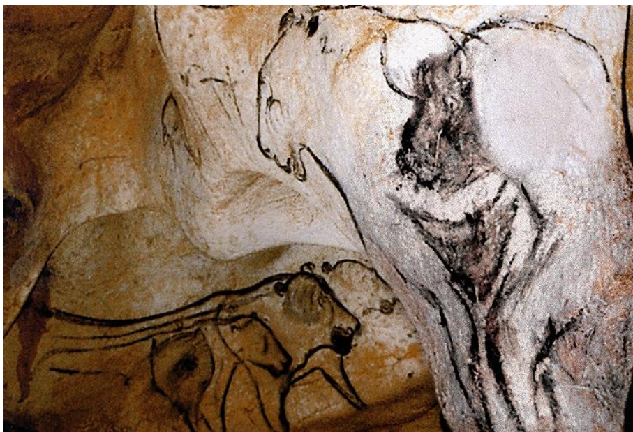
Fig. 4 – Grotta di Chauvet, dettaglio