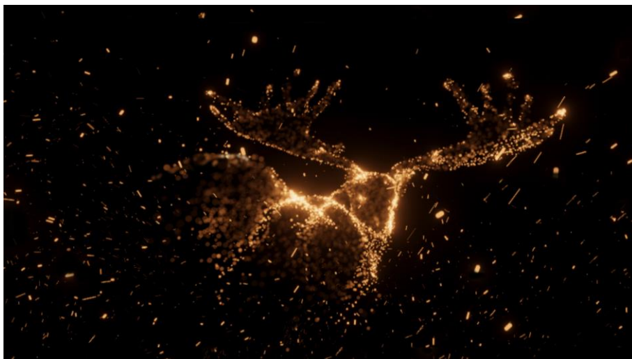
Fig. 6 – Frame dalla VR experience The Dawn of Art (Google Arts & Culture), STEAM, 2019

La VR experience su Steam dispone inoltre di una breve ricognizione virtuale del "santuario". L'ormai familiare voce narrante esorta a perlustrare la superficie istoriata, con l'ausilio dei dispositivi di Touch Controller , che inquadrano con un fascio di luce le figure. Sebbene il tour immersivo restituisca potentemente la materialità della grotta carsica, quest'ultimo di fatto non sperimenta né una regia alternativa a quella cinematografica, procedendo di fatto per tableaux figurativi, né prevede una fruizione eventualmente tattile delle pareti.