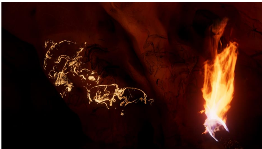
Fig. 5 – Frame dalla VR experience The Dawn of Art (Google Arts & Culture), STEAM, 2019

sapiens cacciatori-raccoglitori raccolti attorno al fuoco. Non interagiscono con noi. A questo punto, nell'esperienza Steam la voce di Daisy/Cécile, invita il fruitore a munirsi di una rudimentale torcia per farsi luce, sollecitazione effettivamente realizzata mediante l'ausilio dei dispositivi di Touch Controller . In ambedue le esperienze, l'ormai noto luccichio di faville nel cielo notturno sprigiona una teoria di visioni zoomorfe in cui l'elaborazione grafica di animali maestosi – sublimazione zodiacale della pratica archeologica del relevé (Groenen, 1999, pp. 3-23) – trasfigurati in dinamiche costellazioni, sovrasta il visitatore per poi inabissarsi nell'ombra. La soglia della grotta Chauvet, la cui archetipica condizione di isolamento parrebbe mitigata dalla tenebra che cala diffusamente sull'ambiente artificiale, prosegue quel destino non strettamente antropocentrico a cui i primi minuti di esperienza ci hanno abituato.