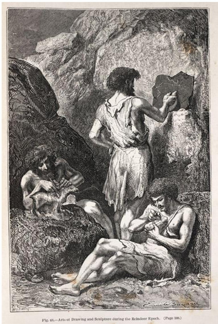
Fig. 1 – Émile Bayard, Les Précurseurs de Raphaël et de Michel-Ange, ou la Naissance des arts du dessin et de la sculpture à l'époque de la renne , illustrazione 57 di Louis Figuier, L'Homme primitif (1870)

della fine del secolo XIX ai libri di storici e critici dell'arte, la rimediazione dell'arte paleostorica trova uno snodo fondamentale di riflessione nell'utilizzo del cinema, per culminare nell'utilizzo del 3D per la prima volta con l'opus di Werner Herzog, Cave of forgotten dreams .