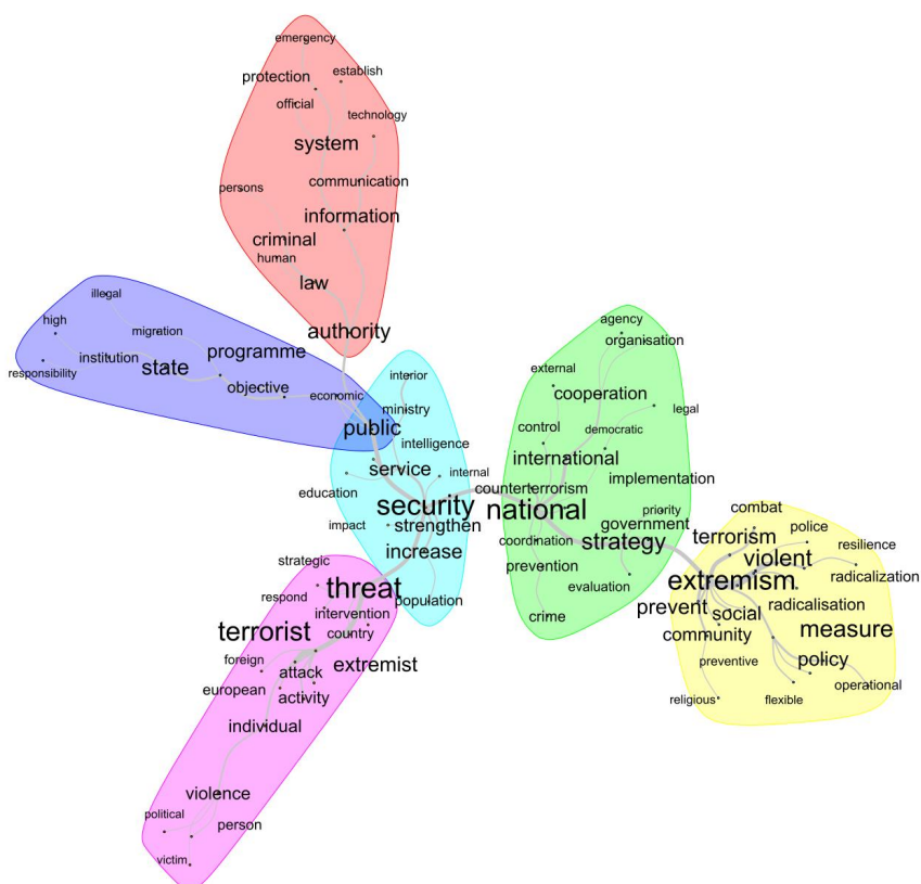
GRÁFICO II. Red de co-palabras comunes generada a partir de la documentación (2015-2020) correspondiente a países que han sufrido atentados con víctimas mortales -tabla I-.

La herramienta de análisis ha arrojado los gráficos que se muestran en los Gráficos II y III. En cada imagen se visualiza la red de semejanzas de manera que se deduzcan los modelos o prioridades que han seguido cada conjunto de países en relación con la prevención de la radicalización en su territorio.