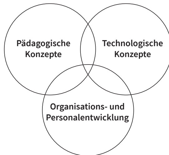
Abb. 3.: Medienentwicklungsplan.

Wie bereits im vorherigen Kapitel dargelegt wurde, bietet virtuelle Realität grosse Potenziale für den Bildungssektor und somit auch für den schulischen Unterricht. Jedoch konnten die bildungstheoretischen Bemühungen der rapiden Entwicklung der Technologie nicht standhalten und es gibt bislang noch keine klare Vorstellung davon, wie man VR in schulische Bildungsprozesse systematisiert integrieren kann (vgl. Martín-Gutiérrez et al. 2017, 478). Dies ist jedoch von entscheidender Bedeutung, da Virtuelle Realitäten nur dann effizient in der Lehre eingesetzt werden können, wenn die Medien in pädagogische und technische Konzepte sowie in Prozesse der Organisations- und Personalentwicklung eingebettet sind. Daher wird es künftig Aufgabe sein, klare Entwicklungsrichtlinien zu eröffnen, welche die genannten Aspekte einbeziehen.