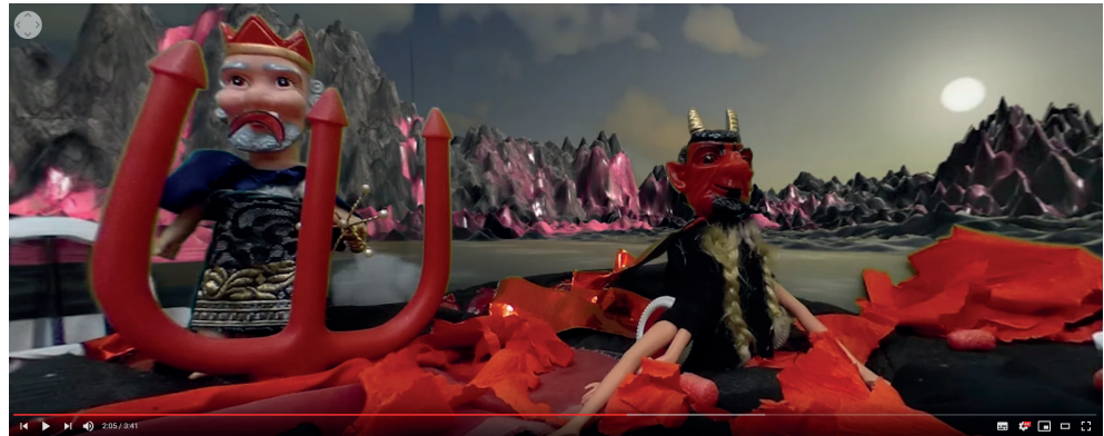
Abb. 1.: Screenshot aus dem 360-Grad-Video «Der selbstverliebte König».

Die Anwendung «Google Expeditions-Tour Creator» erlaubt es Anwenderinnen und Anwendern eigene Storys mit 360°-Bildern zu entwickeln, indem 360°-Fotos oder Google Street-View-Bilder eingebunden werden. In diesen Touren können spezifische Bildausschnitte mit Informationen oder Grafiken versehen werden.