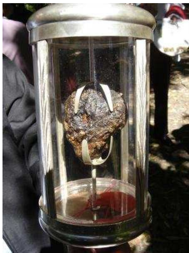
Imagem 1: Relíquia: Coração de Roque González 12

reliquias cristãs da América que circula pela região platina 11 .