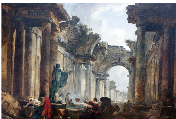
Imagem 3: Hubert Robert (Paris, 1733 – 1808) 26

O gosto pelas ruínas atingiu grande importância em um contexto histórico onde a paisagem mudava radicalmente. As litografias populares, os quadros de paisagem, retratavam em tons de melancolia poética a imagem do passado que se perdia rapidamente. O sentido do patrimônio nacional foi formado, não apenas como uma valorização à obra de séculos, mas, também, por meditação fúnebre, a busca por um luto, que como lembra Guillaume 25 é o trabalho da política do patrimônio.