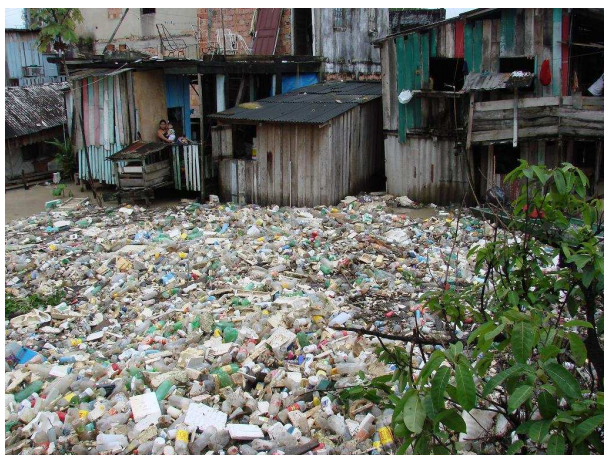
Imagem 4 34

permitir uma renovação do planeta sem o risco de destruí-lo.