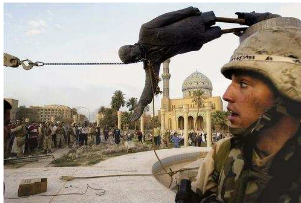
Imagem 2: Invasão do Iraque. 2003. 17

símbolos de Saddam Hussein foram destruídos.