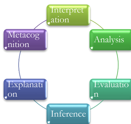
Gambar 2. Indikator Kemampuan Berpikir Kritis Matematis

Teknik pengumpulan data menggunakan metode tes tertulis untuk melihat kemampuan berpikir kritis terhadap siswa secara matematis. Berikut adalah indikator berpikir kritis matematis: