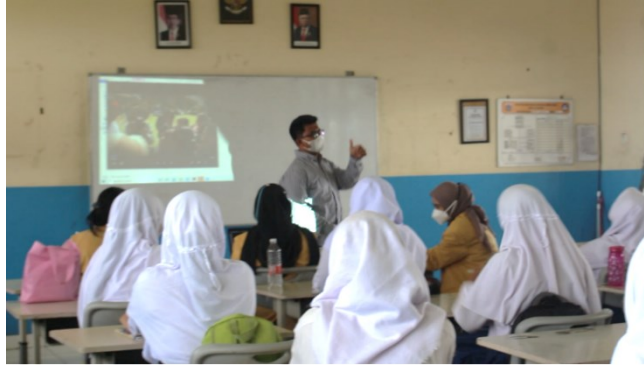
Gambar 2. Sesi 1 (Pengenalan Jurnalistik dan Media Digital)

Materi yang disampaikan dalam sesi pertama ialah dasar jurnalistik dimana siswa di perkenalkan dengan definisi jurnalistik dan produk jurnalistik berupa berita. Siswa juga diberikan materi tentang jenis media digital, prosedur penggunaan serta proses produksi pesan. Siswa juga diberikan informasi mengenai jenis media digital yang berkembang baik audio digital, video digital, platform digital, maupun media sosial.