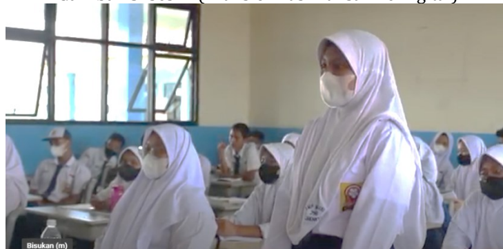
Gambar 5. Sesi 4 (Transformasi Tulisan ke Digital)

Sesi terakhir adalah mengunggah cara mengunggah tulisan di laman web atau di media sosial twitter. Namun sebelumnya siswa saling memaparkan hasil tulisan masing-masing kemudian dibangun suasana tanya jawab antar siswa sebagai bentuk saling mengisi ide dan merevisi kalimat agar diketahui kekurangan dan kelebihan dari masing-masing tulisan