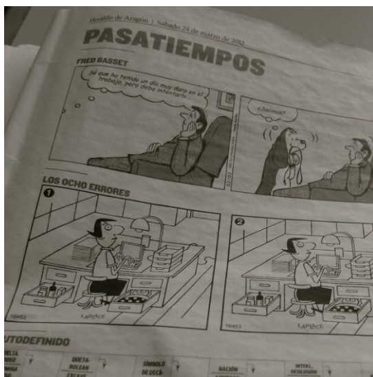
Fig. 2. Aspecto de la disposición de «Los ocho errores» en el diario zaragozano Heraldo de Aragón, en la sección de Pasatiempos.

Él mismo definió al personaje habitual de sus viñetas como «un pequeño hombrecillo ingenuo de ojos soñadores», 4 pero bien parece que Jean Laplace se autorretratara miles de veces como este antihéroe que dibujó en sus viñetas. Más que soñador, el hombre laplaciano es un recogido epicúreo, un escéptico resabiado y existencialista sin pedantería. Jean Laplace era un hombre solitario y tímido, en ocasiones identificado con una persona perdida en el desierto, o con un naufrago en una isla desierta, o con un ciudadano extraviado en los tiempos modernos de la ciudad, o un alpinista que se enfrenta a una cumbre, siempre solo. En ciertas escenas hay más de un personaje, pero rara vez más de dos o tres, en parte por una simplificación de la escena pero sin duda, también, como reflejo de esta personalidad. Celoso guardián de su intimidad, Jean Laplace no daba muchas entrevistas y no tengo constancia de que tuviera interés alguno en salir en televisión. Tampoco frecuentaba los salones profesionales ni tenía preocupación por lograr premios o pomposos reconocimientos. Aunque lo era, Jean Laplace no se consideraba un gran artista, sino un artesano del humor gráfico que hacía bien su trabajo y que,