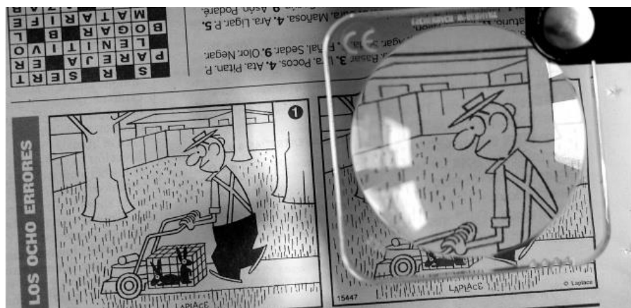
Fig. 4. Buscando «Los ocho errores» de Laplace en Heraldo de Aragón con ayuda de una lupa.

Todas las estrategias son válidas y hay quien puede recurrir a lentes de aumento para buscar los errores más ocultos, después de haber paseado la vista en sistemáticos barridos horizontales y verticales [fig. 4]. Una computadora no tardaría más que unas décimas de segundo en comparar las dos imágenes y darnos el resultado. La dificultad del pasatiempo radica en la forma de procesar la información que tiene nuestro cerebro. Laplace juega con ventaja, pues nos presenta diferencias que se esconden bajo las leyes de la percepción visual y la psicología de la Gestalt. Como es sabido, «el todo es diferente a la suma de las partes» y nuestro cerebro tiende a interpretar los estímulos visuales con ciertas reglas (de pregnancia, de cierre, de proximidad, de simetría, de continuidad, de dirección, etc.). En este sentido, Laplace es un artista próximo al Op-art, movimiento que surge justamente cuando él comienza a dibujar pasatiempos, pues se sirve de leyes ópticas y exige la participación del espectador.