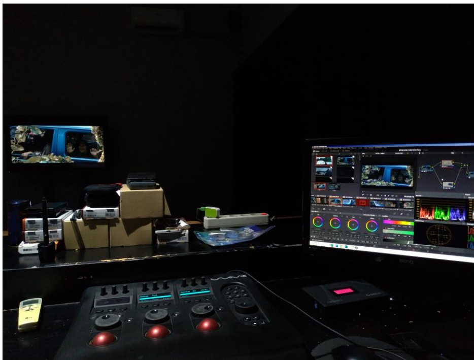
Gambar 2.2. Interior Studio Trivision