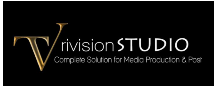
Gambar 2.1. Logo Perusahaan (sumber : Dokumentasi Perusahaan)