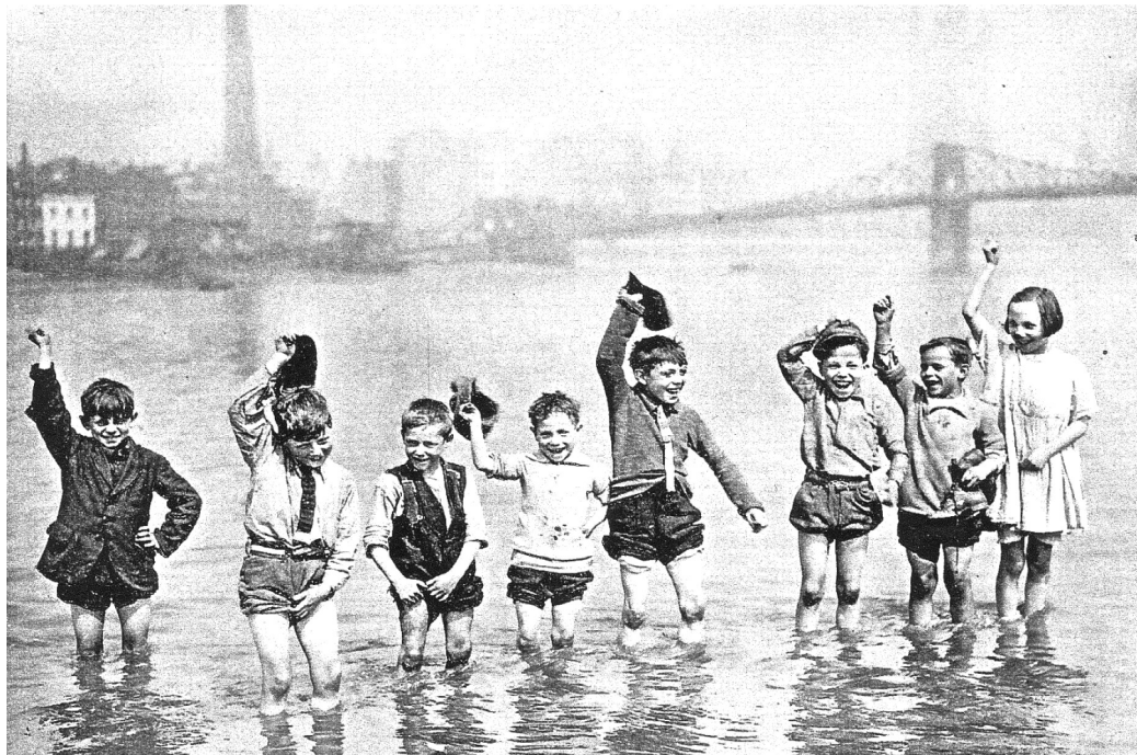
Snímek z dětství členů profesorského sboru FSS MU zachycuje okamžik, kdy se dozvěděli, že se jimi jednou stanou.