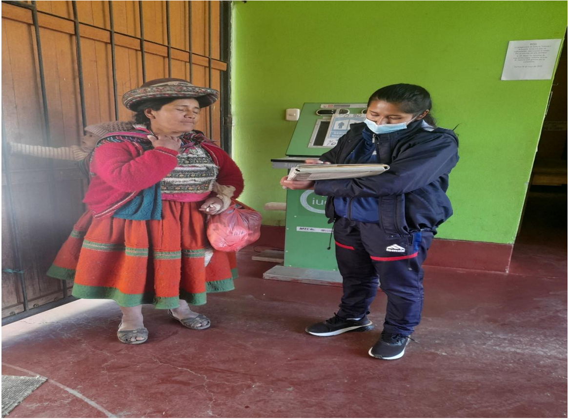
Fotografía 06 Entrevista a las beneficiarias