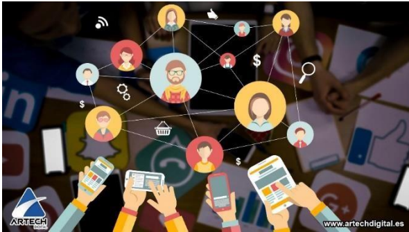
Figura 2. Ideas para no perder alcance orgánico en las redes sociales