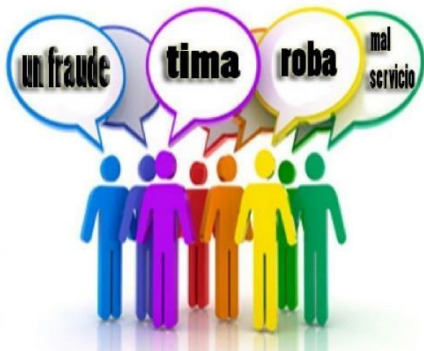
Figura 6. Estrategias para bajar en resultados de reputación negativa.