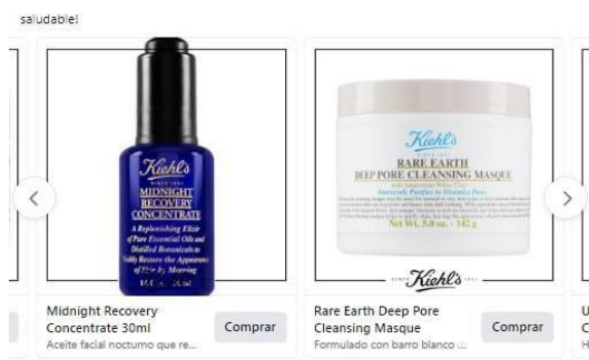
Figura 7. Anuncios por secuencias

Fuente: VeryBilbao (2021), imagen de Kiehls sobre cremas.