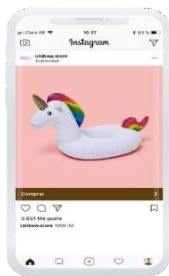
Figura 9. Anuncios que se pueden publicar en feeds de Instagram.

Fuente: Stavrou (2021), imagen de anuncios en foto de Instagram.