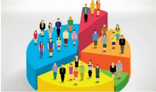
Figura 3. Segmentación de Mercado.