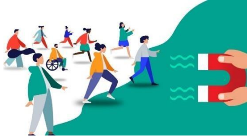
Figura 5. El arte de retener a tus clientes