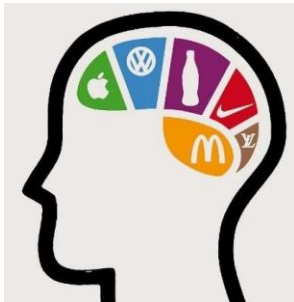
Figura 4. Reconocimiento de marca.