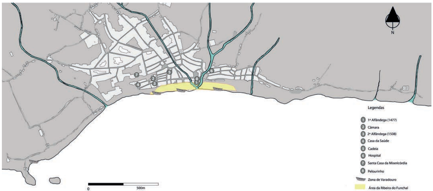
Figura 1B – Cidade do Funchal (séculos XVI-XVII). Localização das diferentes estruturas administrativas e ligadas ao controlo sanitário e portuário.

da existência de “pestes”. No caso das ilhas atlânticas, as notícias sobre epidemias chegavam através de testemunhos dados pelos comandantes dos próprios navios, ou através de correspondência oficial que dava notícia de algum tipo de doença contagiosa que estivesse a ocorrer no Reino, ou na Europa. Mediante estas informações eram sinalizados determinados portos ou locais de origem do foco de infecção, evitando-se assim a propagação de qualquer tipo de epidemia. Recebendo os despachos de saída dos portos de onde provinham as embarcações, era assim possível decidir se era ou não seguro o desembarque, procedendo de forma a evitar contágios, o que nem sempre ocorria. A todos era aplicado o procedimento das vistorias e, sob suspeita de haver algum caso a bordo ou passagem por um porto onde se temesse haver epidemias, era determinado um ancoradouro de quarentena ou degredo (termo utilizado nas fontes da época aplicado a pessoas e mercadorias) específico distante dos ancoradouros usuais, ou mesmo a proibição de contacto com terra. Já às mercadorias, por exemplo os panos, também podiam estar sujeitas a degredo . Num registo de 1649 foi determinado que os panos que estavam depositados nos armazéns da Alfândega de Angra, oriundos de França, fossem ventilados numa barraca de madeira em ponto alto e arejado da cidade (GARCIA, 2008).