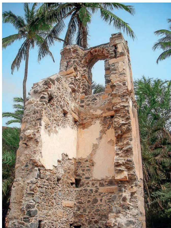
Figura 2 – Vestígios da torre sineira da Misericórdia da Ribeira Grande (Cidade Velha).

Esta situação torna-se particularmente interessante porquanto introduz duas questões pertinentes – o uso de ervas e plantas medicinais locais na prevenção e alívio das “doenças da terra” que afectavam sobretudo os recém-chegados, e que é atestado pela documentação da época (ROQUE & TORRÃO, 2013a), e a do próprio espaço da cidade portuária considerado como uma ameaça – e que, extravasando o contexto dos espaços insulares em períodos cronológicos precisos, nos remete para situações recentes, como as de marginalização de espaços físicos e geográficos e tentativas de controlo e aprisionamento da circulação do vírus COVID-19, justificando a pertinência de uma investigação que incorpore a dimensão histórica desta problemática.