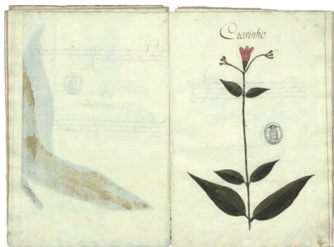
Figura 3 – Cravinho Exemplo de produção de conhecimento sobre plantas medicinais no século XVIII Autor: Domingos Alvez Branco Muniz Barreto Repositório: Academia das Ciências de Lisboa, Série Azul de Manuscritos, COD 627.

de sementes e plantação das diferentes espécies, antecipando a disseminação posterior de plantações nos territórios ultramarinos dos impérios europeus (GOMES, 1875).