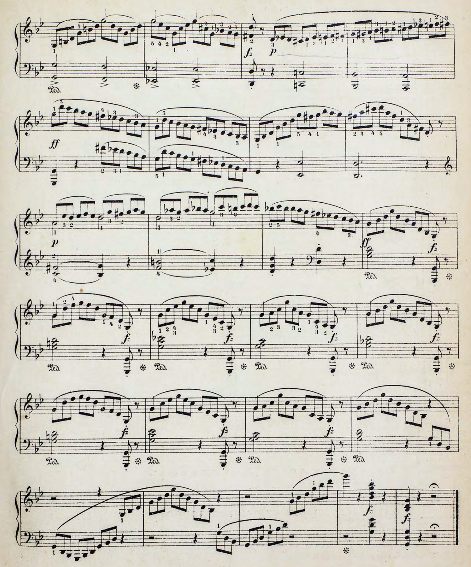
IMPRIDE MUSIQUE J. TOHUKOLOFF & KIEFF