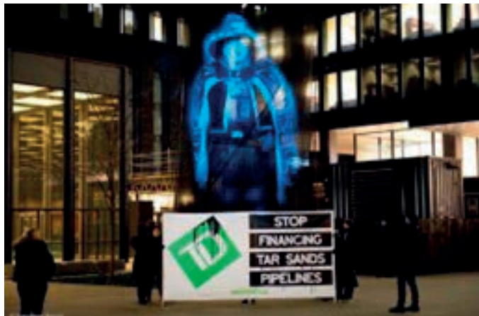
Fot. 12. Marsz hologramów. Partia Greenpeace, Kanada