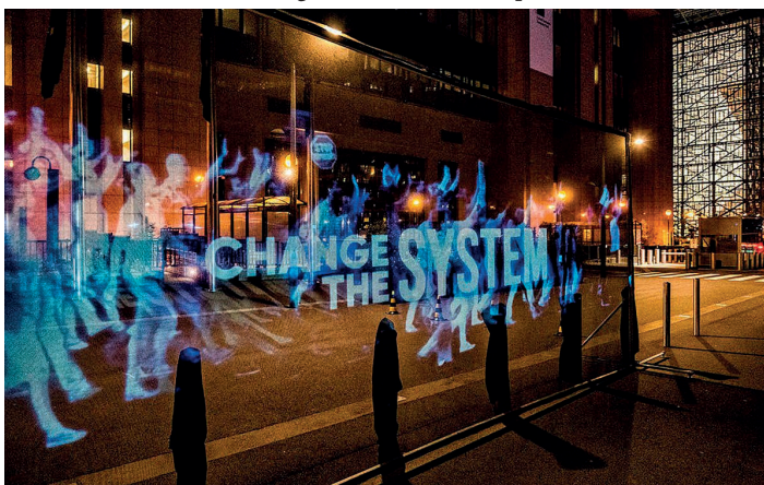
Fot. 13. Marsz hologramów. Partia Greenpeace, Bruksela