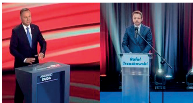
Fot. 1. Debata wyborcza kandydatów prezydenta RP. Andrzej Duda (Końskie), Rafał Trzaskowski (Leszno)