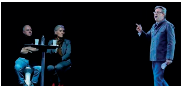
Fot. 4. Jean-Luc Mélenchon. Obraz holograficzny