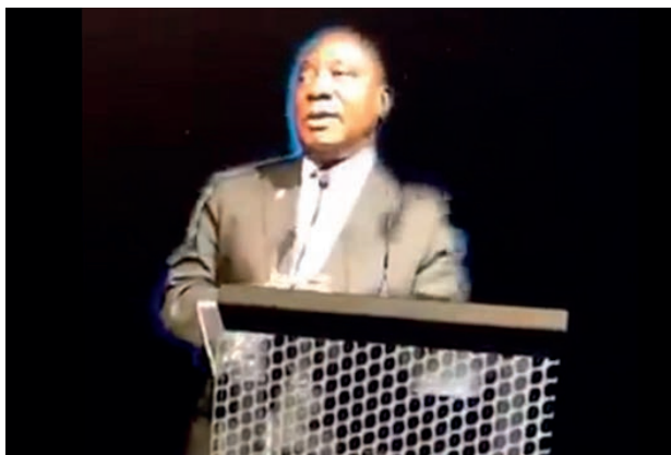
Fot. 7. Cyril Ramaphosa. Obraz holograficzny