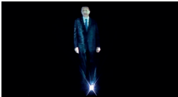
Fot. 3. Recep Tayyip Erdoğan. Obraz holograficzny