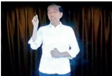
Fot. 6. Joko Widodo. Obraz fotograficzny