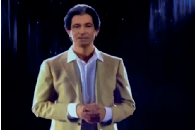
Fot. 15. Robert Kardashian. Obraz holograficzny