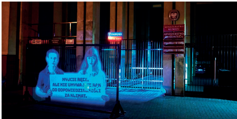
Fot. 14. Marsz hologramów. Młodzieżowy Strajk Klimatyczny, Warszawa