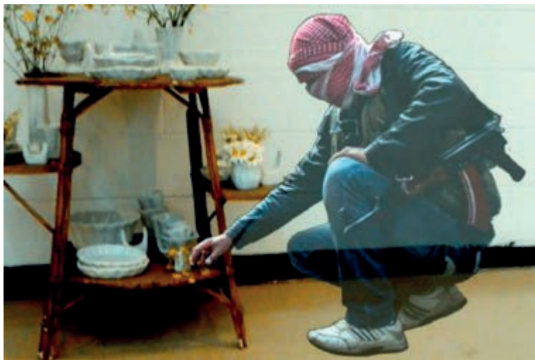
Fot. 11. „Hologramy z Syrii”, Asad J. Malik