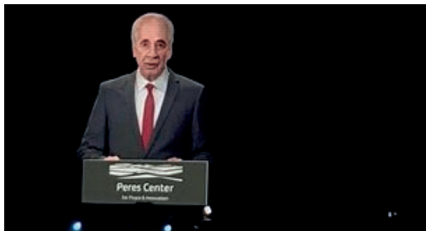
Fot. 5. Simon Peres. Obraz holograficzny