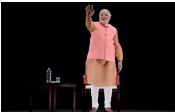
Fot. 2. Narendra Modi. Obraz holograficzny