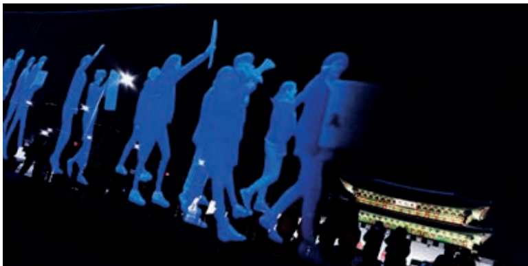
Fot. 10. Marsz hologramów „Wiec duchów”, Amnesty International, Seul