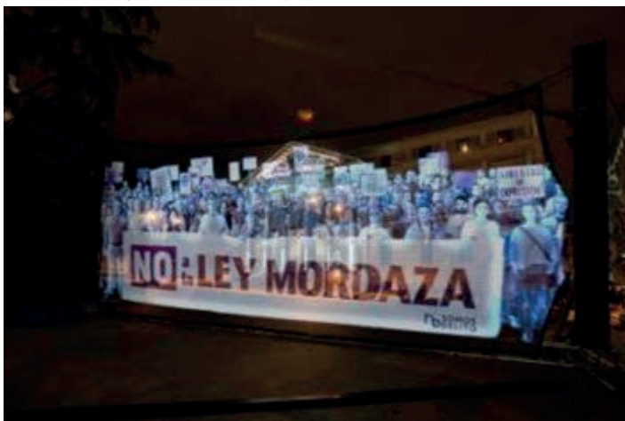
Fot. 9. Marsz hologramów. Protest obywateli przeciwko prawodawstwu w Hiszpanii