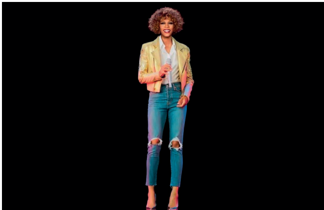
Fot. 16. Whitney Houston. Obraz holograficzny