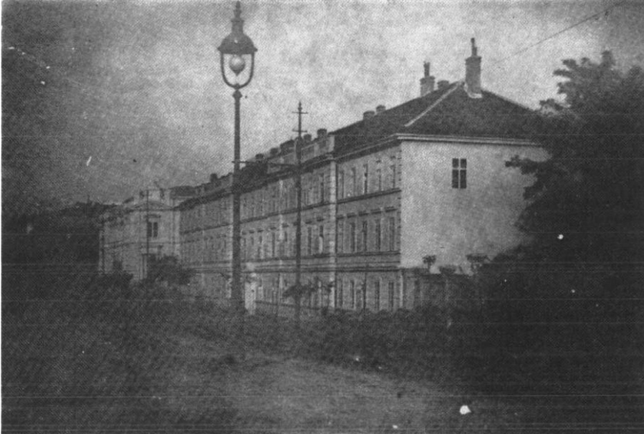
Слика 1: Зграда Војне академије снимљена око 1890. године. Аутор: Ђорђе Станојевић.

Срба. Приступно предавање којим отпочиње Станојевићев високошколски наставнички рад одржано је 22. септембра 1887. године.