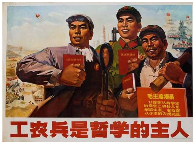
Εικόνα 4: Workers, farmers, soldiers are the Masters of Philosophy ".

Κατά τη διάρκεια της παρούσας μελέτης, περαιτέρω εννοιολογικές διευκρινήσεις θα δοθούν, εάν αυτό κριθεί απαραίτητο.