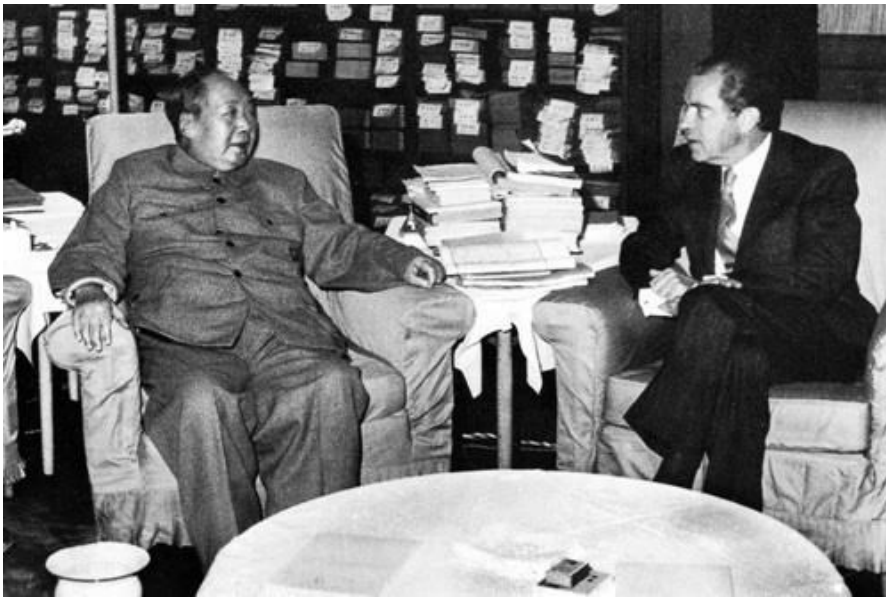
Εικόνα 12: Nixon in China

The China-visit of President Richard Nixon symbolizes the beginning of the normalization of Sino-US relations. Chairman Mao Zedong met with President Richard Nixon in Beijing. Πηγή: http://www.china.org.cn/international/china-us/2009-01/04/content_17050963.htm