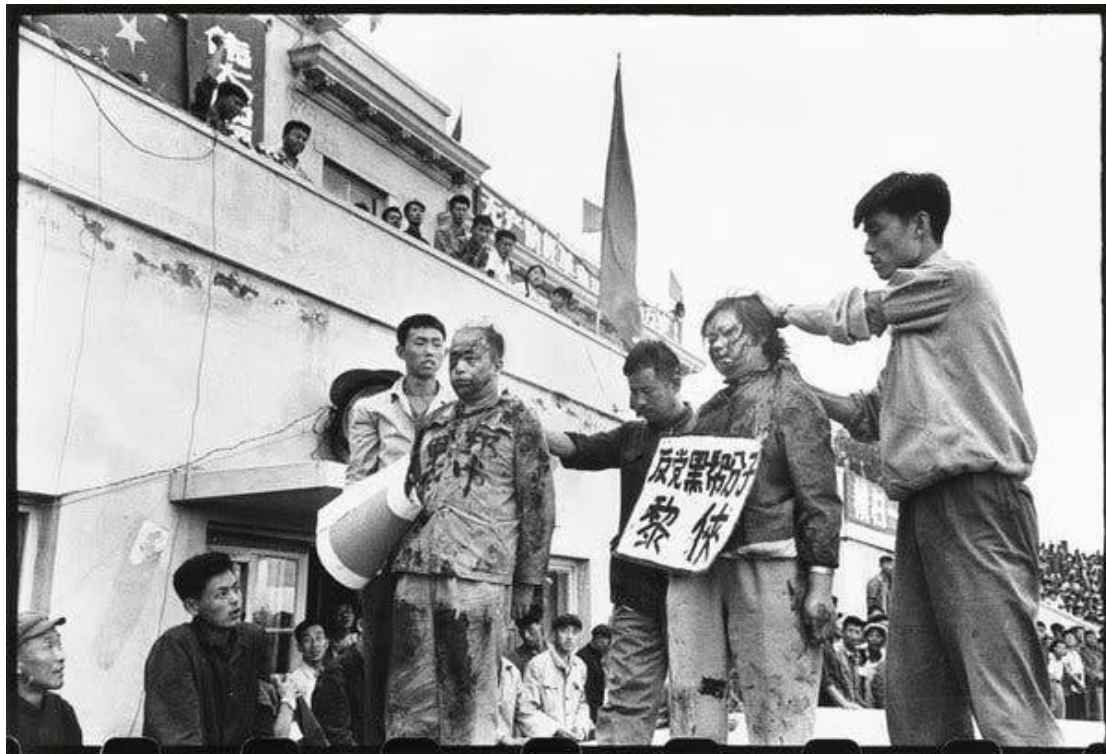
Εικόνα 10: Public punishment.

A rally at a stadium in Harbin, China, in 1966, attended by the photographer Li Zhensheng. A Communist Party secretary and the wife of another official were denounced and splattered with ink.