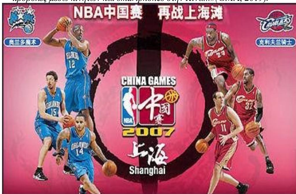
Εικόνα 22: NBA players in China

-Το 2017, ο τελικός του NBA προσέλκυσε περισσότερες από 200 εκατομμύρια προβολές μέσω κινητών και smartphones στην Κίνα...»(GMA, 2019).