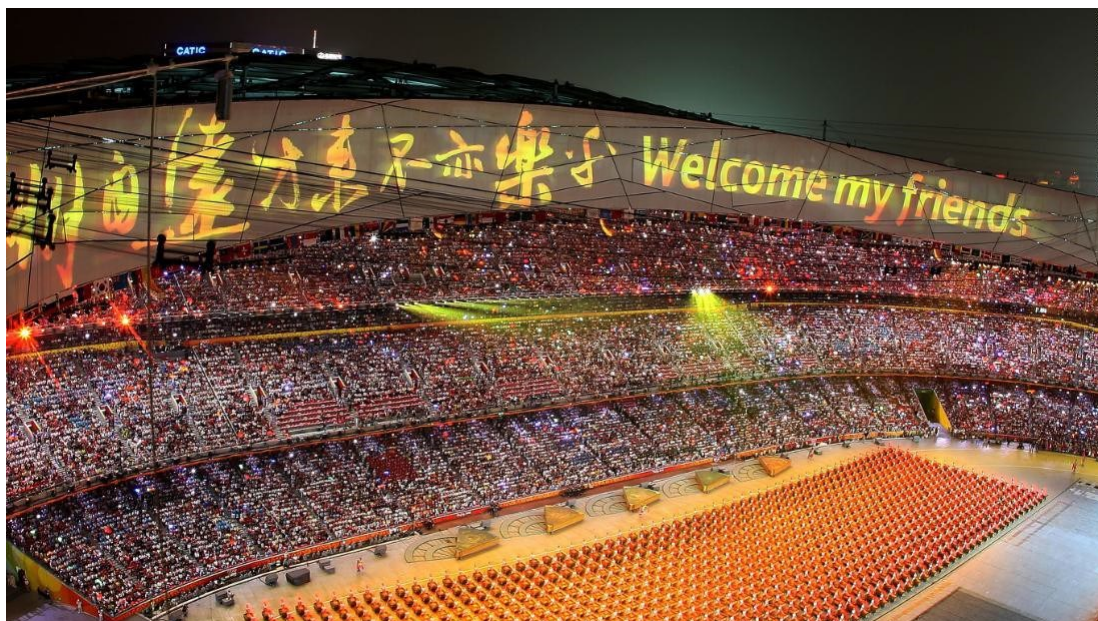
Εικόνα 24: Great Olympics, great China