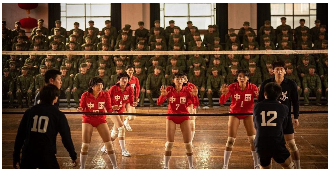
Εικόνα 18: Ready to “leap”

Δε θα πρέπει να παραλείψουμε να πούμε ότι κεντρική πρωταγωνίστρια στην παραπάνω νίκη-ορόσημο της Κίνας εναντίον της Ιαπωνίας υπήρξε η τότε πολύ νεαρή Λανγκ Πινγκ, η αθλήτρια η ζωή της οποίας θα εμπνεύσει το σενάριο του φιλμ «το άλμα» το οποίο έχουμε ήδη παρουσιάσει.