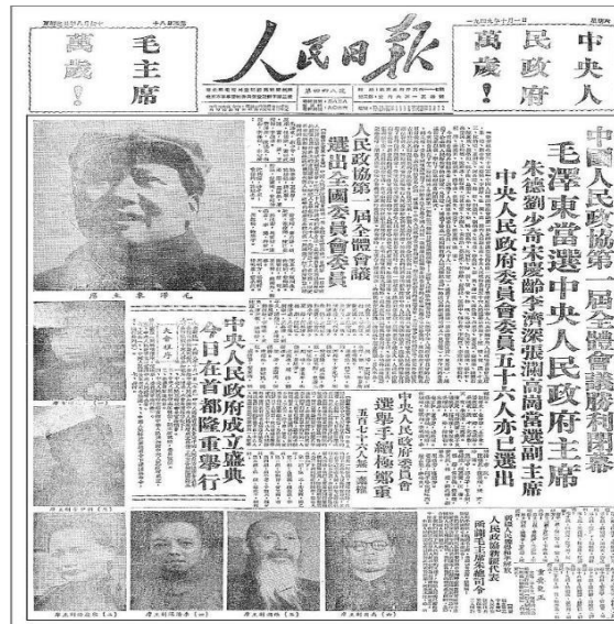
Εικόνα 3: People's daily on 1 October 1949, the day of the establishment of China, P.R