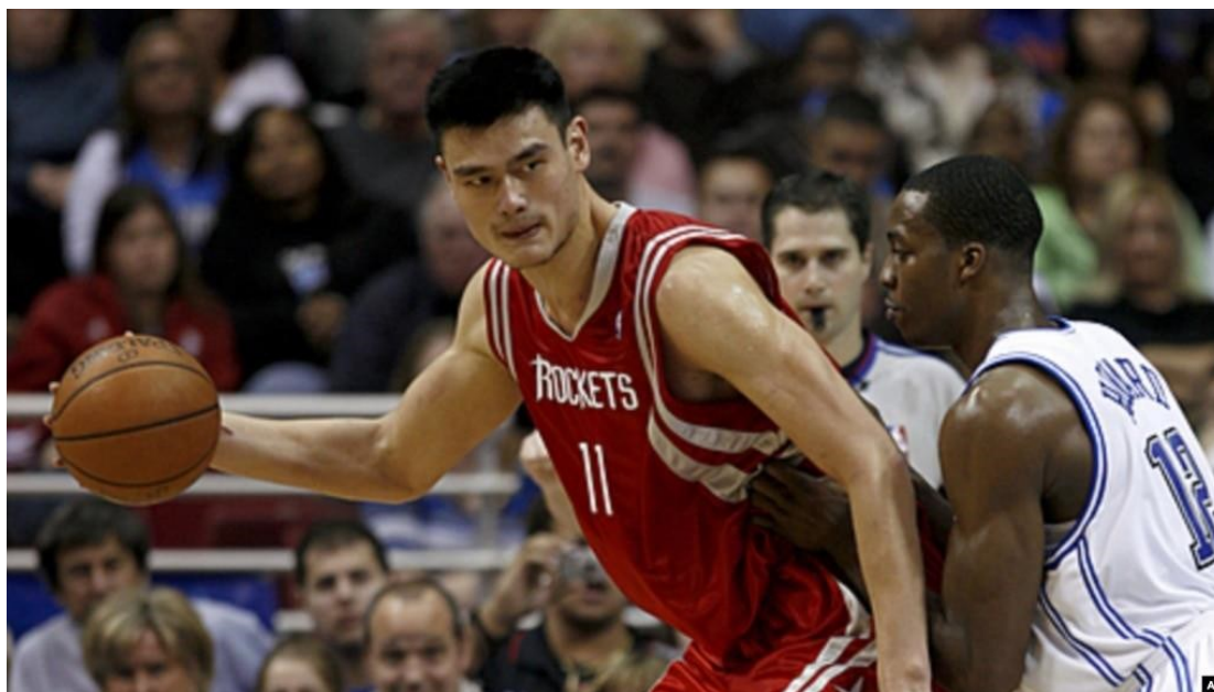
Εικόνα 21: The “dragon” of MBA

πλαίσια του οποίου η κατάκτηση οποιουδήποτε πεδίου, αθλητικού και όχι μόνο, θα φάνταζε εφικτή!