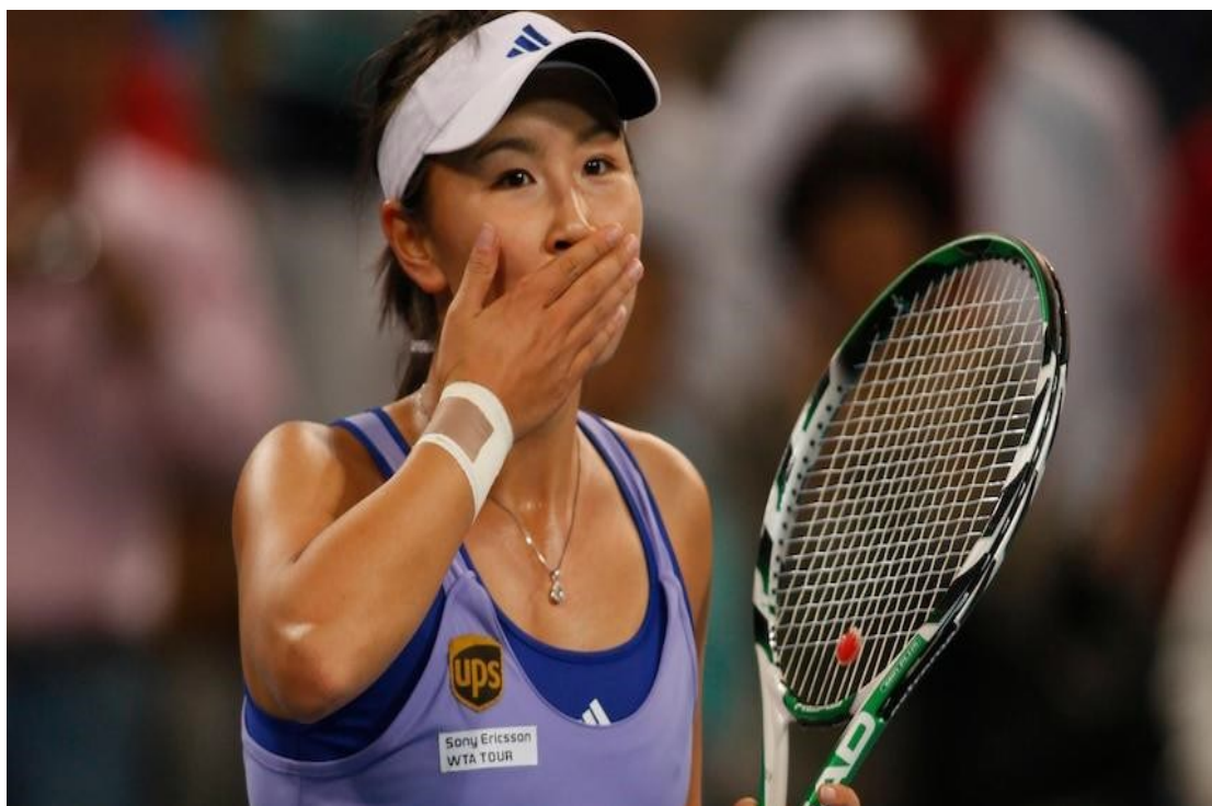
Εικόνα 1: P.S.

Θέμα: «Πολιτική φιλοσοφία και ιδεολογική εργαλειοποίηση του αθλητισμού υψηλού επιπέδου στην κομμουνιστική Κίνα.»