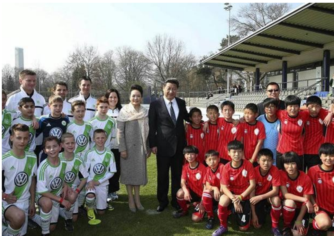
Εικόνα 19: President Xi "on the ball", when it comes to sport.