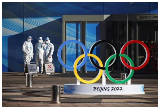
Εικόνα 2: Workers near "nest stadium".