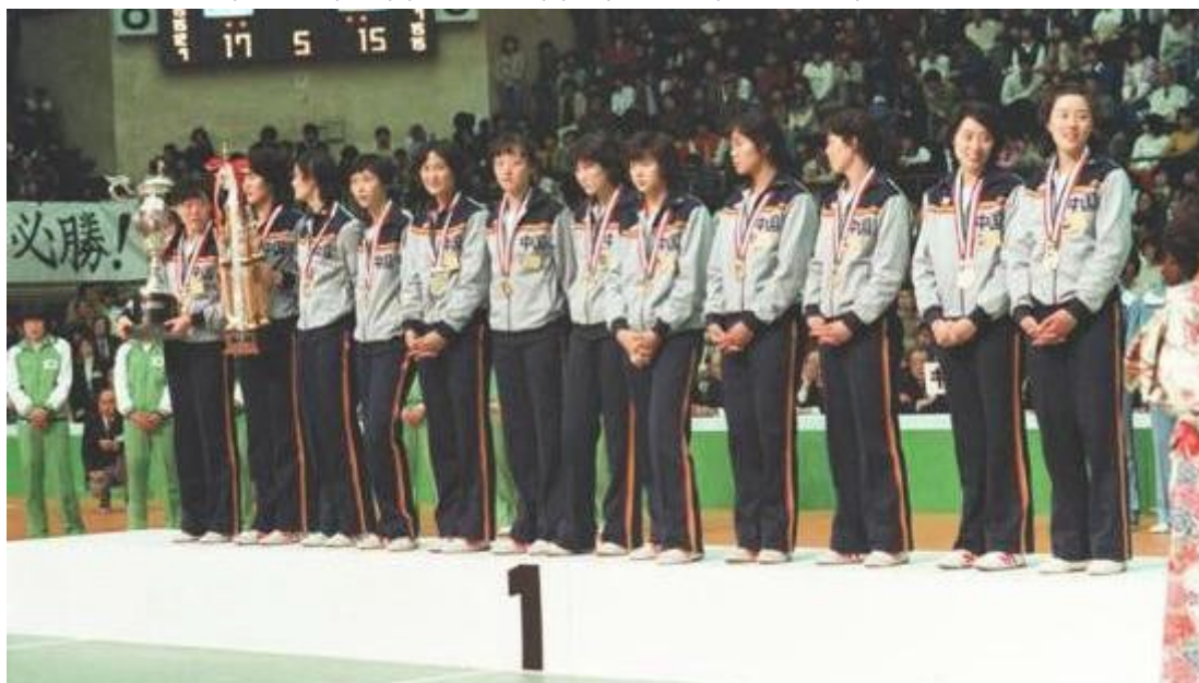
Εικόνα 16: world cup champion, 1981

Chinese women's volleyball players are seen on the victory podium after their team beat Japan 3-2 in the final to win the FIVB Women's World Cup for the first time in history in 1981