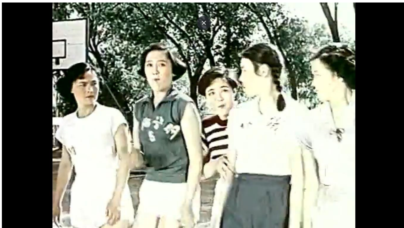
Εικόνα 14: Basketball player No. 5, the movie