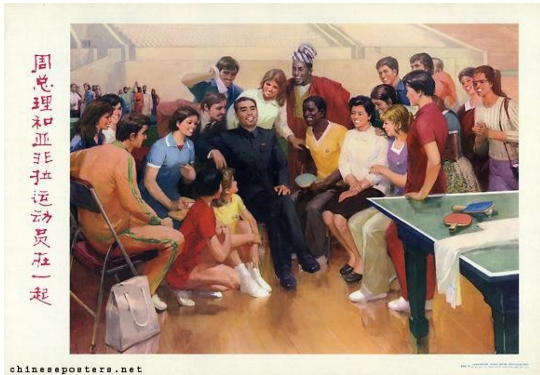
Εικόνα 11: Ping Pong & Diplomacy

Premier Zhou with athletes from Asia, Africa and Latin America, 1979.