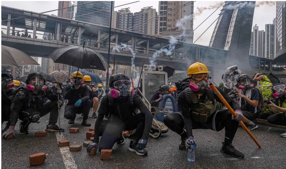
Εικόνα 23: “Bizarre rain” in Hong Kong