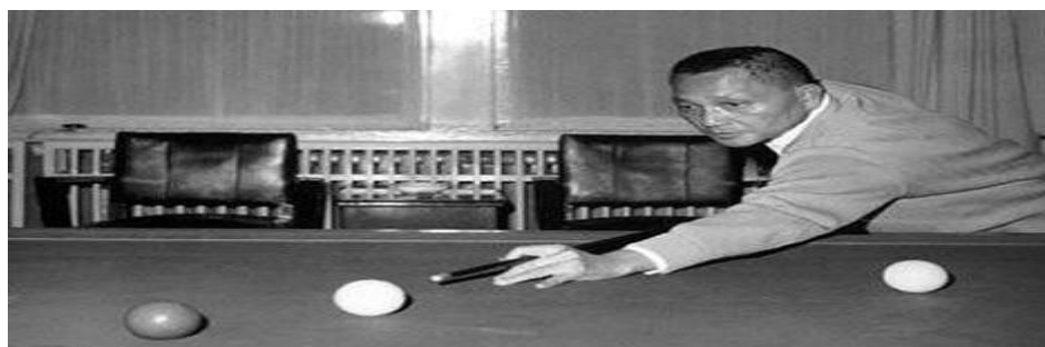
Εικόνα 17: Deng Xiaoping. the “reformer”

Όπως αναφέρουν οι Dong & Li (2008) ο ηγέτης της μετά-μαοϊκής εποχής στην Κίνα, ο Ντενγκ Σιαοπίνγκ ανήγγειλε «ιδεολογικές μεταρρυθμίσεις και αλλαγές στον χώρο του αθλητισμού, καθώς και γενικότερες πολιτικές που θα άνοιγαν πόρτες στα πλαίσια ενός σοσιαλιστικού συστήματος με κινέζικα χαρακτηριστικά!» Ο ίδιος πίστευε ότι η επιτυχία σε διεθνείς αγώνες θα οδηγούσε στη διεθνή αναγνώριση της χώρας του και με τον τρόπο αυτό η αθλητική του πολιτική έδωσε έμφαση στην οικοδόμηση μιας θετικής εικόνας στο εξωτερικό.