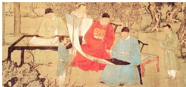
Εικόνα 5: Confucious .