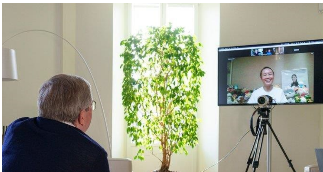
Εικόνα 25: IOC President Tomas Bach in conversation with Peng Shuai

Είναι προφανές, και με βάση τις παραπάνω διαπιστώσεις, ότι σε πολιτικό επίπεδο η Κίνα με το πέρασμα του χρόνου «σκληραίνει» τη στάση της, τόσο στο εσωτερικό όσο και στο εξωτερικό: περιορισμός των δημοκρατικών δικαιωμάτων στο Χονγκ Κονγκ, αύξηση του βαθμού λογοκρισίας στα μέσα κοινωνικής δικτύωσης, απειλητική στάση στην Ταϊβάν, καταπάτηση δικαιωμάτων των μειονοτήτων στη μουσουλμανική περιοχή Σιν Τζιανγκ και αλλού, ασφυκτικά lock down σε στυλ φυλακής στις πόλεις Σιάν και Γιου Τζόου, διαπόμευση πολιτών με περασμένα πλακάτ στο λαιμό τους, όπως άλλοτε τη φρικτή εποχή της Πολιτιστικής επανάστασης, εξαφανίσεις δημοσιογράφων και ενίοτε και αθλητών, όπως της Πενγκ Σουάι, με την αναφορά της οποίας ξεκίνησε η παρούσα εργασία!