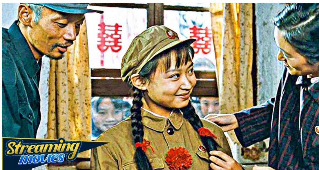
Εικόνα 15: «To live»

Αξίζει όμως, και με αφορμή κάποια από τα σενάρια των ταινιών που προαναφέραμε, να εξετάσουμε τον άκρως καθοριστικό ρόλο που έπαιξαν κάποια αθλήματα στην ιστορική εξέλιξη, και φυσικά στην ευρύτερη ανάπτυξη της κινέζικης κοινωνίας, παράλληλα βέβαια με το γεγονός ότι οι αντίστοιχες αθλητικές επιτυχίες δεν έπαψαν να αποτελούν πεδίο εκμετάλλευσης πολιτικών σκοπιμοτήτων.