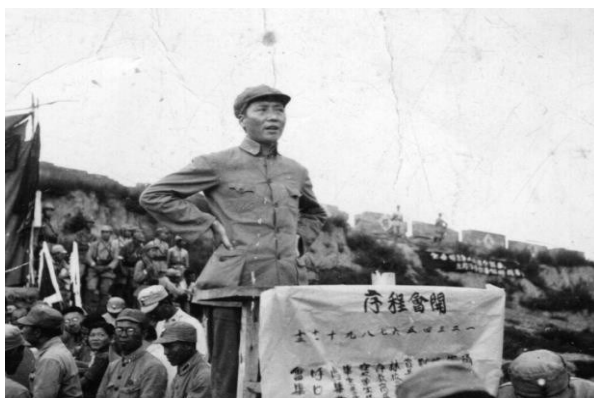
Εικόνα 6: Mao in his early years.