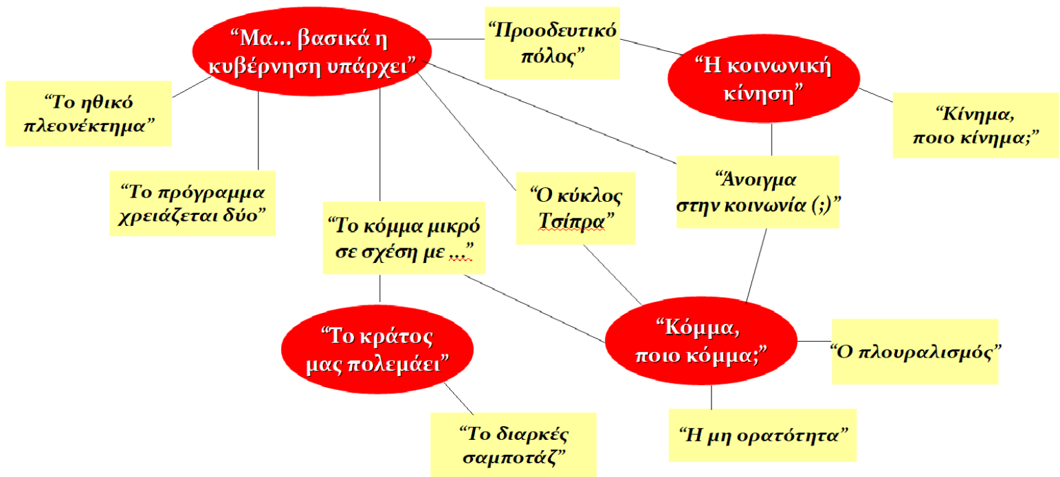
Πίνακας 3.2: Θεματικό Χάρτης “Symathisants” και Ψηφοφόρων ΣΥΡΙΖΑ & Νεολαίας ΣΥΡΙΖΑ

Το πρώτο θέμα είναι «Μα ... βασικά η κυβέρνηση υπάρχει», είναι η βασική τοποθέτηση με τον έναν ή τον άλλο τρόπο. Το ενδιαφέρον είναι ότι αυτή η τοποθέτηση στην πλειονότητα των φορών συνοδεύεται με μία διευκρίνιση – σχόλιο που αφορούσε ένα στενό πυρήνα ανθρώπων που λαμβάνουν τις αποφάσεις. Έτσι, «Ο κύκλος Τσίπρα», είναι το πρώτο υποθέμα, το οποίο επικαθορίζει σαφώς, με βάση τα ειρημμένα, και το κόμμα. Το δεύτερο και το τρίτο υποθέμα σχετίζονται κατά κύριο λόγο με την κοινωνική κίνηση και τη σχέση του ΣΥΡΙΖΑ με το κοινωνικό πεδίο, το «Άνοιγμα στην κοινωνία (;)» έχει αρκετά κοινά χαρακτηριστικά με την ανωτέρω συζήτηση μελών και στελεχών, πάρα αυτά αποφορτισμένα από κάποια αίσθηση δέοντος και ενισχυμένα από ίσως κι ένα βαθμό κυνικότητας, ενώ το τρίτο υποθέμα, «Ο προοδευτικός πόλος», αναπτύχθηκε στη βάση κοινών παραδοχών μεταξύ της κάθε ομάδας εστίασης αναφορικά με το που θα πρέπει συν τοις άλλοις να στραφεί ο ΣΥΡΙΖΑ. Το τέταρτο υποθέμα και εδώ είναι ότι «Το κόμμα μικρό σε σχέση με...», ενώ τέλος και εδώ υπήρξε η τοποθέτηση ότι «Το πρόγραμμα χρειάζεται δύο» και σαφώς υπήρξε η παραδοχή σχετικά με το «Ηθικό πλεονέκτημα».