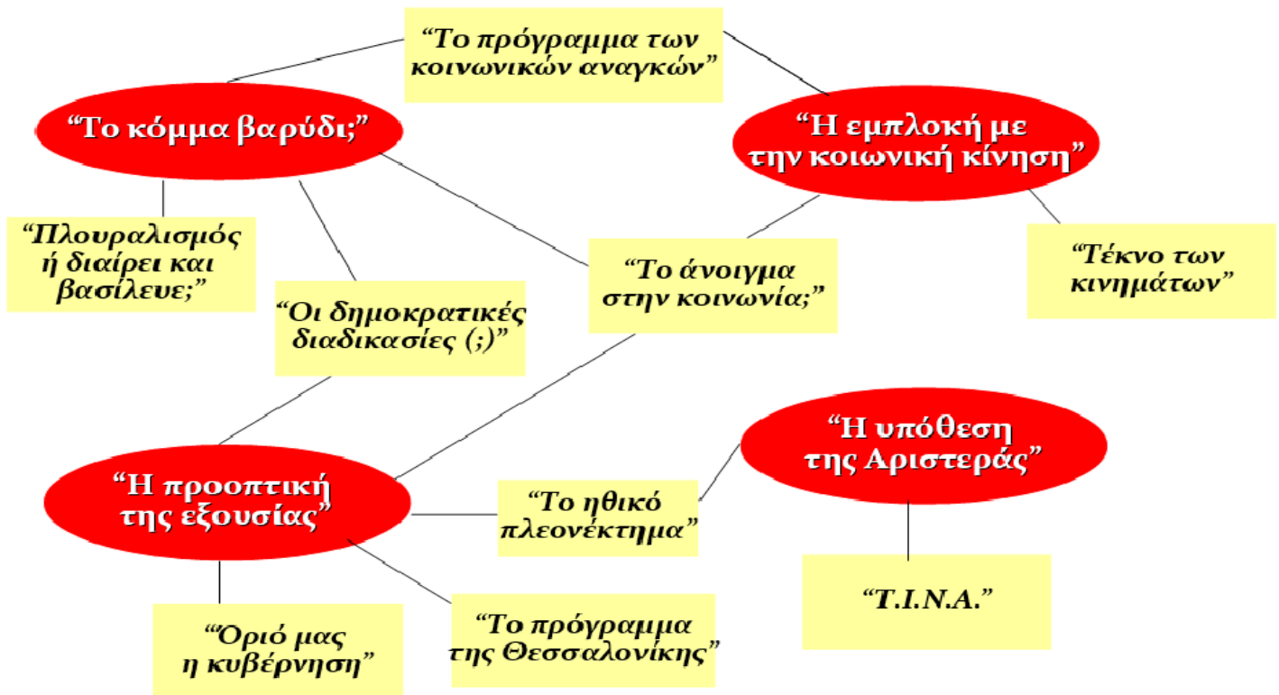
Πίνακας 3.3: Θεματικό Χάρτης Αποχωρήσαντες/σασες – Αποστασιοποιηθέντες/εισες ΣΥΡΙΖΑ & Νεολαίας ΣΥΡΙΖΑ

«Το κόμμα βαρύδι (;)» είναι μία έκφραση που ακούστηκε αρκετά κατά τη διάρκεια όλης της περιόδου προς την άνοδο στην κυβερνητική εξουσία. Ο συγκεκριμένος τίτλος θέλει να περιγράψει, με βάση τα ειρημένα των συμμετεχόντων/ουσών, το κόμμα που πρέπει και προσπαθεί να έχει δημοκρατικές διαδικασίες και λειτουργία, η οποία (δημοκρατία) ωστόσο δημιουργεί ζητήματα ως προς την αποτελεσματικότητα· η οποία αποτελεσματικότητα ιεραρχείται κοιτώντας την εξουσία. Το ερωτηματικό εντός παρενθέσεως, ετέθη καθώς είναι ερώτημα αν ποτέ ο ΣΥΝ/ΣΥΡΙΖΑ χαρακτηριζόταν κατ’ ουσίαν από δημοκρατικές διαδικασίες, οι οποίες να είναι ενοχλητικές στο δρόμο για την κυβέρνηση. Με άλλα λόγια και οι ίδιοι/ες επερωτούν τη λειτουργία του κόμματος πριν και από το 2012. Αυτό το θέμα περιλαμβάνει, λοιπόν, στη βάση αυτού του προβληματισμού το υποθέμα αναφορικά με τις «Δημοκρατικές διαδικασίες(;)». Η δημοκρατία σε ένα κόμμα ενισχύεται κι από τον πλουραλισμό απόψεων και θέσεων, ωστόσο τίθεται το ερώτημα «Πλουραλισμός ή διαίρει και βασιλεύει;» προς εξυπηρέτηση της αυτονόμησης της κομματικής ηγεσίας. Τα άλλα δύο υποθέματα, ασχολούνται με τη διάδραση κόμματος και κοινωνικής κίνησης καθώς «Το άνοιγμα στην κοινωνία(;)» επερωτάται για πόσο διήρκτησε και μέχρι που κατάφερε να υπάρξει όσμωση πραγματική, ώστε να υπάρξει ένα πρόγραμμα το οποίο να είναι «Το πρόγραμμα των