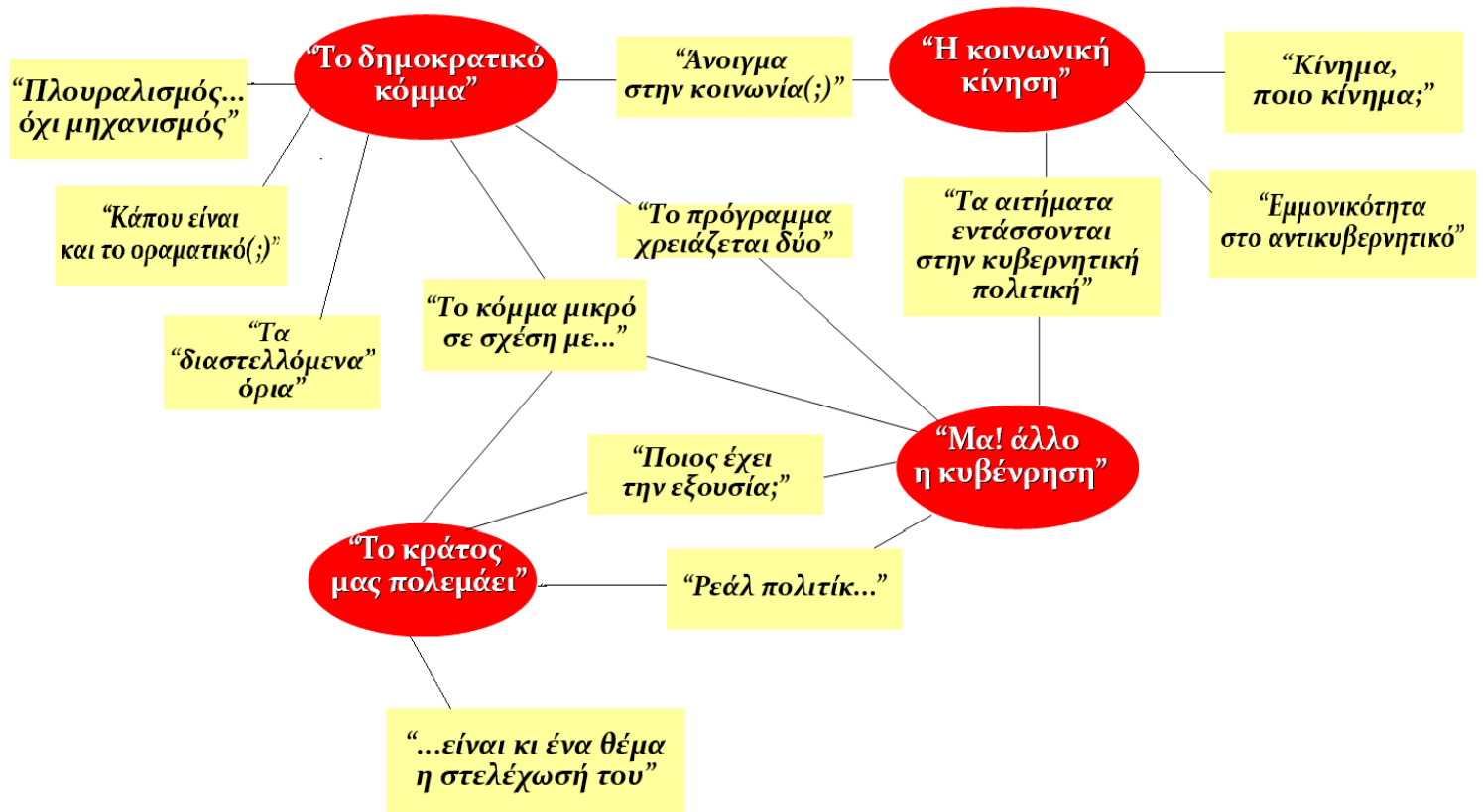
Πίνακας 3.1: Θεματικό Χάρτης Στελεχών και Μελών ΣΥΡΙΖΑ & Νεολαίας ΣΥΡΙΖΑ

«Το δημοκρατικό κόμμα» είναι ένα ζήτημα το οποίο με τον έναν ή τον άλλο βαθμό ανεδείχθη τόσο ως έλλειψη, όσο και ως ζητούμενο. Αυτός ο τίτλος προσπαθεί να φωτίσει τους προβληματισμούς για το κόμμα τόσο ως λειτουργία στο εσωτερικό του όσο και ως προς την εμπλοκή με την κοινωνία. Τα υποθέματα, τα οποία εμπεριέχονται, σχετίζονται με την σχέση του κόμματος με την κοινωνία «Το άνοιγμα στην κοινωνία (;)», με τη δομή και την λειτουργία του κόμματος ως συλλογικού διανοούμενου «Πλουραλισμός ... όχι μηχανισμός», «Τα "διαστελλόμενα" όρια» και «Κάπου είναι το οραματικό (;)» και τη σχέση του με την κυβέρνηση και εξ' αντανακλάσεως με το κράτος «Το κόμμα μικρό σε σχέση με ...» και «Το πρόγραμμα χρειάζεται δυο».