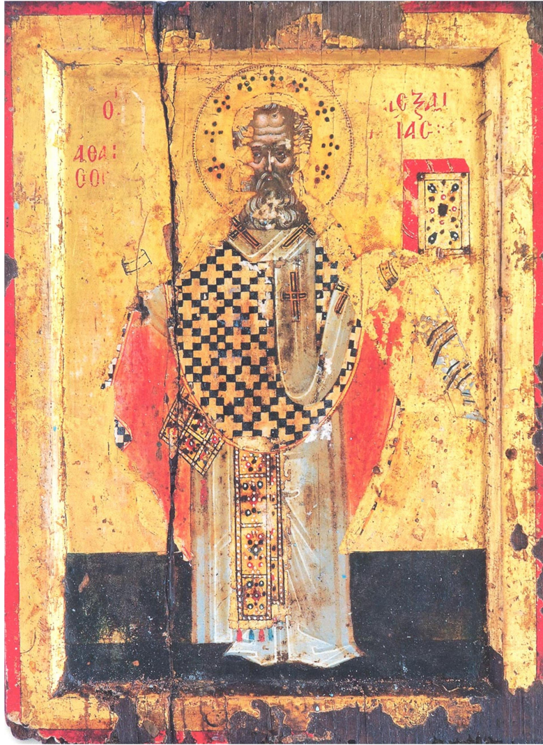
Μεταβυζαντινή φορητή εικόνα του Αγίου Αθανασίου (17ος αιώνας). Λήμνος, Ναός Αγίου Ιωάννη Πεδινού.

Ο Ευστάθιος, επίσκοπος Αντιοχείας, κατηγορήθηκε ότι είχε εκφραστεί υποτιμητικά για την μητέρα του Κωνσταντίνου, την Ελένη, και έτσι εξορίστηκε και αυτός από τον Κωνσταντίνο 365 .