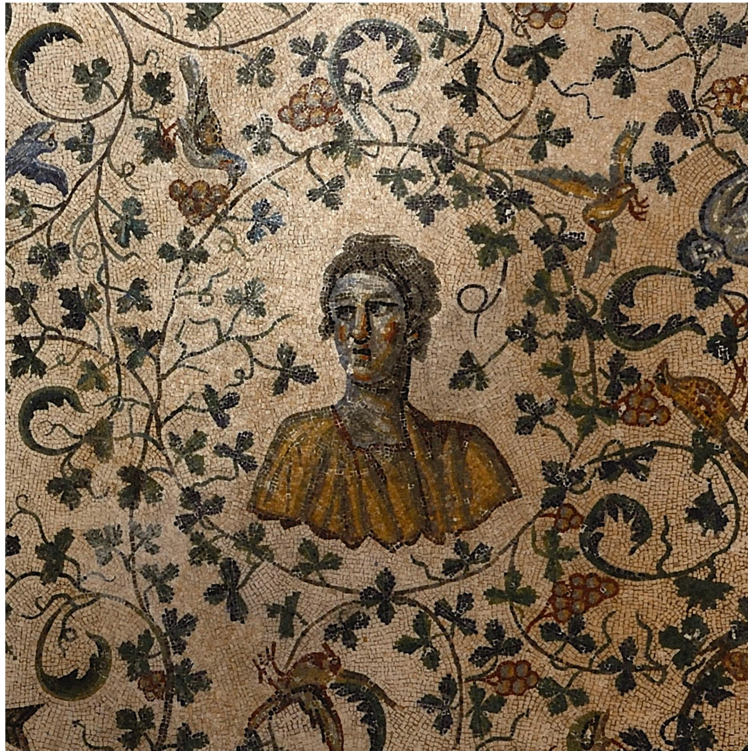
Ψηφιδωτή απεικόνιση της Κωνσταντίνας. Ρώμη, Μουσολείο Santa Constanza. Πηγή: Ιστότοπος http://ancientrome.ru (© Ilya Shurygin).