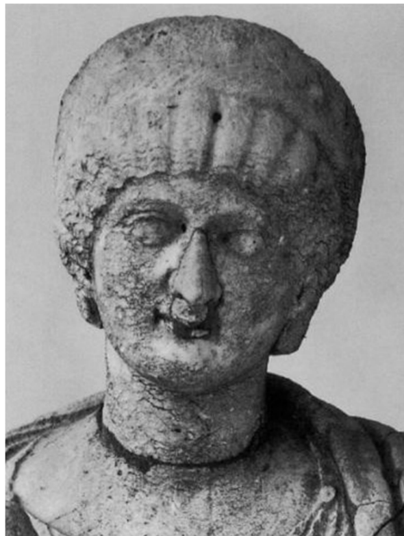
Προτομή της Ελένης (LSA-968). Ρώμη, Villa Borghese.