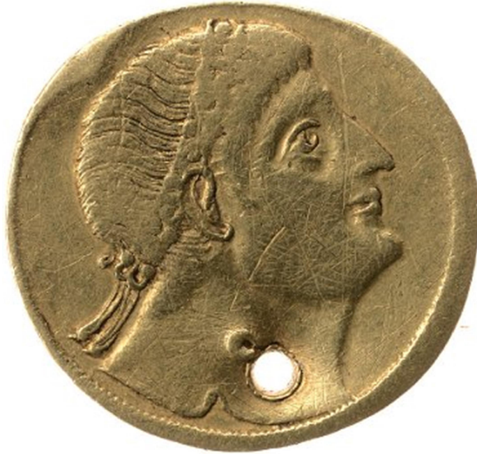
Νόμισμα του Κωνσταντίνου Α΄ (Τύπος RIC VII Nicomedia 151). Νομισματοκοπείο Νικομήδειας (ο τύπος θανάτου του). Λονδίνο, Βρετανικό Μουσείο.