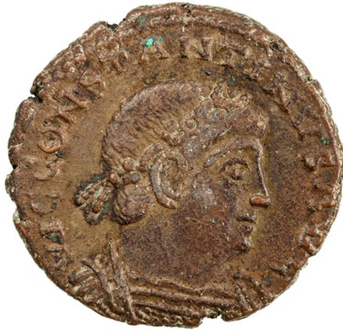
Χάλκινο νόμισμα του Κωνσταντίνου Β΄ (Τύπος RIC VIII Rome 32). Νομισματοκοπείο Ρώμης. Συλλογή American Numismatic Society.