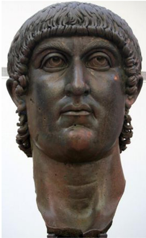
Χάλκινη προτομή του Κωνσταντίου Β΄ (LSA-562). Ρώμη, Musei Capitolini (Palazzo del Conservatori).