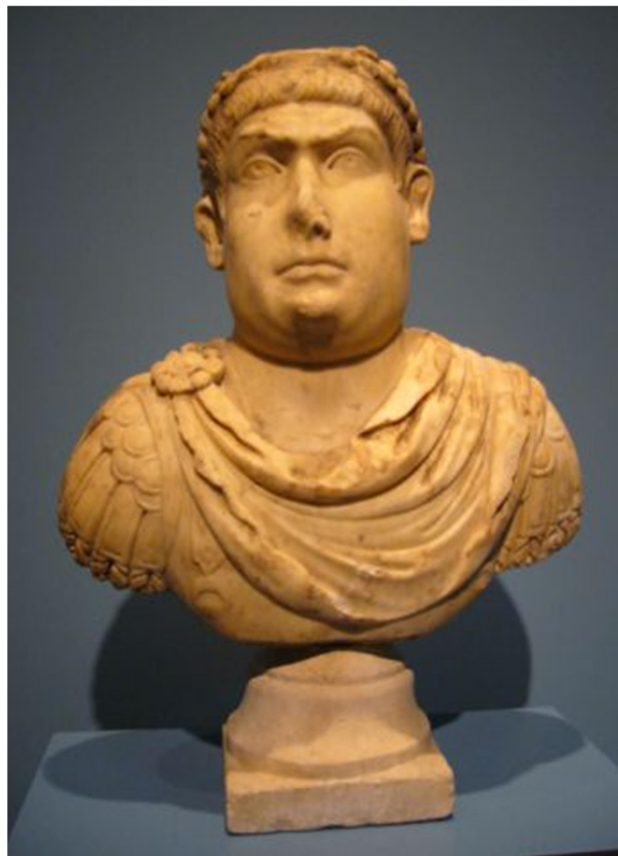
Προτομή του Μαγνέντιου (LSA-577). Βιέννη (Γαλλία), Musée archéologique de Saint-Pierre.

όμως, δεν τον ακολούθησε, αλλά κατέλαβε την Σισκία 124 , παρά την γενναία αντίσταση των κατοίκων της, προκαλώντας φοβερές καταστροφές. Μετά από αυτά, επιχείρησε να καταλάβει το Σίρμιο 125 , και αργότερα την Μούρσα 126 . Τότε βρήκε ο Κωνσταντίος την κατάλληλη ευκαιρία να επιτεθεί. Στις 28 Σεπτεμβρίου του 351, τα στρατεύματα του Κωνσταντίου συγκρούστηκαν με εκείνα του Μαγνέντιου στην πεδιάδα έξω από την Μούρσα. Οι στρατιώτες των δύο αντιμαχόμενων πλευρών πολέμησαν οι μεν εναντίον των δε με ασυνήθιστη μανία. Η μάχη συνεχίστηκε για πολλές ώρες, και τελείωσε αργά την νύχτα. Ο Μαγνέντιος ηττήθηκε κατά κράτος, και παραλίγο να συλληφθεί ως αιχμάλωτος 127 .