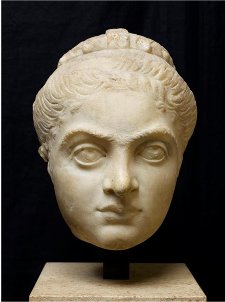
Προτομή της Φαύστας (LSA-573). Παρίσι, Μουσείο του Λούβρου.

Όπως αναφέρθηκε πιο πάνω, η Φαύστα ήταν η δεύτερη σύζυγος του Κωνσταντίνου, τον οποίο παντρεύτηκε σε νεαρή ηλικία το έτος 307. Το πλήρες όνομά της ήταν Φλάβια Μάξιμα Φαύστα. Η Φαύστα ήταν κόρη του Μαξιμιανού και της συριακής καταγωγής Ευτροπίας, και ετεροθαλής αδελφή της Θεοδώρας, δεύτερης συζύγου του Κωνσταντίνου Α΄, πατέρα του Κωνσταντίνου. Η Θεοδώρα ήταν κόρη της Ευτροπίας από τον προηγούμενο σύζυγό της, Αφράνιο Αννιβαλιανό. Από ορισμένες αναφορές στην Θεοδώρα ως κόρη του Μαξιμιανού 23 έχει υποστηριχθεί ότι εκείνη ήταν βιολογική κόρη του Μαξιμιανού και της Ευτροπίας και άρα πλήρης αδελφή της Φαύστας. Αυτό, όμως, δεν ισχύει. Από μόνες τους οι αναφορές των πηγών στην Θεοδώρα ως «κόρη» του Μαξιμιανού δεν αρκούν για να δείξουν ότι εκείνη ήταν