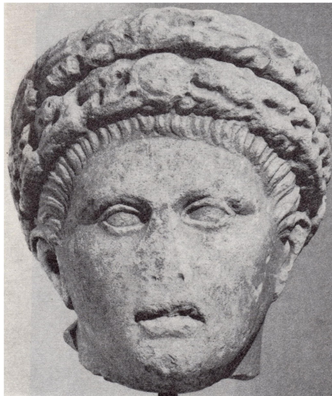
Προτομή του Κωνσταντίνου Β΄. Θάσος, Αρχαιολογικό Μουσείο.