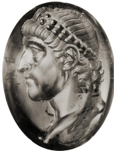
Αμέθυστος με την εγχάρακτη μορφή του Κωνσταντίου Β΄ (Berlin, inv. misc. 30931).