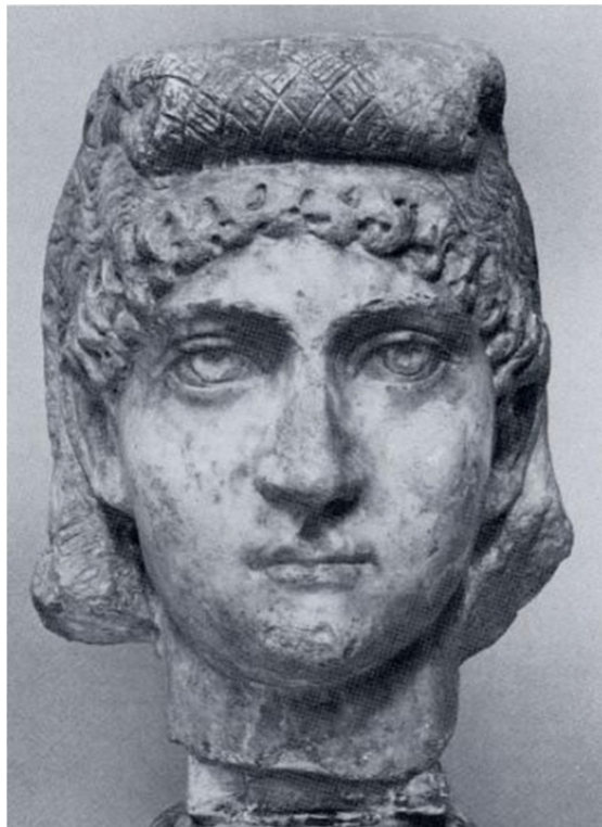
Προτομή της Κωνσταντίνας (LSA-993). Ρώμη, Musei Capitolini.