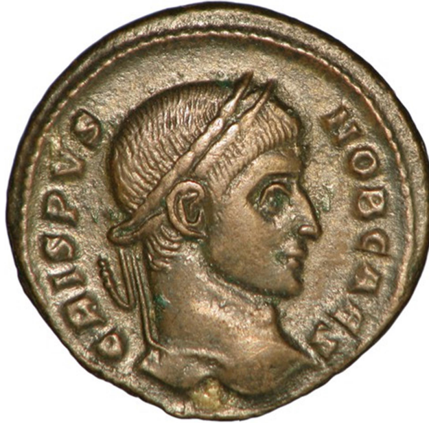
Νόμισμα του Κωνσταντίνου με την μορφή του Κρίσπου (Τύπος RIC VII Arelate 254). Νομισματοκοπείο Αρελάτης. Συλλογή American Numismatic Society. Πηγή: Βάση δεδομένων “Online Coins of the Roman Empire” ( http://numismatics.org/ocre/ ).