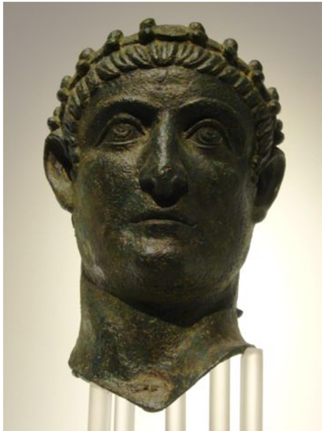
Χάλκινη προτομή του Κωνσταντίνου Α΄ από την γενέτειρά του, Ναϊσό (LSA-557). Βελγιάδι, Εθνικό Μουσείο.