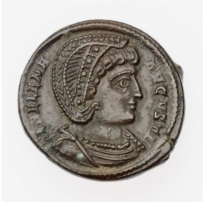
Νόμισμα του Κωνσταντίνου Α΄ ή Κωνσταντίνου Β΄ με την μορφή της Ελένης. Νομισματοκοπείο Τρεβήρων. Βοστώνη, Museum of Fine Arts.