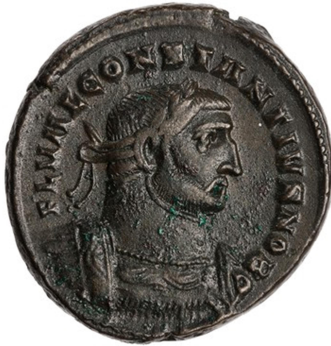
Νόμισμα του Κωνστάντιου Α΄ (Τύπος RIC VI Londinium 14a). Νομισματοκοπείο Λονδινίου. Συλλογή American Numismatic Society.