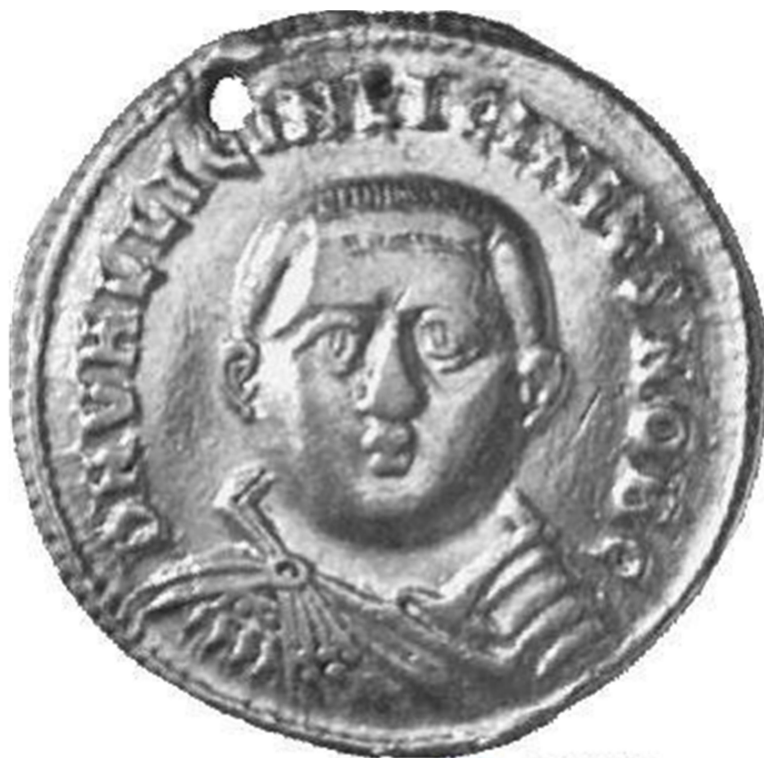
Νόμισμα του Λικίνιου Α΄ με την μορφή του Λικίνιου Β΄ (Τύπος RIC VII Nicomedia 42). Βερολίνο, Münzkabinett.

Κωνσταντίνο με την τεράστια συμβολή του Κρίσπου, ο Κωνσταντίνος χάρισε την ζωή στον Λικίνιο Α΄, μετά από παράκληση της Κωνσταντίας, αλλά μετά από λίγο άλλαξε γνώμη και τον εκτέλεσε για τα αδικήματά του 68 . Ο Λικίνιος Α΄ θανατώθηκε στις αρχές του 325, ενώ ο γιος του, Λικίνιος Β΄, δολοφονήθηκε λίγους μήνες αργότερα. Από αναφορά του Ζώσιμου προκύπτει ότι ο Λικίνιος Β΄ είχε γεννηθεί το 315 69 , οπότε όταν δολοφονήθηκε ήταν μόλις 10 ή 11 χρονών.