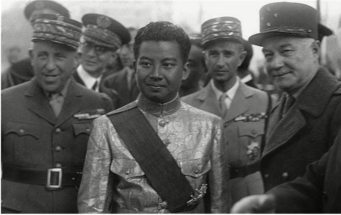
Ο πρίγκιπας Σιχανούκ περιτριγυρισμένος από τους Γάλλους αποικιοκράτες