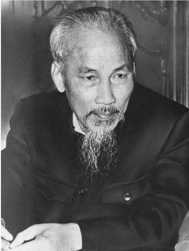
Ο Χο Τσι Μινχ με το τυπικό χιτώνιο που εισήγαγε ο Λένιν

τους δρόμο προς τον εκσυγχρονισμό και την πλήρη τους εκκοσμίκευση. Καθ' όλη τη διάρκεια που μελετάμε κάτι τέτοιο δεν αποτέλεσε δυνατότητα, όσο κι αν σε μία τέτοια συνθήκη ευελπιστούσαν σχεδόν όλοι οι ντόπιοι πρωταγωνιστές, όπως θα παρατηρήσουμε.