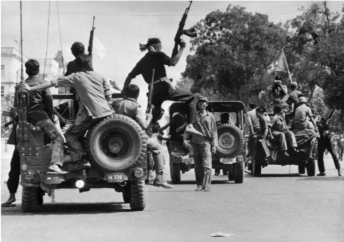
Οι Χμερ Ρουζ εν δράσει