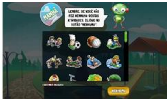
Tela para o relato das atividades físicas e comportamentos sedentários no Web-CAAFE.

Fonte: Web-CAAFE: http://caafe.ufsc.br/portal/10/detalhes .