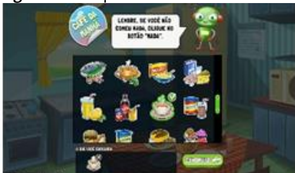
Tela para o relato do consumo alimentar no Web-CAAFE.