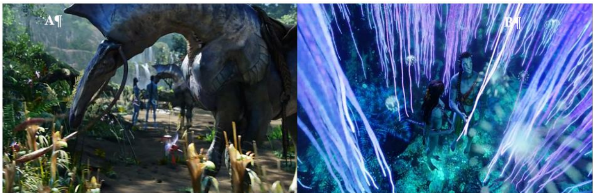
Figura 02 - A) Direhorse; B) Jake-Avatar e Neytiri se conectando à árvore das vozes

Os nativos podem estabelecer a ligação com as plantas. Isso pode ser percebido a partir da fala da Dra. Grace Augustine: “as árvores de Pandora formam uma gigantesca rede interconectada, se ligando a todos os seres vivos que lá habitam. O Na’vi podem acessá-la; eles podem fazer upload e download de dados” (AVATAR, 2009, 92’20”) (figura 2 B).