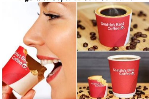
Figura 8: Copos de Café Comestível