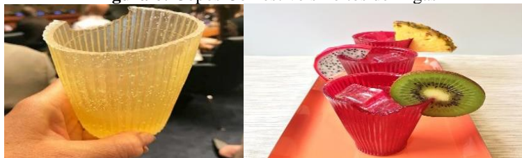
Figura 6: Copos Comestíveis Feitos de Algas