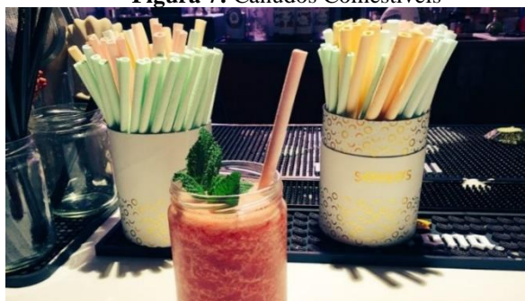
Figura 7: Canudos Comestíveis

Os Sorbos ao entrarem em contato com as bebidas geladas ou em temperatura ambiente resistem por 25 minutos sem se dissolver. Depois de usar o cliente pode consumir o canudo que é feito de gelatina, açúcar e amido, nos sabores limão, canela, lima, maçã-verde, chocolate, gengibre e morango. Ou caso seja descartados ele é um canudo biodegradáveis que causa menos impacto ao meio ambiente (CAMARGO, 2017, p. 1).