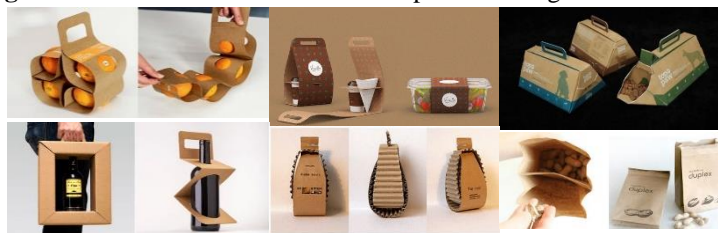
Figura 4: Ideias Práticas e Sustentáveis para Embalagens Take-out .