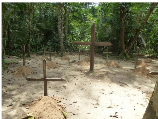
Figura 5: Cemitério cenográfico.

O local também conta com o cemitério cenográfico (Figura 5).