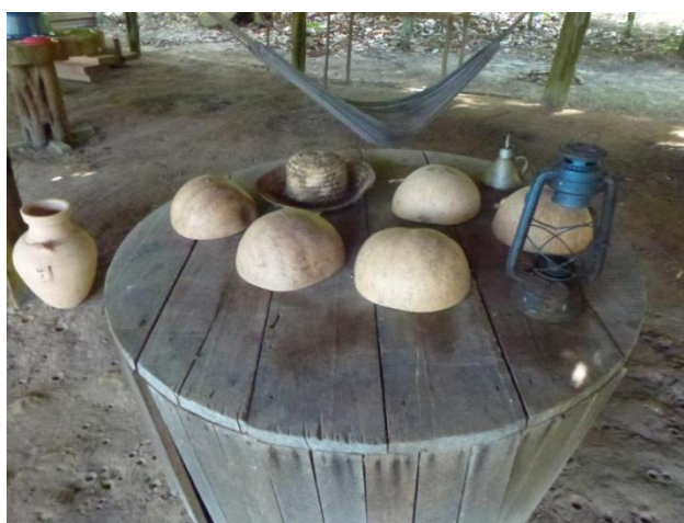
Figura 7: Barracão dos Seringueiros.

Posteriormente tem-se o barracão do seringueiro (Figura 7). Segundo Bueno (2012, p.39) Eucides da Cunha definiu seringueiro como “o homem que trabalha para escravizar-se”, a situação dos seringueiros naquela época era de muito trabalho e poucas regalias. No período da borracha os seringueiros, por irem à busca de oportunidades de sustento para suas famílias, eram subordinados a uma vida escrava e com condições muito precárias à própria sobrevivência e sem o devido reconhecimento legal no exercício da atividade (MOTA, 2015).