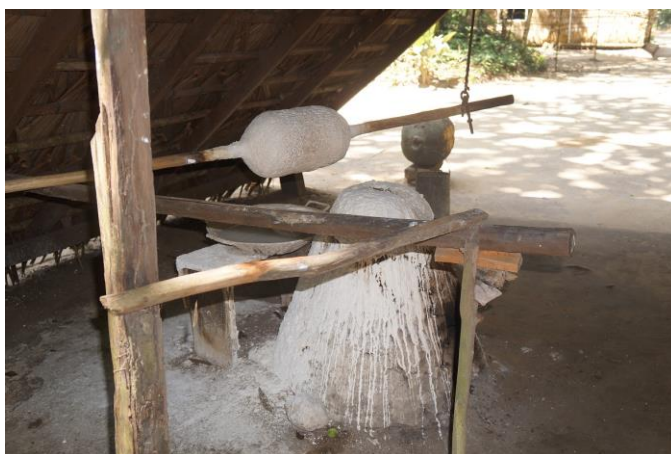
Figura 4: Processo de defumação da borracha.v

Outro ponto de parada é o tapiri (Figura 4), local onde se trabalhava no processo de defumação da borracha.