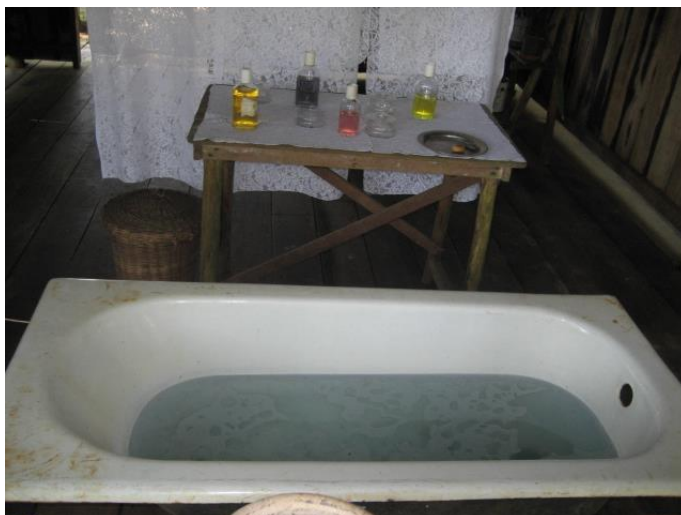
Figura 3: Banheira de dona Iaiá.

Posteriormente é possível visitar a casa de banho de Dona Iaiá (Figura 3), que foi construída para retratar no filme o romance entre Dona Iaiá e o cantador. O local tem uma banheira e perfumes.