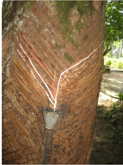
Figura 8: Extração do látex da árvore da “Seringa” ( Hevea brasiliensis )

Com isso, podemos pensar em diversos temas de ciências, como por exemplo, como extrair o próprio látex, qual a utilidade, ou mesmo trabalhar com a questão da produção de preservativos com o uso do látex e sua repercussão no controle de natalidade e prevenção das Infecções Sexualmente Transmissíveis (IST), isso tudo utilizando apenas um dos pontos do trajeto realizado. Esse contato de proximidade entre o aluno e o que normalmente só vê em livros, pode favorecer o interesse dos estudantes por Ciências.