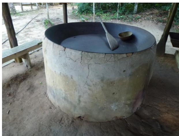
Figura 6: Forno onde a farinha era processada.

A seguir, tem-se a casa da farinha (Figura 6) onde é possível contextualizar o processo de produção da farinha, no qual até hoje é realizada. Nela encontram-se elementos como o forno onde se torrava a farinha, o tipiti que servia para espremer a mandioca e a partir disso era retirado o tucupi (líquido venenoso da mandioca); o remo utilizado para mexer a farinha no forno; a peneira para criar os caroços da farinha, entre outros.