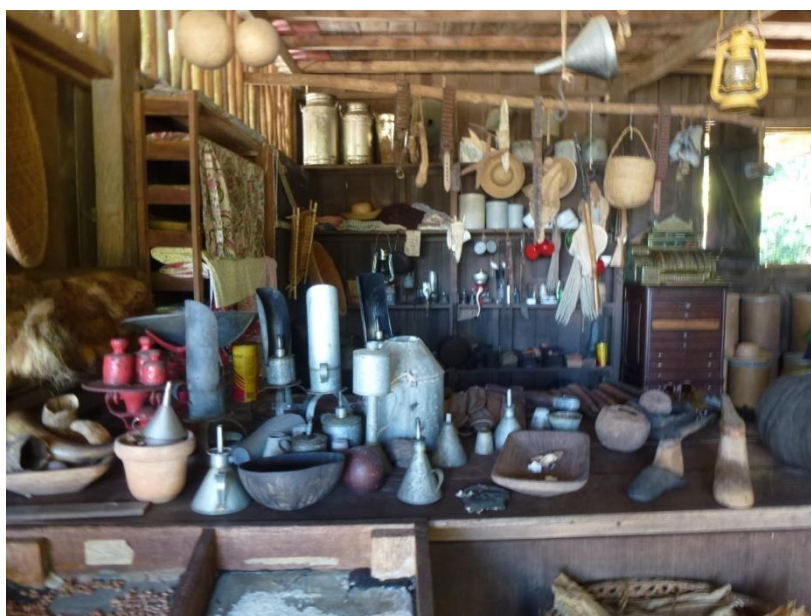
Figura 2: Vista frontal do Barracão de Aviamento.

A seguir tem-se o barracão de aviamento , local onde os seringueiros pegavam os instrumentos que precisavam para extrair o látex das “seringueiras” e o trocavam por alimento e acessórios pessoais (Figura 2). Porém, sempre que os “seringueiros” (chamados de brabos) pegavam materiais para extração do látex (raspador, faca, balde para coleta, facão) acabavam contraindo uma dívida imensa e o látex que retiravam nunca era suficiente para saná-la.