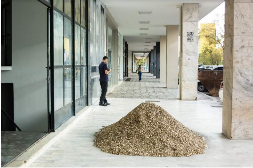
Figura 2: Gold Fever, Laura Andreato, 2017.