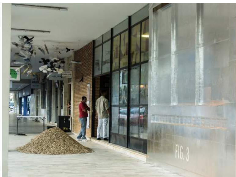
Figura 3: Renato Pêra, FIG. III (Espelhados), 2017.