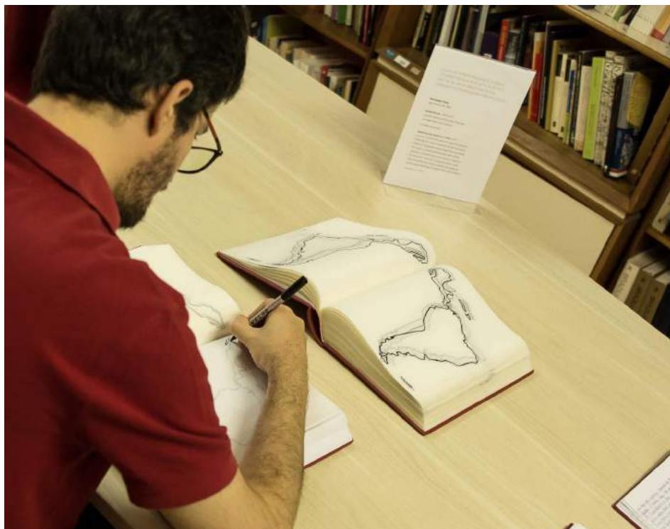
Figura 6: Fernando Piola, Autoretrato, 2015/17.