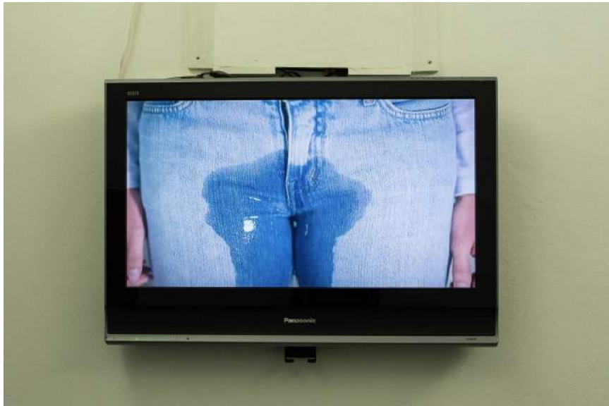
Figura 4: Dora Smék, Transborda, 2015.