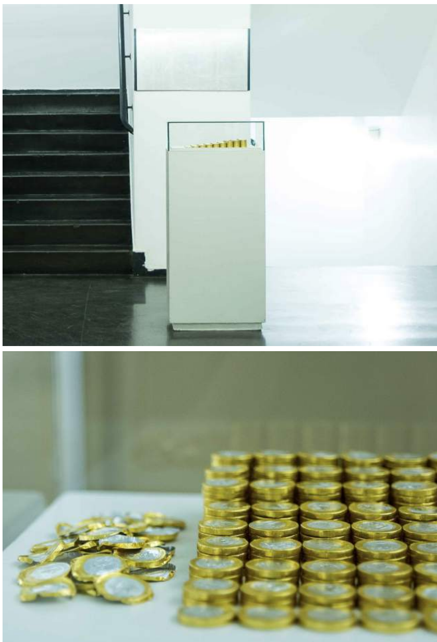
Figura 13: Laura Andreato, Lições de economia para iniciantes, 2017.