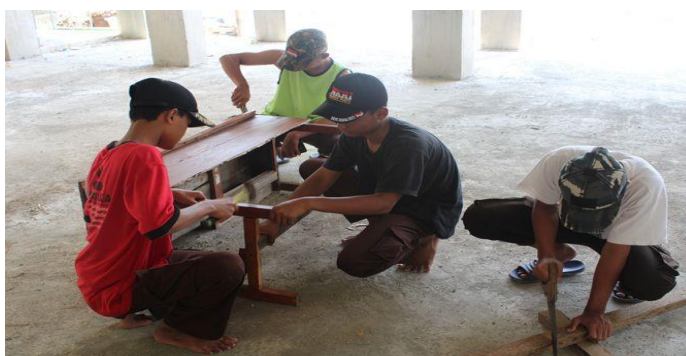
Gambar 1. Kegiatan ekstrakurikuler desain furniture

Berada di daerah pinggiran kota berjarak sekitar 20 km (30 menit perjalanan) dari pusat kota, MAN 5 Jombang adalah satu-satunya Madrasah Aliyah Negeri di kecamatan Ngoro Kabupaten Jombang dengan total jumlah kelas sebanyak 21 kelas, 490 peserta didik, didampingi oleh 30 guru dan 10 tenaga kependidikan. Dilihat dari jumlah siswa, guru dan tenaga kependidikan, potensi yang dimiliki oleh madrasah sangat besar untuk dapat terus berkembang sebagai madrasah yang unggul di Jombang. Dengan fasilitas yang tersedia, berbagai kegiatan dapat dilaksanakan dan potensi siswa dapat tersalurkan dengan baik. Membekali dengan beberapa ketrampilan tambahan, MAN 5 menyediakan 3 ketrampilan tambahan yaitu ketrampilan tata boga, tata busana dan desain furniture yang dapat dipilih sendiri berdasarkan keinginan siswa.