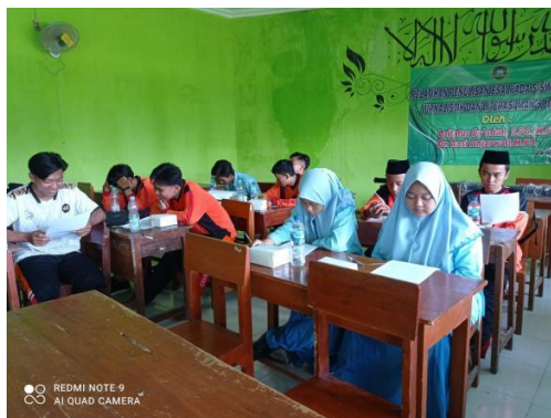
Gambar 5. Peserta mengidentifikasi struktur esai

berlangsung, dapat diketahui bahwa peserta mampu mengidentifikasi dan menganalisis struktur teks esai dengan baik dan benar.