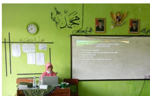
Gambar 8. Narasumber membimbing peserta menentukan topik esai

Pemilihan topik ini penting karena dari topik akan dibuat thesis statement yang sesuai dan menarik minat penulis untuk dituangkan dalam sebuah esai. Dengan memberi kebebasan pemilihan topik, diharapkan peserta dapat menulis sesuai dengan bakat dan ketertarikannya terhadap suatu hal. Sebaiknya, peserta memilih topik yang baik dan menarik. Topik yang baik harus memiliki ide yang jelas. Topik menarik adalah topik dengan tema khusus yang memiliki fokus dan kekhasan tersendiri serta menunjukkan karakter kuat dari penulisnya. Semakin fokus topiknya, semakin baik, sebagaimana semakin kuat karakter penulis terlihat, semakin baik kualitas esai.