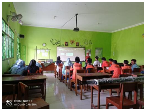
Gambar 3. Narasumber menjelaskan materi

Sesi selanjutnya adalah pengenalan tulisan esai pada peserta terkait langkah-langkah (struktur) pembuatan tulisan esai dan bagaimana cara mencari sumber pendukung tulisan esai. Narasumber menjelaskan semua materi tersebut menggunakan media PowerPoint.