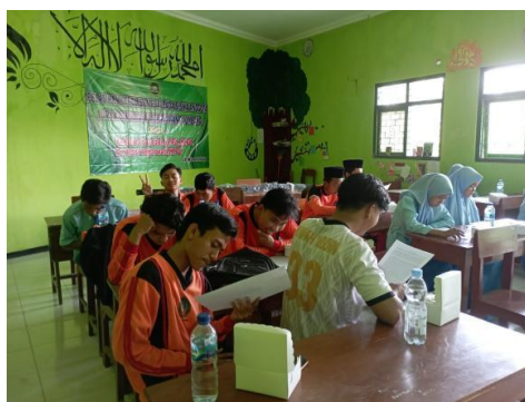
Gambar 6. Peserta mengidentifikasi unsur kebahasaan esai

Langkah kedua adalah mengenali unsur kebahasaan teks esai, diantaranya adalah beberapa kosa kata yang sering digunakan dalam menulis esai dan bagaimana kosa kata tersebut digunakan untuk menyusun thesis statement maupun supporting sentences . Berbekal pengetahuan dan pemahaman tentang struktur teks esai dan unsur kebahasaan teks esai, diharapkan mampu menyusun kerangka karangan teks esai.