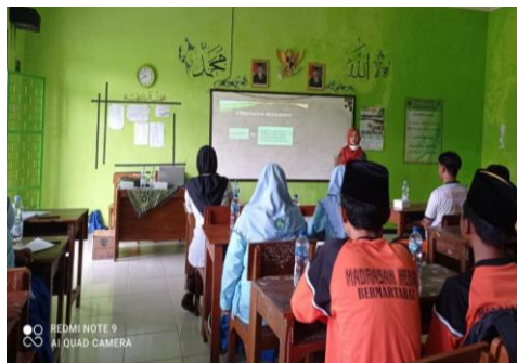
Gambar 7. Peserta menentukan topik esai

Mempersempit topik dapat dilakukan dengan memilih topik mana yang akan menjadi fokus penulisan peserta. Sejenak, peserta memikirkan kemungkinan bagaimana mengembangkan topik tersebut. Jika peserta memiliki gambaran untuk mengembangkannya, maka peserta dapat memilih topik tersebut. Namun sebaliknya, jika peserta berfikir bahwa peluang untuk mengembangkan topik tersebut kecil, maka disarankan agar segera ganti topik. Bagian terpenting adalah bahwa topik harus dipilih oleh peserta dengan mempertimbangkan penguasaan dan keleluasaan dalam mengembangkan topik.