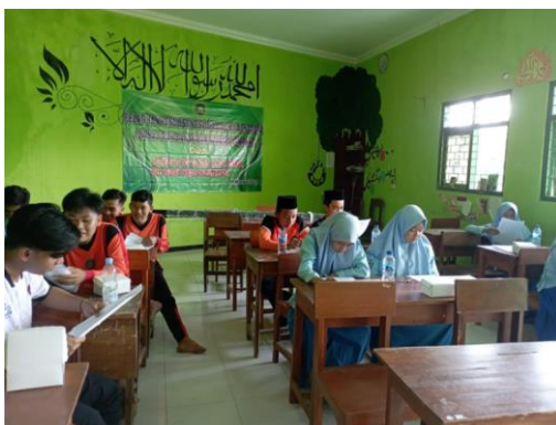
Gambar 2. Siswa dengan semangat mengikuti pelatihan

Kegiatan berlangsung lancar meskipun sebagian siswa cukup lelah karena baru menyelesaikan kegiatan olahraga, sehingga mereka mengikuti kegiatan pelatihan dengan menggunakan seragam olahraga. Meski demikian, semangat peserta mengikuti pelatihan tidak surut hingga akhir.