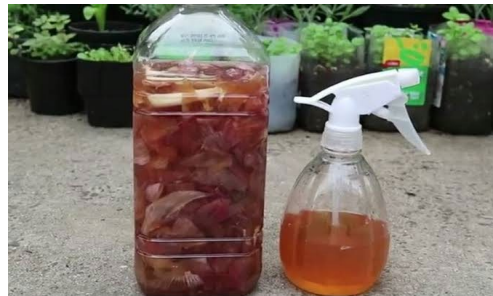
Gambar 3.4 Pestisida Limbah Kulit Bawang

Hasil dari pestisida telah diaplikasikan ke tanaman dikebun warga setempat. Dengan adanya pestisida dan pupuk organik ini masyarakat Desa Kota Lama merasa sangat terbantu karena dapat mengurangi pengeluaran biaya untuk merawat tanaman. Penggunaan pestisida dan pupuk organik menjadi alternatif baru dan jauh lebih aman untuk kesehatan manusia