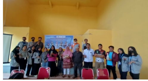
Gambar 3.3 Kegiatan Sosialisasi Pembuatan Pestisida Organik dan Pupuk Kompos dari Limbah Kulit Bawang

Hasil dari pestisida telah diaplikasikan ke tanaman dikebun warga setempat. Dengan adanya pestisida dan pupuk organik ini masyarakat Desa Kota Lama merasa sangat terbantu karena dapat mengurangi pengeluaran biaya untuk merawat tanaman. Penggunaan pestisida dan pupuk organik menjadi alternatif baru dan jauh lebih aman untuk kesehatan manusia