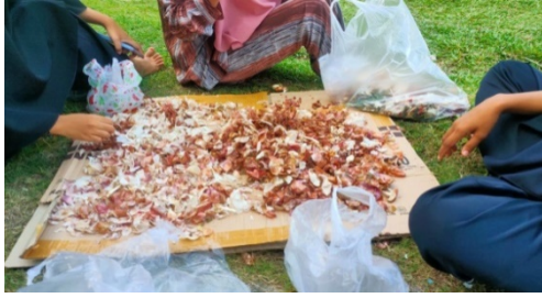
Gambar 3.1 Proses penyortiran limbah kulit bawang dengan limbah lainnya