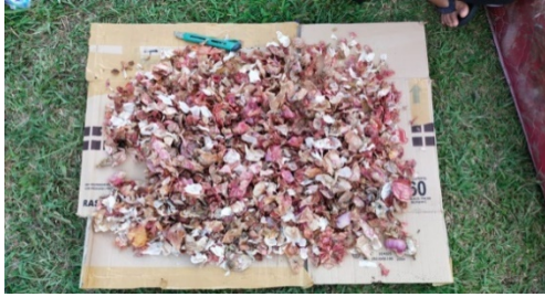
Gambar 3.2 Proses penjemuran kulit bawang yang sudah disortir

Pembuatan pestisida dan pupuk organik dari limbah kulit bawang ini dilakukan karena melihat dari keluhan masyarakat tentang harga pestisida dan pupuk yang kian meningkat. Masyarakat sangat antusias selama proses pelaksanaan kegiatan ini. Kegiatan pembuatan pestisida organik bertujuan sebagai obat bagi tanaman yang di budidayakan petani di Desa Kota Lama. Pestisida organik yang dibuat diketahui berfungsi dalam mencegah serangan hama pada tanaman yang dibudidayakan warga setempat. Bila dibandingkan dengan pestisida kimia, pestisida organik mempunyai beberapa kelebihan. Pertama, lebih ramah terhadap alam, karena sifat material organik mudah terurai menjadi bentuk lain. Sehingga dampak racunnya tidak menetap dalam waktu yang lama di alam bebas. Kedua, residu pestisida organik tidak bertahan lama pada tanaman, sehingga tanaman yang disemprot lebih aman untuk dikonsumsi. Ketiga, dilihat dari sisi ekonomi penggunaan pestisida organik memberikan nilai tambah pada produk yang dihasilkan.