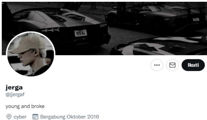
Gambar tampilan lini masa @jjergaf