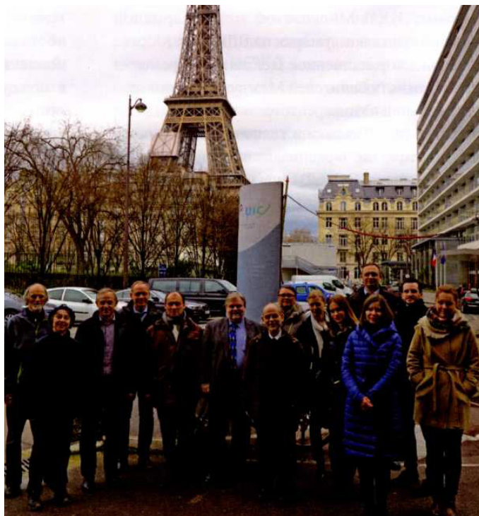
Рис. 11. Участники совместного заседания Группы терминологии МСЖД–ОСЖД (Париж, октябрь 2015 г.).

ОСЖД» был удостоен Диплома I степени в номинации «Лучшее полиграфическое исполнение».