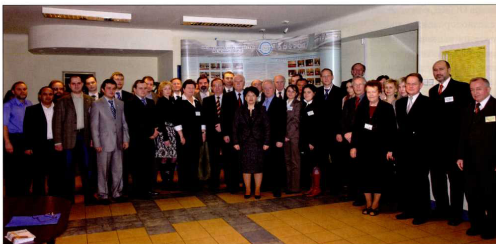
Рис. 7. Участники юбилейного заседания Редакционной коллегии журнала «Бюллетень ОСЖД» и международного семинара на тему «Роль специализированных железнодорожных изданий в развитии железных дорог», посвящённых 50-летию образования журнала и выходу в свет его трёхсотого номера (08–09.12.2008, Комитет ОСЖД).

пресс-служб, железных дорог и международных организаций в области транспорта. Всего на первом в истории железных дорог форуме железнодорожных печатных издательств стран – членов и наблюдателей ОСЖД присутствовало более 50 делегатов из 27 стран.