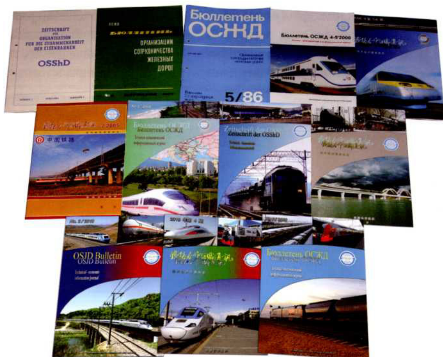
Рис. 3. Обложки «Бюллетеня ОСЖД» разных годов выпуска.

дизайна, технико-полиграфического исполнения, а также оперативность и актуальность предоставляемой информации.