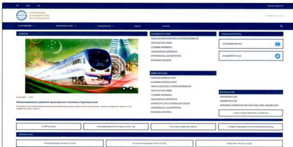
Рис. 4. Основная страница Web-сайта ОСЖД, поддерживаемого на русском, китайском и английском языках.

и грузовыми (ПГВ) вагонами в международном сообщении, тарифы (МПТ, МТТ и ЕТТ), ГНГ, договоры, соглашения, памятки и все другие документы, принятые и действующие в рамках ОСЖД.