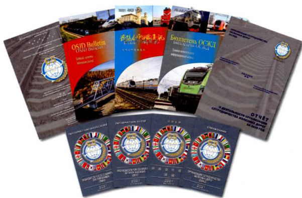
Рис. 5. Издания редакции «Бюллетеня ОСЖД».