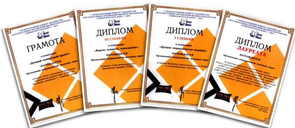
Рис. 9. Награды для ОСЖД за лучшие периодические печатные издания на иностранных языках по направлению «Техника и технологии наземного транспорта».