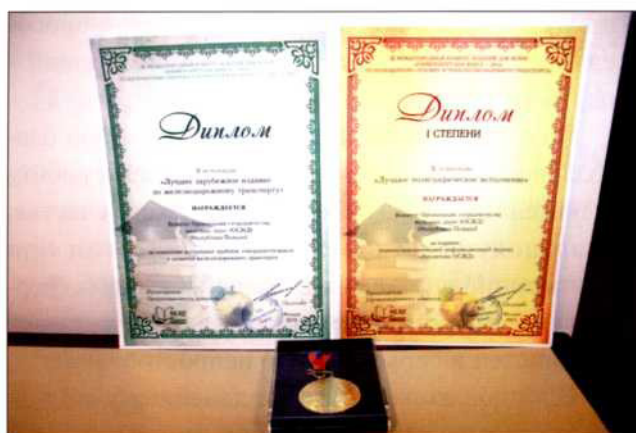
Рис. 8. Дипломы и медаль, которыми были удостоены Комитет ОСЖД за победу в III Международном конкурсе «Университетская книга-2015».