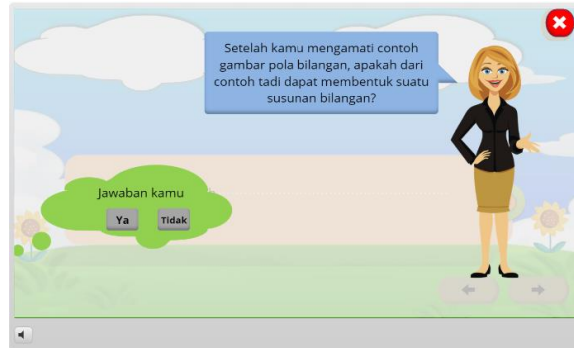
Gambar 3. Tampilan Materi 2

diberikan keterangan untuk dapat memudahkan siswa dalam menyimpulkan pengertian dari pola bilangan. Selain itu agar lebih mendukung siswa dalam menyimpulkan konsep pola bilangan, diberikan suatu pertanyaan yang mendukung yang ditampilkan pada gambar berikut.