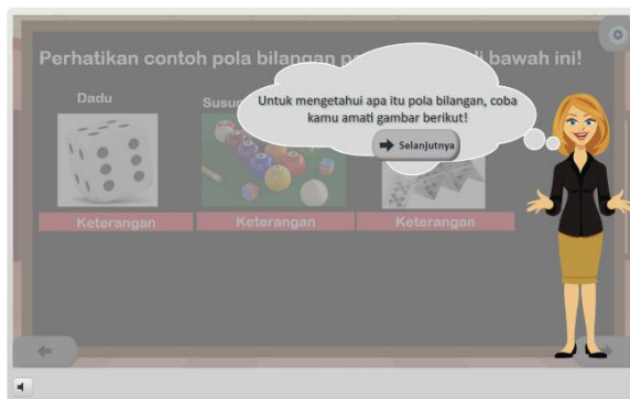
Gambar 2. Tampilan Materi

Pada tahap pengembangan mulai dilakukan pembuatan produk sesuai dengan perancangan yang telah dibuat sebelumnya yaitu membuat media pembelajaran interaktif dengan pendekatan kontekstual. Dalam pengembangan medianya menggunakan aplikasi Articulate Storyline 3 . Berikut ini merupakan hasil dari pembuatan produk.