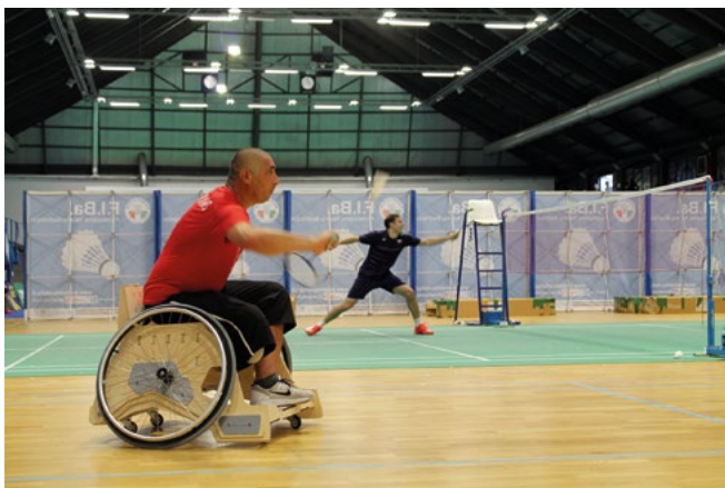
Figura 2. Fase di testing in collaborazione con la squadra italiana di para-badminton.

Un prototipo può avere finalità, materiali e aspetto differenti: dal modello di carta al modello realistico prossimo al risultato definitivo. La necessità di strumenti e macchinari diversi ha reso il Fablab Torino uno spazio chiave non solo per l'interazione con le persone della community, ma anche per la disponibilità di macchinari CNC (Computer Numerical Control) per la prototipazione rapida utilizzabili grazie alla condivisione delle competenze tra le persone. Questo avviene sia a livello locale che a livello globale grazie alla condivisione di tutorial, progetti, sperimentazioni e know-how che la comunità mondiale dei Makers rende disponibili in Open Source permettendo la formazione a distanza di altre persone, oltre ovviamente alla possibilità di sviluppo dei progetti con implementazioni libere e condivise. Questo iter ciclico di prototipazione, condivisione, confronto multidisciplinare, test, riprogettazione e prototipazione, viene accelerato dalla facilità nella realizzazione dei modelli, della condivisione delle informazioni via web, e dal coinvolgimento nel progetto di una platea sempre più ampia: dal locale al globale. Nel caso specifico di Toowheels, nella fase iniziale di