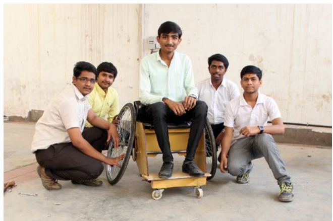
Figura 3. Il team di sviluppo della Gujarat Technological University.