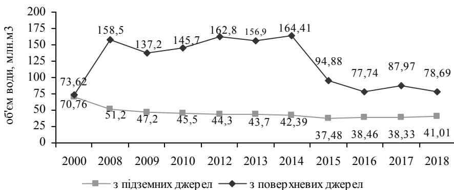
Рис. 1. Динаміка забору води з поверхневих та підземних водних джерел у Рівненській області за 2000–2018 рр., млн м 3

Для виконання оцінки кількісного стану підземних вод, що використовуються для забезпечення населення області водою нами були використані дані, представлені у «Національній доповіді про якість питної води та стан питного водопостачання в Україні у 2018 році» [8]. Основні дані щодо забору і використання води із природних джерел в Рівненській області у 2017–2018 роках наведено у рис. 1 та табл. 1.